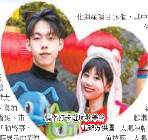
情侶打卡遊玩歡樂谷。

年初五，深圳市大鵬新區舉辦了2024大鵬新區「非凡大鵬 遺遊未盡」非遺巡遊大賞活動。在悅耳的大鵬山歌和精彩的涼帽舞中活動緩緩拉開帷幕，世界最大青獅王隆重亮相。伴隨着遊客的歡呼聲，2024大鵬新區「非凡大鵬 遺遊未盡」非遺巡遊大賞啓動。獅舞（青獅）、大鵬山歌、葵涌客家茶果製作技藝等20位國家級、省級、市級、區級非遺項目傳承人共同見證活動啓幕，他們在所城內的不同點位，用非遺技藝展示中華傳統文化魅力。