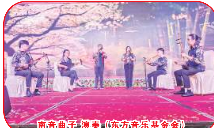
南音曲子演奏(東方音樂基金會)