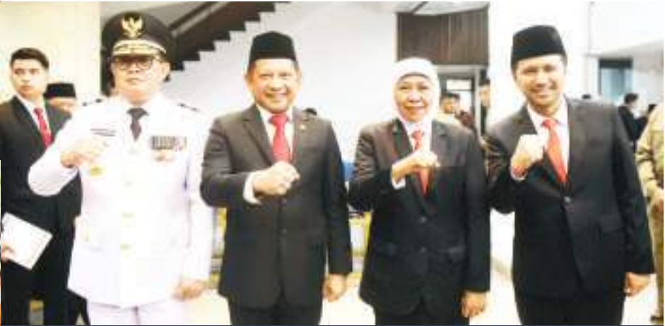
内长委任东爪哇省代省长和代副省长 2月16日,内政部长迪托(左二)在东爪哇省前任省长科菲花(右二)陪同下,委任AdhyKaryono(左)和Emil Ealestianto Drdak(右)分别成为代任东爪哇省长和代副省长。