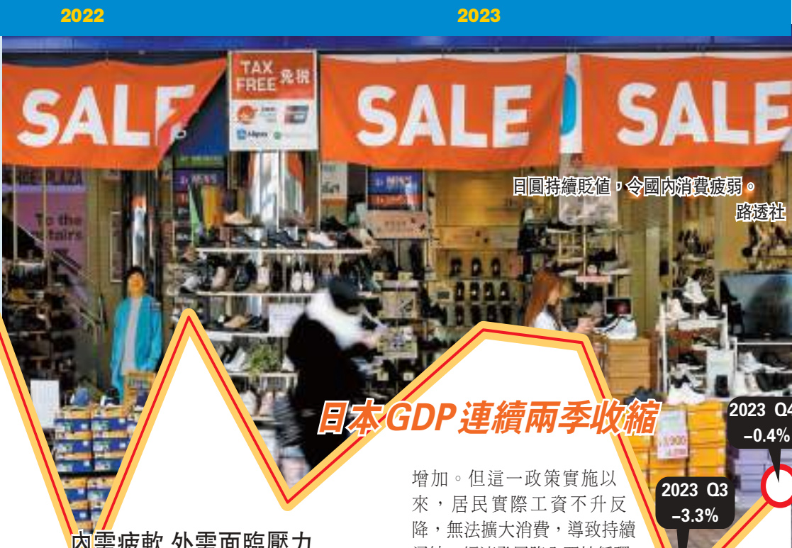
內需疲軟 外需面臨壓力

日媒分析認為，如果日本在全球經濟所佔的份額繼續縮小，可能導致在國際的話語權降低。