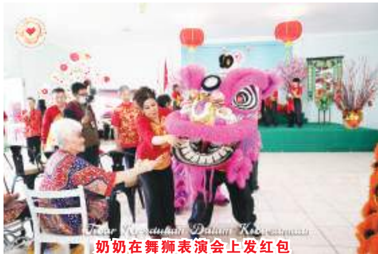
奶奶在舞狮表演会上发红包