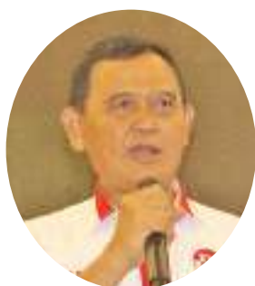
艾果国民军退役中将