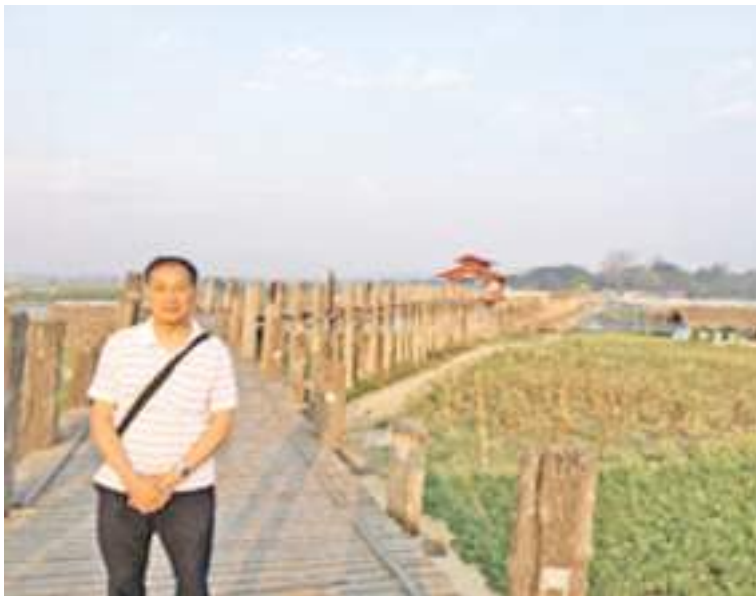
桥上留影，凉风吹面，眺望蔚蓝长空，心情悠然自得

醉美的缅甸，神秘的国度，有许多名胜古迹，美丽的风景，让人向往，著名的千年不朽柚木桥，值得我们去游览。