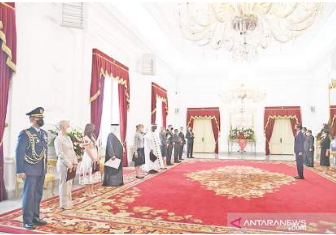
九名友好国家大使向佐科维总统递交国书。

【本报讯】2月15日，九名友好国家特命全权大使在雅加达独立宫向佐科维总统递交了国书。递交国书标志着正式任命驻印度尼西亚大使的开始。全权证书的颁发是通过在独立宫举行的一系列活动进行，现场还演奏每个国家的国歌。