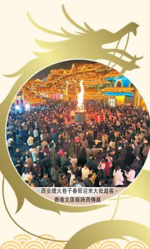
◆西安煙火巷子春節迎來大批遊客。