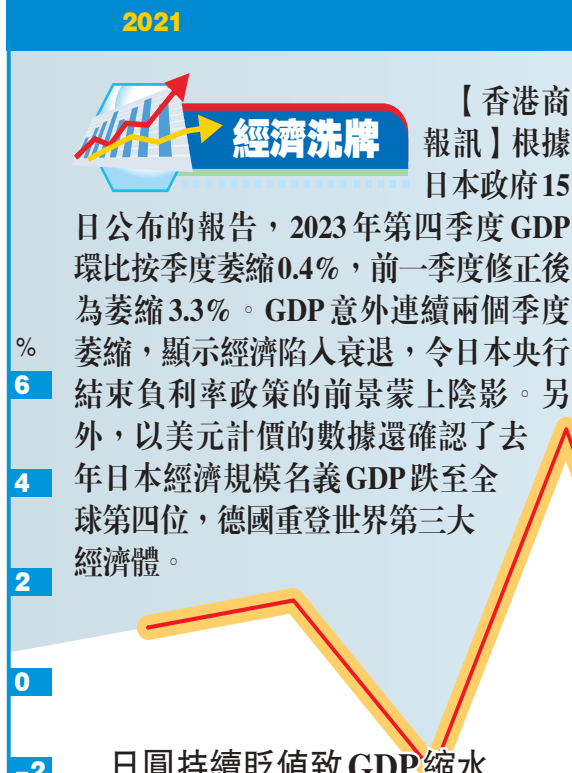
日本GDP連續兩季收縮

不過，當局又指以衝突及俄烏戰事潛在升級危機，或進一步阻礙全球供應鏈及大宗商品市場，影響全球貿易及經濟增長。其次，緊縮貨幣政策存在滯後效應，或觸發銀行及金融體系的弱點，導致區域經濟體對外部金融需求壓力增加。