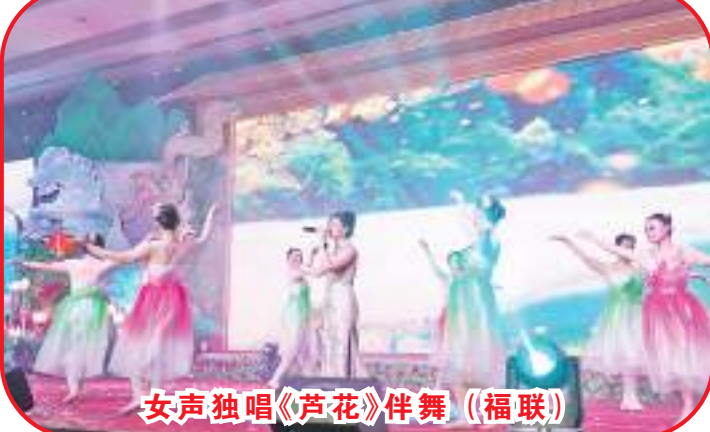
女聲獨唱《蘆花》伴舞(福聯)