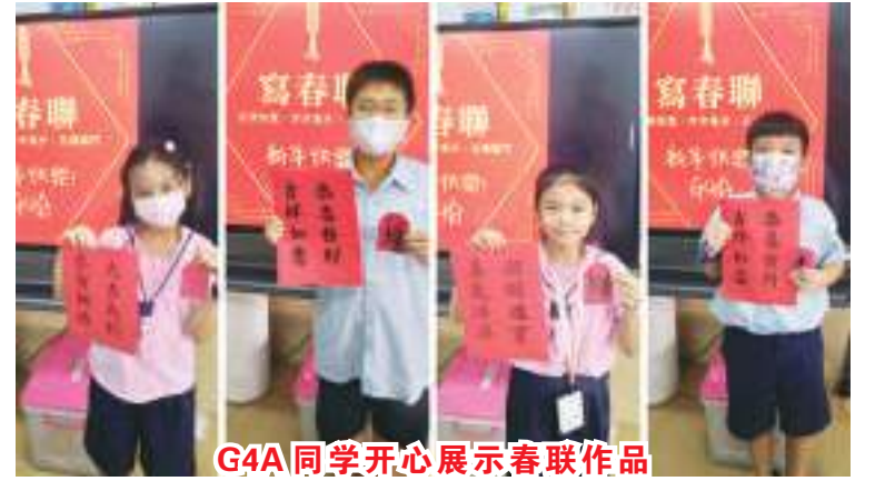
G4A 同学开心展示春联作品

【本报雅加达讯】今年2月10日是一年一度的华人阴曆春节初一，在传统中华文化中备受重视，无论从前或现在，过年习俗都会书写、张贴春联，亲友间也互相拜年。为迎接新春，雅加达台北学校(JAKARTA TAIPEI SCHOOL)秉持传承中华文化的精神，配合中文、艺术课程，举办写春联活动。