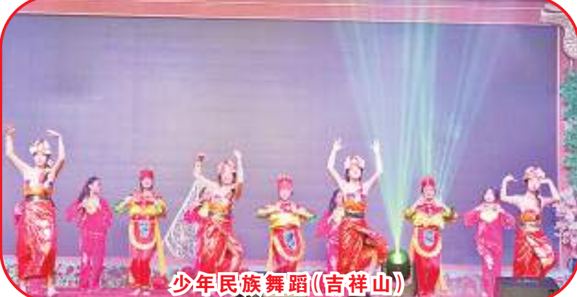
少年民族舞蹈(吉祥山)