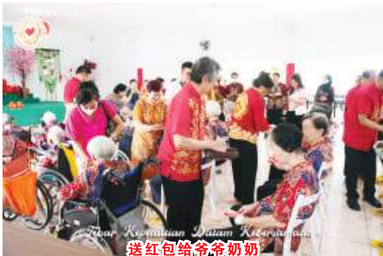
送红包给爷爷奶奶