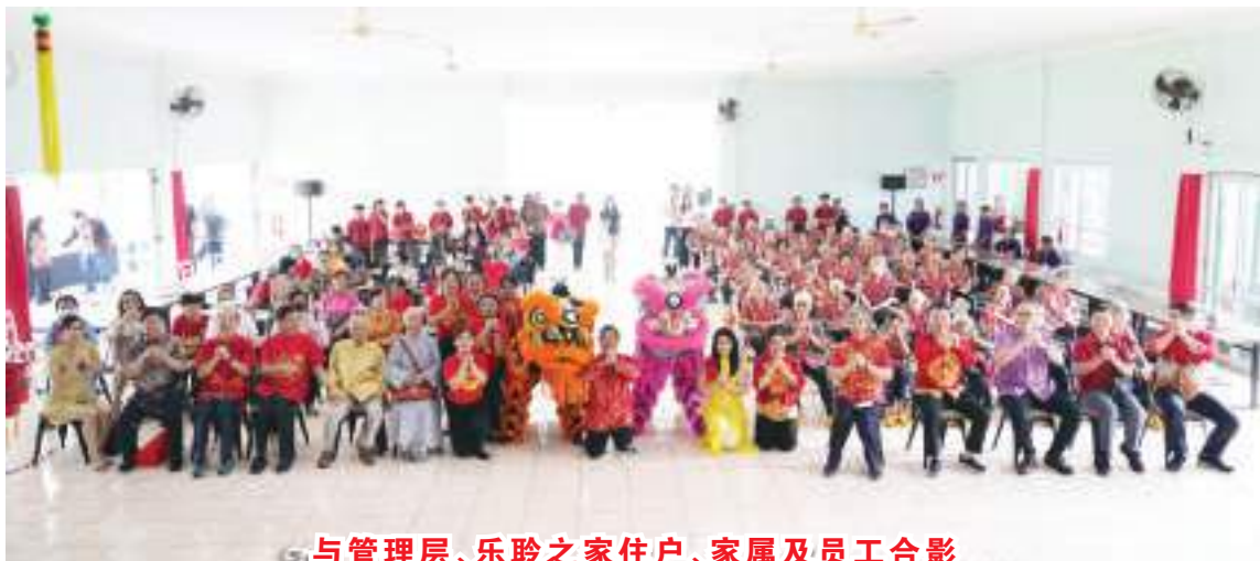
与管理层、乐龄之家住户、家属及员工合影

奶奶献唱“听我说谢谢你”时,欢乐的气氛继续延续下去,当爷爷奶奶收到参加活动的受邀者分发红包时,喜悦之情溢于言表。农历新年活动在爷爷奶奶和员工唱的《听我说谢谢你》的歌声中徐徐落下帷幕。(SH-BAM/HAN)