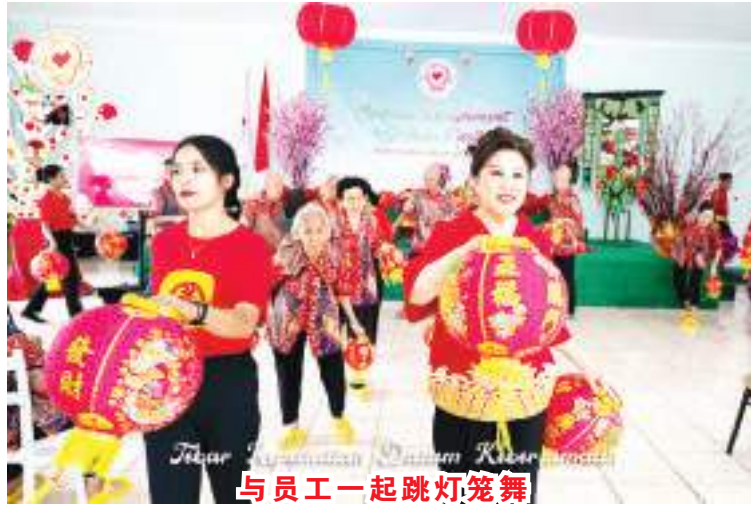
与员工一起跳灯笼舞