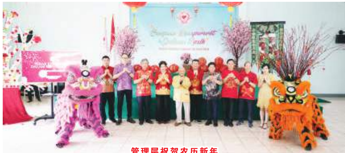
管理层祝贺农历新年