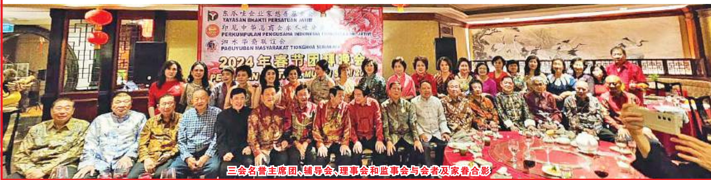
三会名誉主席团、辅导会、理事会和监事会与会者及家眷合影