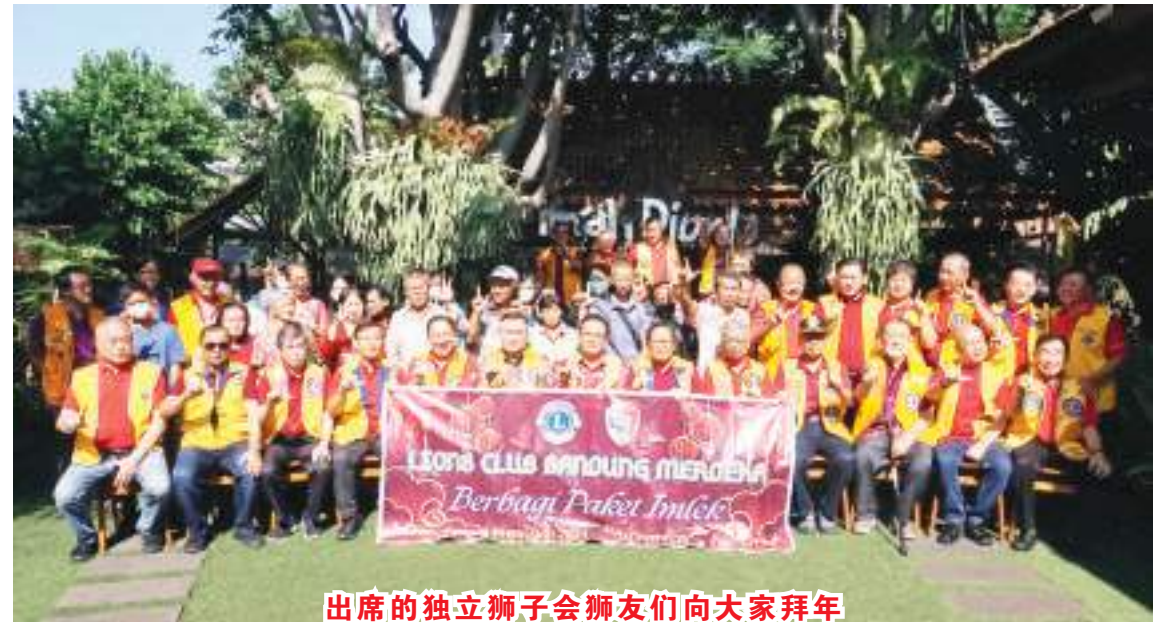
出席的独立狮子会狮友们向大家拜年