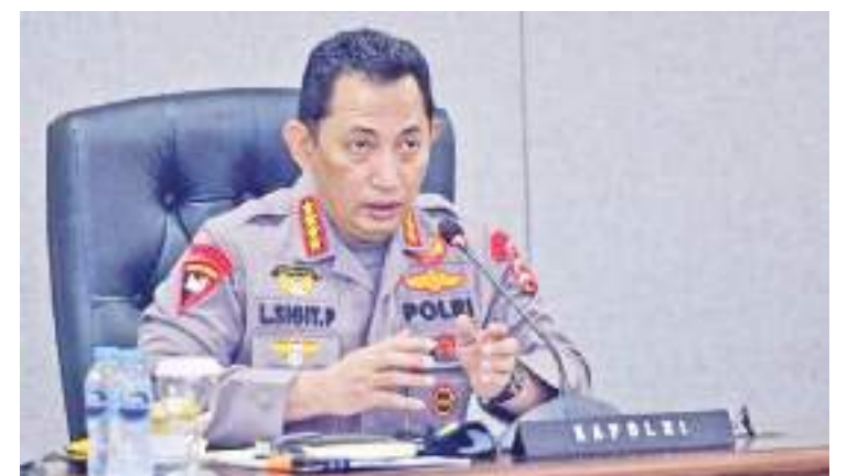
总警长里斯提约将军。