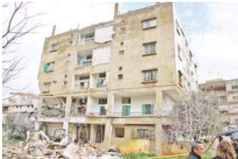
这是2月15日在黎巴嫩奈拜提耶拍摄的一栋在空袭中被毁的房屋。

新华社北京2月16日电据黎巴嫩国家通讯社15日报道,以色列前一天对黎南部多个地区空袭致死平民人数升至10人,其中有7名死者属于同一家庭。