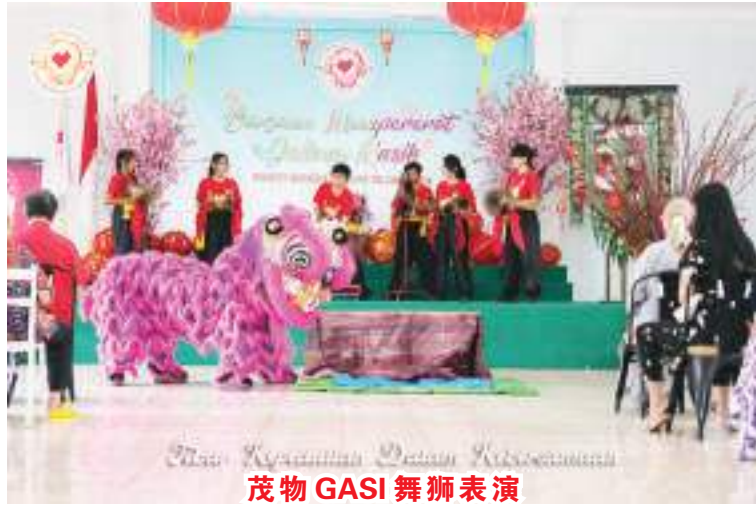
茂物 GASI 舞狮表演