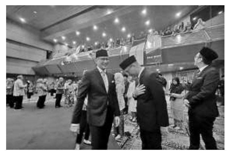
旅游部大楼或将像莎莉娜一样 2月16日,旅游与创意经济部长善迪亚卡(Sandiaga Uno)声称,他希望旅游与创意经济部的大楼能成为像莎莉娜大厦一样。