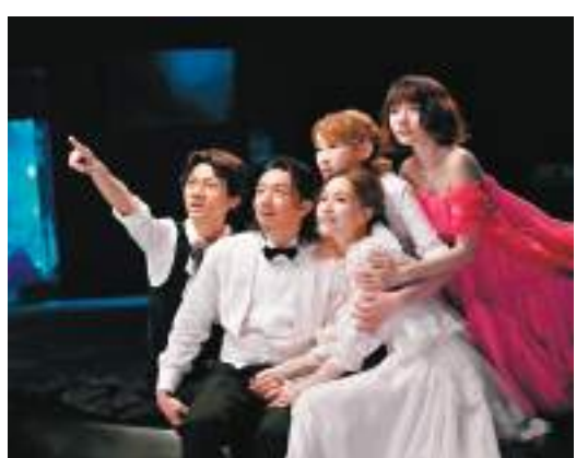
《飯戲攻心2》榮登今年港產賀歲片票房冠軍。

香港文匯報訊 2024龍年賀歲港產片《飯戲攻心2》上映5日票房報捷,影片在開畫日及單日票房成績均超越首集,除夕至大年初四5日收2,100萬元票房,榮登今年賀歲片票房冠軍!而截至年初六,電影經已衝破2,500萬元票房,團隊宣布將會巡迴全港戲院謝票,導演陳詠詠(Sunny)以及一眾演員接力現身戲院,與觀眾近距離接觸,謝票之餘更與眾同樂大派有福米,延續賀年歡樂氣氛!