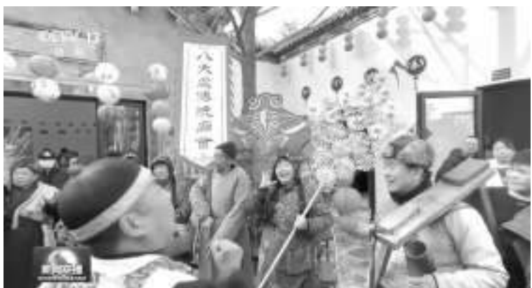
春节假日,神州大地一片欢乐,人们在浓浓的喜庆气氛中欢度新春佳节。

在北京的新春文化庙会上,老北京的吆喝声、鼓乐声,相声、京剧等特色活动轮番上演,让游客感受浓浓的京味儿文化。在河南郑州,新春大巡游、非遗技艺等各种特色民俗表演,从早到晚好戏不断。游客:今天能吃到家乡的馒头,觉得这个年味儿还是蛮浓的。