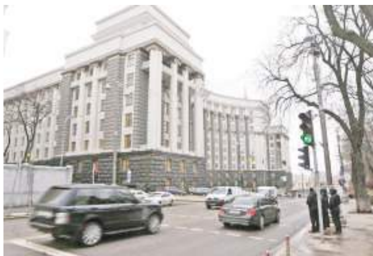
这是2022年2月10日在乌克兰基辅拍摄的政府办公大楼。

新华社北京2月16日电乌克兰、德国和法国政府证实,乌总统弗拉基米尔·泽连斯基定于16日先后访问德、法两国,将分别签署双边安全协议。