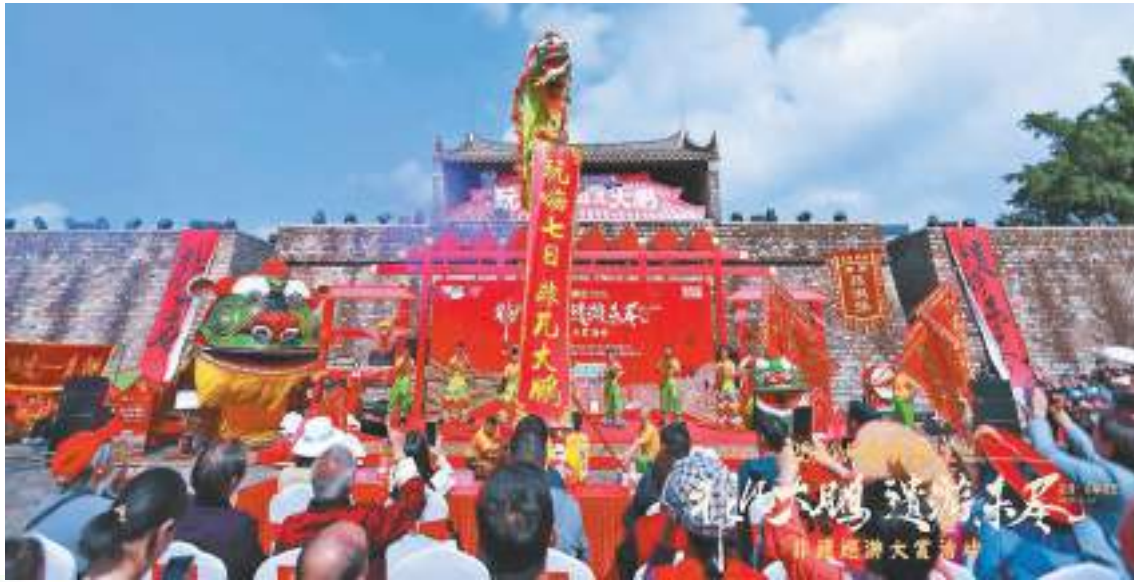
非遺巡遊大賞活動現場。

【香港商報訊】記者羅國淮、蔡易成、王靜抒報道：大年初五，民間有「接財神」的習俗，深圳晴朗清爽的好天氣讓眾多市民紛紛出門，逛街購物、休閒玩樂、打卡美食，一個個民俗文化表演贏得陣陣掌聲、喝彩聲，與鑼鼓聲匯成一片，拉滿過年氛圍；各大商圈人頭攢動，熱門餐飲店排號等位，電影院場場爆滿，龍年深圳春節消費市場「熱辣」又不失「甜蜜」。