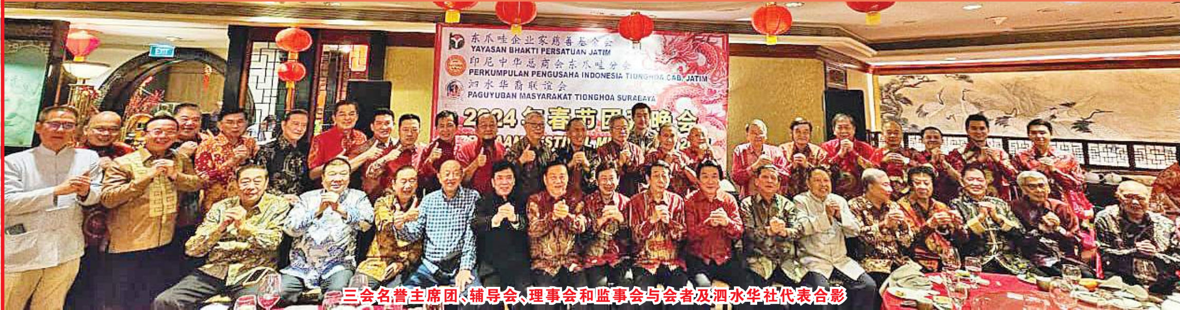
三会名誉主席团、辅导会、理事会和监事会与会者及泗水华社代表合影

【本报讯】2024年2月15日，春意盎然，一场盛大的春节团拜晚会在泗水万豪酒店唐宫如期举行。此次团拜由东爪哇企业家慈善基金会、印尼中华总商会东爪哇分会与泗水华裔联谊会三会联合主办。