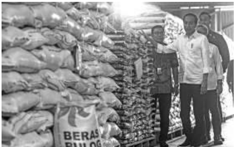
总统视察勿加西粮储局米仓及分发大米援助 佐科维总统于2月16日在西爪哇省勿加西(Bekasi) Cibitung镇的粮储局米仓进行视察,并向受惠家庭发放大米援助。