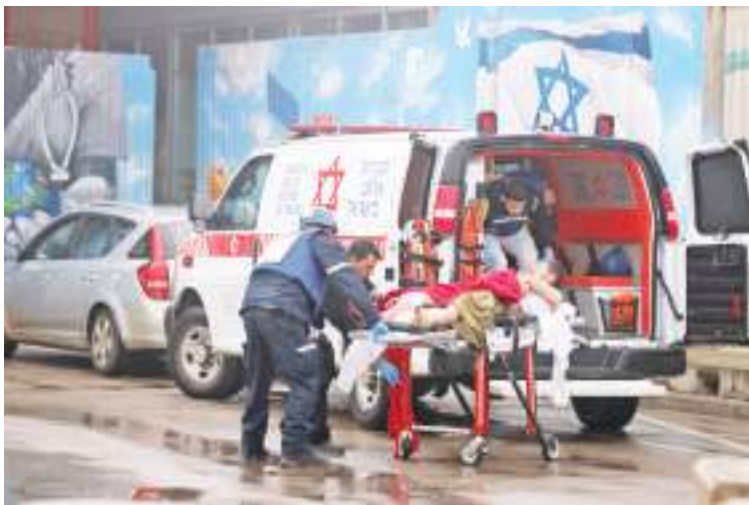
2月14日,在以色列采法特,遭火箭弹袭击的伤者被送至医院接受治疗。

以色列国防军14日下午说,以色列北部多地当天上午遭到来自黎巴嫩的火箭弹袭击,造成1名平