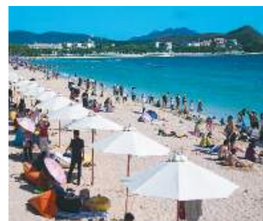
1月31日，海南省三亚市大东海海滨景区游人如织。