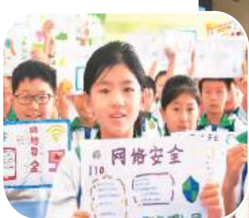
▲ 河北省邯郸市永年区洺州小学的孩子展示网络安全手抄报。 ▶ 广东省韶关市一家企业员工正在通过数据“算法”组织生产。

因为“计算”,用户获取信息成本大幅降低,网络服务更加精准高效。然而,越来越多用户担心被“算计”,日益关注“信息茧房”“大数据杀熟”“诱导沉迷”等问题。“别让‘算法’成为‘算计’”成为网民共同心声。