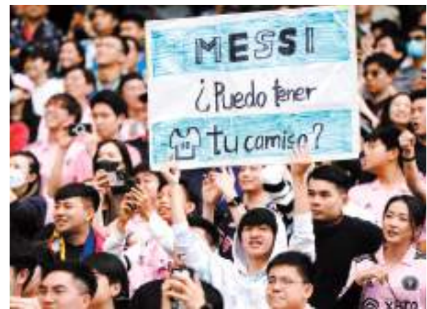
◆球迷熱情最終卻換來失望。