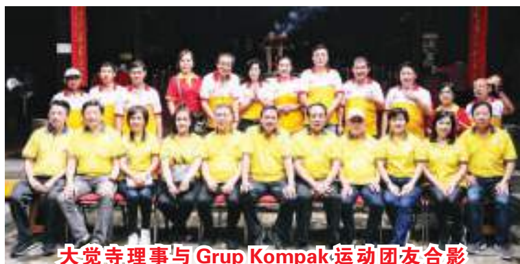
大觉寺理事与 Grup Kompak 运动团友合影