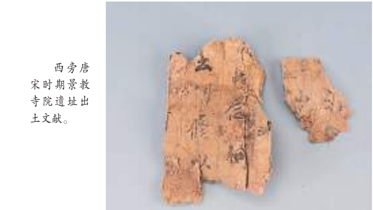
西旁唐时期景教寺院遗址出土文献。