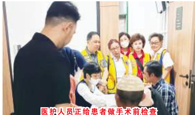
医护人员正给患者做手术前检查

际独立狮子会 307B2 区 (LCB.Merdeka)、明星狮子会 (LCB.All Star)、欢乐狮子会 (LCB.Ceria)、自由狮子会 (LCB.Liberty)、大万隆狮子会 (LCB.Bdg Raya)、桑古利昂狮子会 (LCB.Sangkuriang)、明月狮子会 (LCB.