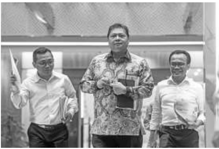
2023年全国平均经济增长率5.05%

经济统筹部长艾朗卡(Airlangga Hartarto/中)于2月5日在雅加达办事处说明我国在2023年经济增长率达5.05%。