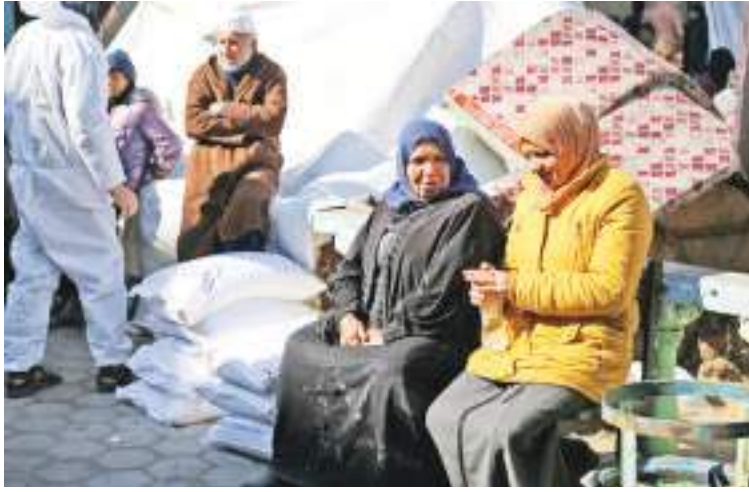
1月28日,在加沙地带南部城市拉法,人们准备领取联合国近东救济工程处提供的救助物资。