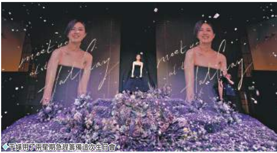
◆千嬅用了兩星期急起籌備這次生日會。