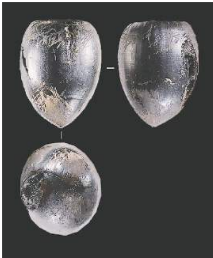
濠溪河旧石器时代遗址出土的橡果。