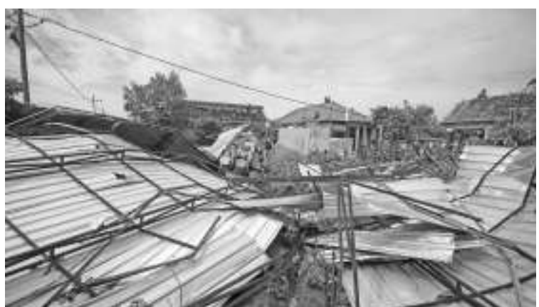
东爪哇省徐图利祖出现旋风灾难 1人丧生

东爪哇省徐图利祖(Sidoarjo) Prambon镇Kedungwonokerto乡于2月5日遭旋风袭击,200间民房和建筑物损坏,许多大树倒塌,1人遭屋瓦击中身亡。