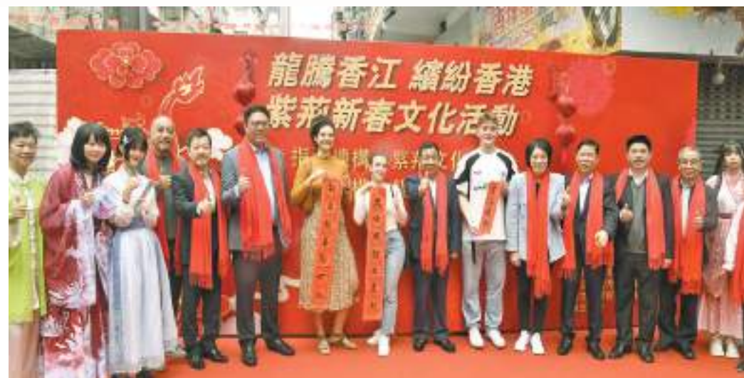
「龍騰香江 繽紛香港」活動在油麻地廟街舉行。

廟街現場人頭湧湧，北京遊客孫先生表示：「寫揮春、捏泥偶等活動都充滿民俗氣氛，活動能體驗到香港過年的不同風俗，希望香港可以繼續將這份傳統文化發揚光大。」有尼泊爾裔街坊表示：「活動能讓我們了解香港乃至廟街的歷史，生活在香