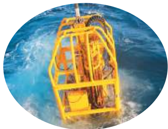
“海牛Ⅱ号”入水，开始下潜进行钻探作业。