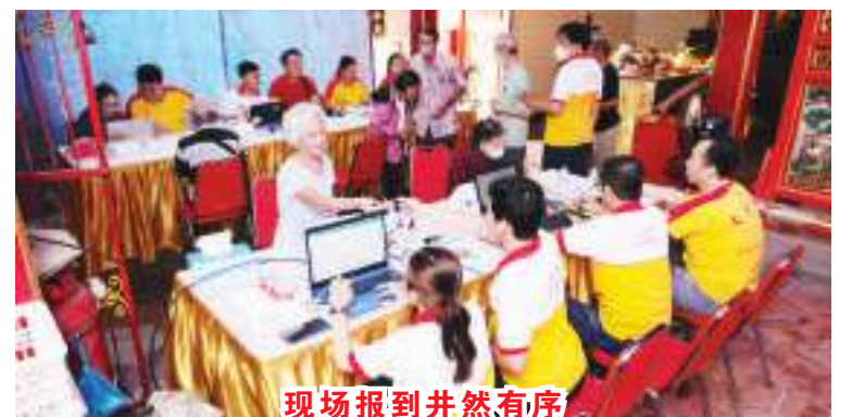
现场报到井然有序