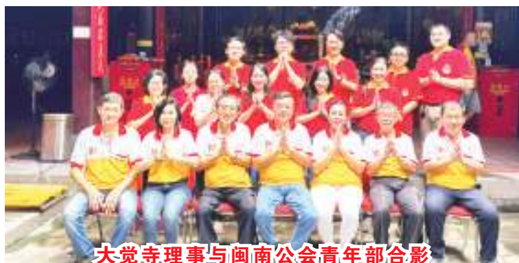
大觉寺理事与闽南公会青年部合影