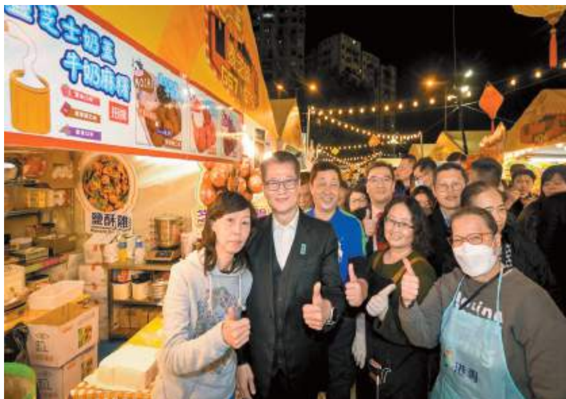
陳茂波參觀「龍騰觀塘新春夜市」時，與攤檔檔主互动交流。

本月26日，政府將首次舉辦融合綠色科技和綠色金融這兩大主線的「香港綠色周」，一連六日共舉行十多場不同形式的論壇和活動。為「香港綠色周」打