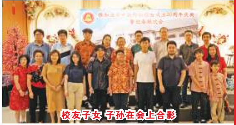
校友子女 子孙在会上合影