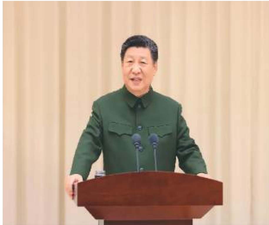
二月二日,中华民族传统节日春节即将来临之际,中共中央总书记、国家主席、中央军委主席习近平视察慰问驻天津部队,代表党中央和中央军委,向全体人民解放军指战员、武警部队官兵、军队文职人员、民兵预备役人员致以诚挚问候和新春祝福。这是习近平发表重要讲话。