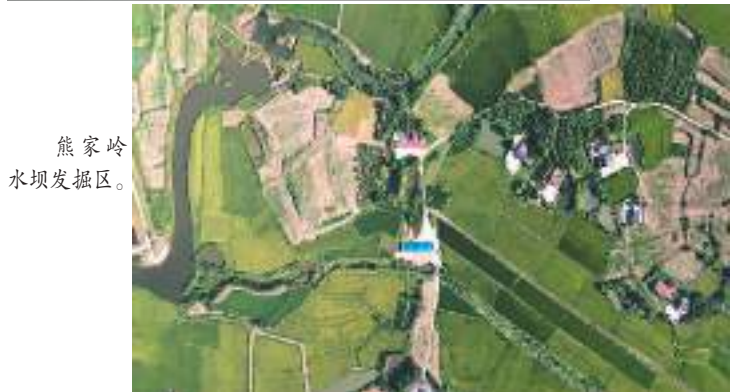
熊家岭水坝发掘区。