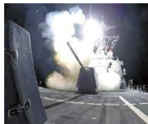
美軍軍艦發射導彈，襲擊也門胡塞武裝據點。

美軍早前空襲伊拉克及敘利亞境內、與伊朗革命衛隊有關的軍事組織目標，報復美軍駐約旦基地1月30日遇襲，釀成3名美軍死亡、逾40人傷。伊拉克外交部召見美國駐伊拉克臨時代辦，抗議美軍空襲當地平民及軍事設施。