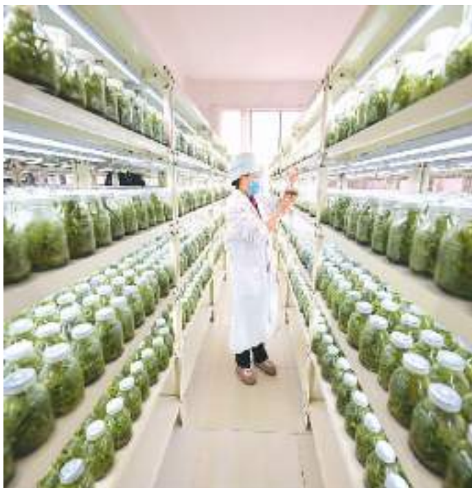
在广西壮族自治区稚长兰科植物繁育实验中心植物组培繁育无菌操作车间，工作人员在观察兰花组培苗生长情况。

拉美社报道称，技术创新正在书写中国生物产业的新篇章。作为全球第二大医疗保健市场，中国高度重视医疗保健生物技术和生物制药行业的发展，近年来在抗体药物市场上成绩卓越。除了医药领域外，生物技术也在重新定义农业生产新格局。比如中国和古巴组建的合资公司致力于开发生物肥料、生物农药等产品。这一合作促进行业内部协同创新，提高市场竞争力。