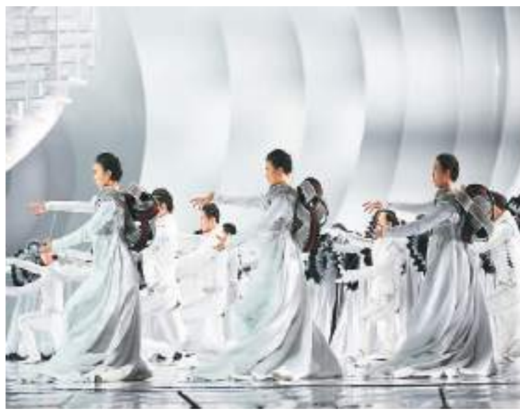
本文配图：歌剧《罗密欧与朱丽叶》舞台照。