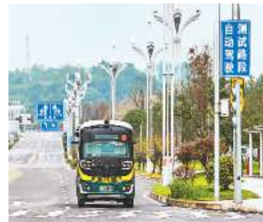
重庆高新区西部科学城，自动驾驶巴士行驶在自动驾驶测试路段。