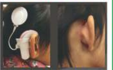
图二：术后三个月照片

多的医院。陈锦国医师表示，人工耳蜗手术的朋友从出生几个月到85岁的成人都有，术后听语恢复的成效良好，100%成功植入的双镜人工耳蜗手术在国际医学会上受到重视，期待这项技术可以造福更多人，让听障不再是人们沟通的障碍。