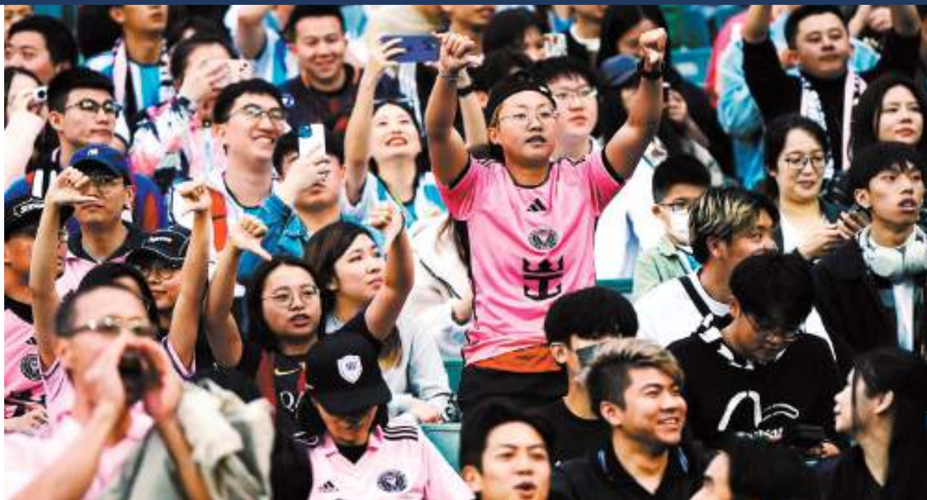
◆球迷對美斯無落場比賽發出噓聲表示極度失望。

萬眾期待的国际邁亞密對香港隊表演賽4日於香港大球場上演，是次有球王美斯作為號召力的賽事，吸引逾3.8萬名市民與旅客入場觀賽，現場幾近座無虛席，亦足證香港這個盛事之都的魅力。不過，大眾引頸以待的球王美斯和另一名球星蘇亞雷斯，最終卻齊齊未有落場，令萬千球迷極度失望、敗興而回。香港特區政府4日晚發出聲明表示，美斯未能上陣，亦未應要求在場內親自向球迷說明原因，政府和一眾球迷感到極度失望；大型體育活動事務委員會會根據協議條款與主辦單位跟進，包括可能因此扣減贊助款項。