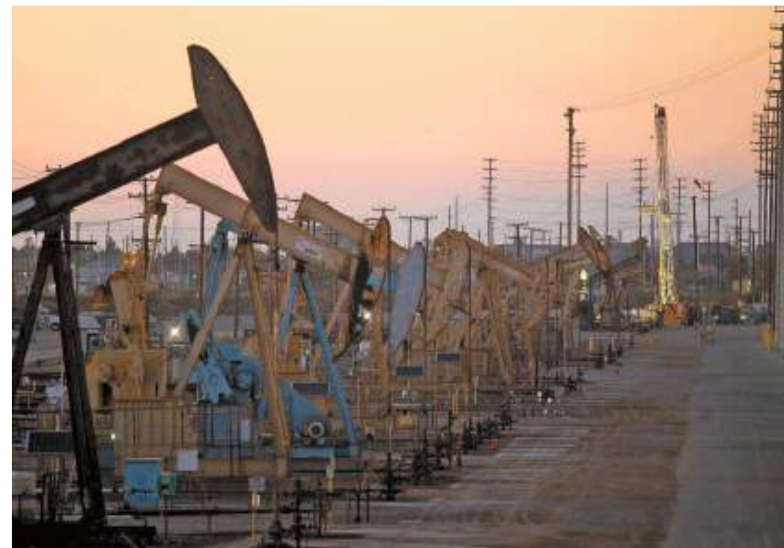
紅海襲擊令運輸成本飆升，從而影響油價，導致煉油廠盡可能選擇在當地進行生產。

【香港商報訊】據《歐亞時報》報道，隨着也門武裝分子在紅海頻繁發起襲擊以及運費飆升，全球石油市場變得越來越「本地化」，消費國更傾向於從距離更近的國家獲得供應。通過蘇伊士運河的油輪運輸量下滑，導致亞歐大陸油市分裂成兩個地區：一個以大西洋盆地為中心，包括北海和地中海，另一個則包括波斯灣、印度洋和東亞。這兩個地區之間仍然在通過繞非洲南端的更長且成本更高的航線進行原油運輸，但最近的石油採購模式表明，兩者之間正在脫鉤。