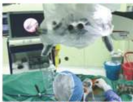
图一：双镜人工耳蜗手术，耳部小孔洞精准植入人工耳蜗电极。