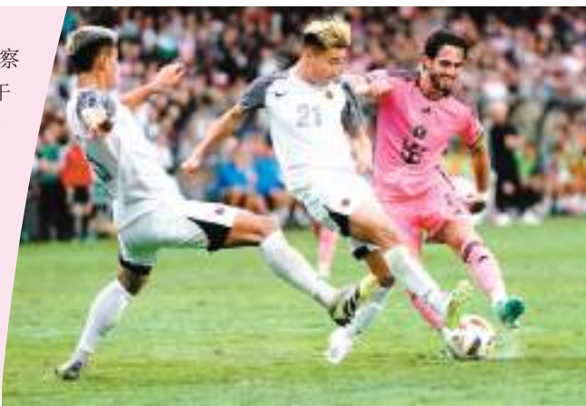
◆球員落力作賽。

聲明說，不少香港球迷熱切期待，更有許多遊客專程來港觀賞，美斯未能上陣表演賽，亦未應要求在場內親自向球迷說明原因，政府和一眾球迷感到極度失望。主辦單位及國際邁亞密CF的處理手法未能回應一眾熱烈支持美斯的球迷的期望，尤其是一眾專程遠道而來的旅客。特區政府文化體育及旅遊局和大型體育活動事務委員會會根據協議條款要求主辦單位負責，包括可能因應美斯未能出場而扣減贊助款項。