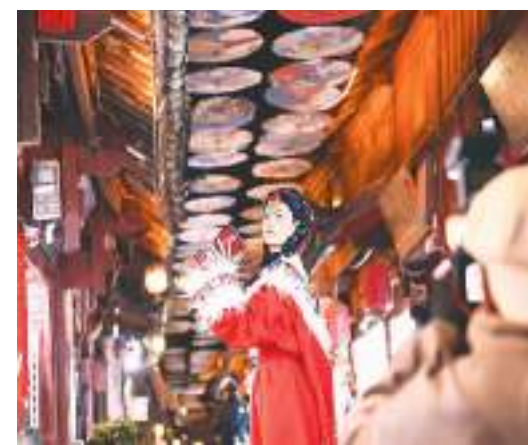
1月7日，游人在云南丽江古城拍照游玩。