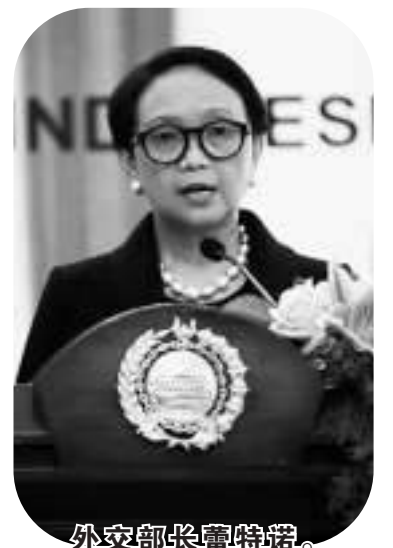
外交部外长蕾特诺。

月2日会见佐科维总统后,有关有些部长请辞的传言也愈传愈烈。总统府驳斥了有关总统与穆丽亚妮的会晤,与其将退出印度尼西亚前进内阁的传闻相关。