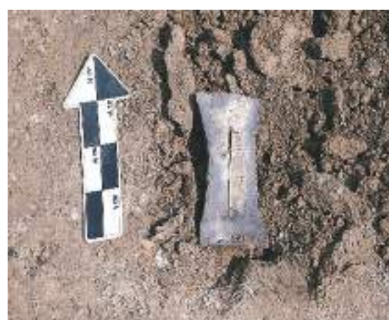
辽上京城南部建筑遗址出土的银钹。