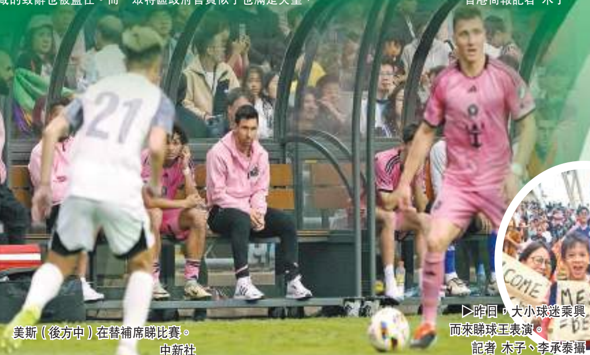
美斯（後方中）在替補席睇比賽。

下半場，港隊大面積輪換，僅李毅凱繼續作戰。惟球迷期待的美斯仍穿着長運動褲返回球場，也未穿上比賽用的球鞋，繼續端坐後備席觀看比賽。面對默契不足的港隊，國際邁阿密在50分鐘再度取得領先，今場表現活躍的辛特蘭接應傳中射入，2比1。6分鐘後，李安納度甘賓拿禁區內左腳射地波慢流尾袋，客隊領先至3比1。等見球星等到頸都長埋的球場球迷，去到26分鐘終於見到佐迪艾巴及布斯基斯上陣，不過蘇亞雷斯仍只在場邊做着熱身；美斯則紋絲未動。完場前，後備門將謝家榮連環撲出客隊攻門；功成身退的他由龐煥熙入替，想不到這位晉峰門將還未觸球，就被賴恩西拿接應左路角球迎頂中柱彈入，客隊鎖定4比1勝局完場。