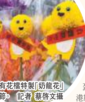
有花檔特製「奶龍花」應節。記者 蔡啟文攝

昨早雖然下着毛毛細雨，但早上10時開始，已有市民急不及待來到維園買年花。專營桃花的屯門新發花園在維園擺檔已約40年歷史，負責人魏女士說：「今年桃花價格與往年相若，但講價的市民卻多了，一般有5%講價空間。和以往一樣，最好賣的是200元至480元不等的小型桃花，一個早上已經售出60棵，隨着下午人流大增，預期今年生意大增。」