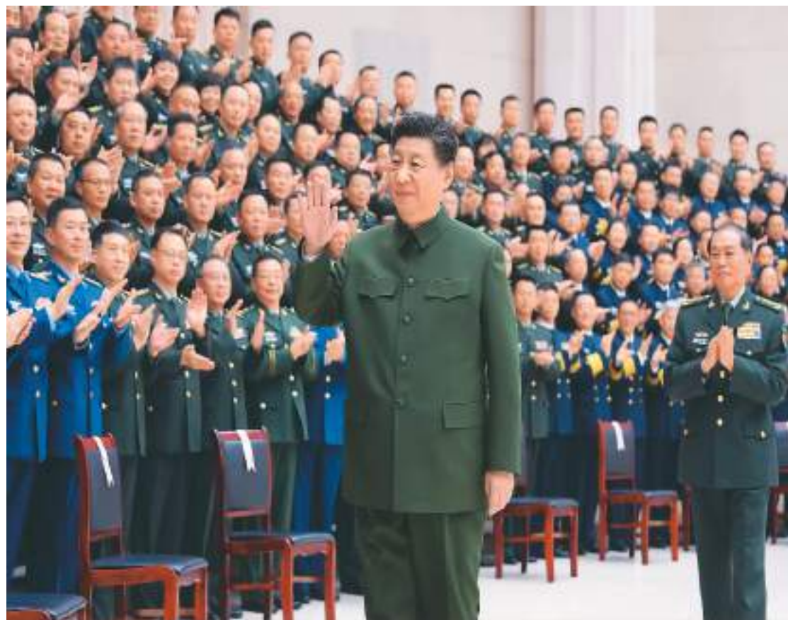
2月2日,中华民族传统节日春节即将来临之际,中共中央总书记、国家主席、中央军委主席习近平视察慰问驻天津部队,代表党中央和中央军委,向全体人民解放军指战员、武警部队官兵、军队文职人员、民兵预备役人员致以诚挚问候和新春祝福。这是习近平亲切接见驻天津部队官兵代表。

■过去的一年,驻天津部队坚决执行党中央和中央军委决策部署,各项工作扎实推进,重大任务完成出色,特别是有力支援天津防汛抗洪抢险,为保障人民群众生命财产安全作出了重要贡献 ■新的一年,要深入贯彻新时代强军思想,深入贯彻新时代军事战略方针,扭住打好实现建军一百年奋斗目标攻坚战,强化使命担当,狠抓工作落实,努力开创部队建设新局面,坚决完成党和人民赋予的各项任务 ■春节就要到了,全军区队要加强战备值班,维护好国家和社会稳定,确保全国人民过一个欢乐、祥和、安全的新春佳节。要搞好工作统筹,把官兵节日期间的生活安排好