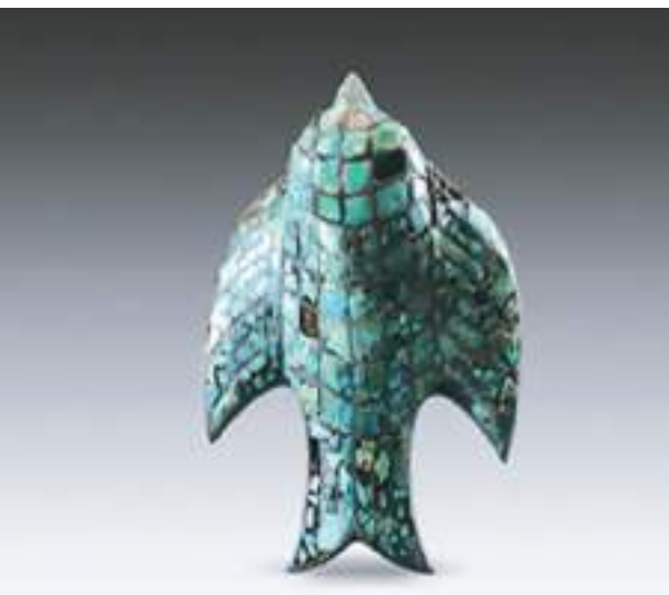
寨沟商代遗址出土的绿松石铜燕。

地处大洪山南麓向江汉平原的过渡地带，是以屈家岭为核心，包括殷家岭、钟家岭、冢子坝和杨湾等10余处地点为一体的新石器时代大型遗址。