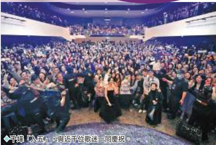
◆千嬅「入五」，與近千位歌迷一同慶祝。