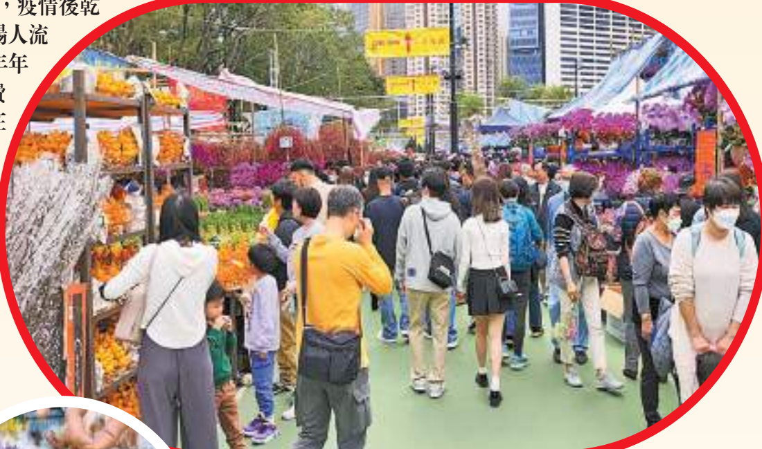
15個年宵市場昨起舉行，昨天維園年宵市場人流開始大增。

【香港商報訊】記者李銘欣、實習記者邱之麟報導：食環署轄下15個年宵市場昨日起一連七天舉行，疫情後乾貨及快餐攤位今年復辦。其中維園年宵市場人流至下午已經水洩不通，有花檔老闆稱，今年年花價格與去年相若，入場市民普遍預算消費1000至3000元。有熟食檔主事隔四年再在維園投標，有信心今年能賺大錢；約10間中學開辦乾貨檔，有信心可賺到三至四成利潤；多位檔主均料今年生意有增長。