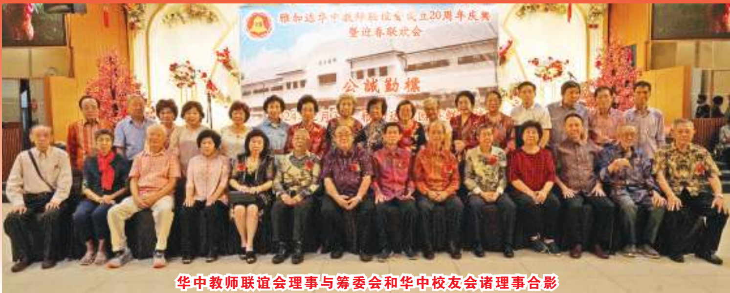
华中教师联谊会理事与筹委会和华中校友会诸理事合影