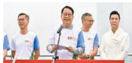
陳國基(左二)在「廉政公署50周年傳誠跑」致辭。

【香港商報訊】記者區海報道：廉政公署昨日舉行「廉政公署50周年傳誠跑」，慶祝廉署成立50年。政務司司長陳國基表示，香港在消除貪污全球排名第九，相信「一國兩制」下香港「背靠祖國、聯通世界」大有可為，廉署半世紀的豐富經驗能肅貪倡廉，為「一國兩制」實踐行穩致遠貢獻力量。