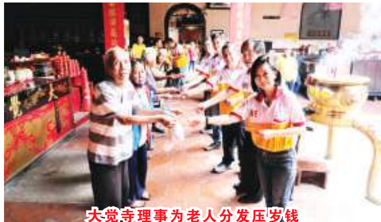
大觉寺理事为老人分发压岁钱