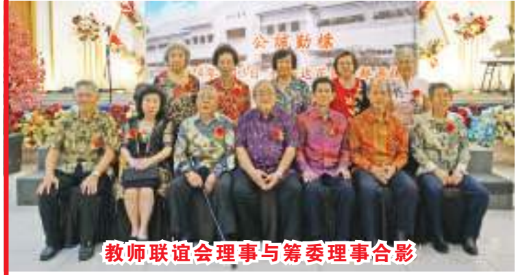
教师联谊会理事与筹委理事合影