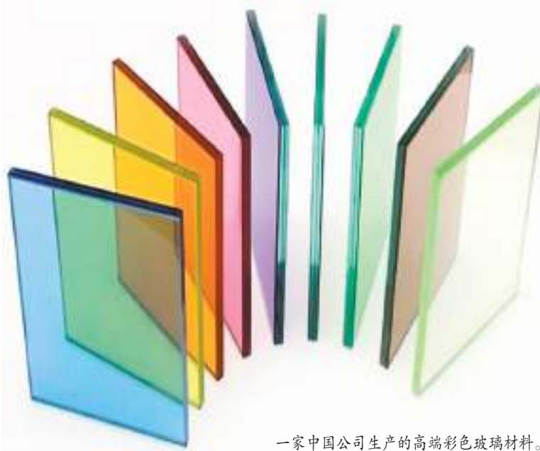
一家中国公司生产的高端彩色玻璃材料。

介”，新型显示是玻璃功能化应用的先行和主导领域。从液晶显示、OLED(有机发光二极管)柔性显示到Mini/Micro-LED(微米量级发光二极管)显示，每次显示技术的更新迭代都离不开玻璃的创新支撑。如在两片薄膜晶体管TFT-LCD(液晶显示器)玻璃基板中间填充液晶分子，结合驱动电路和透明电极，便构成了液晶显示的核心器件——液晶显示屏。当玻璃薄到70微米以下，在保证韧性和强度的同时，可以实现屏幕的折叠，带动显示新业态柔性可折叠手机