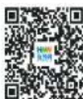
扫码阅读意见全文

含的发展理念、工作方法和推进机制,把推进乡村全面振兴作为新时代新征程“三农”工作的总抓手,坚持以人民为中心的发展思想,完整、准确、全面贯彻新发展理念,因地制宜、分类施策,循序渐进、久久为功,集中力量抓好办成一批群众可感可及的实事,不断取得实质性进展、阶段性成果。