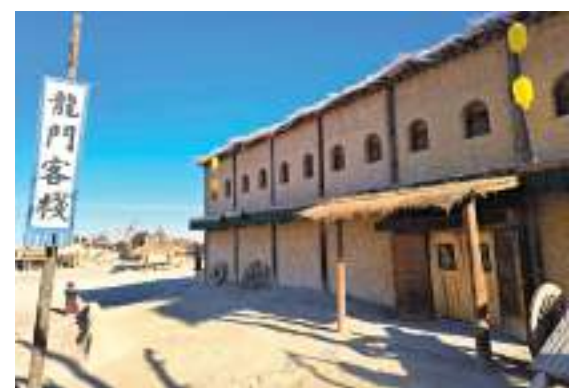
◆ 因電影《新龍門客棧》被影迷熟識的外景地。