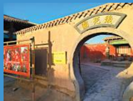
▲ 電影《大話西遊》外景地之後花園。