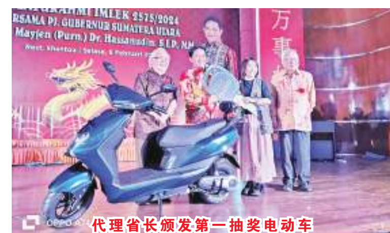
代理省长颁发第一抽奖电动车