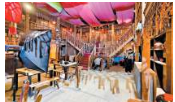
◆ 電影《新龍門客棧》取景地內景。