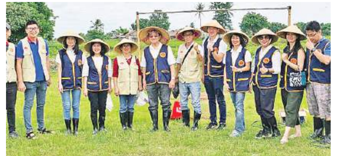
印尼客联总会和印尼梅州会馆为博朗村农民提供粮食安全援助