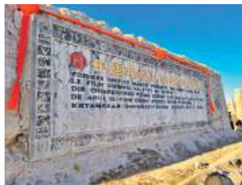
◆ 中國電影從寧夏鎮北堡西部影城走向世界。

寧夏鎮北堡西部影城也被譽為香港新派武俠的起點。而很多人來鎮北堡的理由之一，可能是因為《新龍門客棧》。