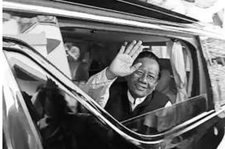
第三序号副总统候选人马福。

【本报讯】2月16日,三名副总统候选人马福在多家民调机构公布了2024年总统大选的快速计票结果后,终于公开发表对此的看法。马福通过其X账户@mohmahfudmd表示,大选已经结束,现在所有政党都在等待普选委宣布最终结果。马福在其帖子中写道,我们必须时刻毫无厌倦地热爱祖国。我们必须继续为建立民主和正义而斗争,孜孜不倦地为