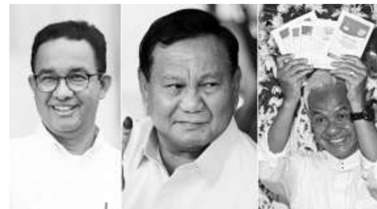
左起:阿尼斯、普拉波沃、阿尼斯。

人都举手,一轮能行吗?一号正副总统总统候选人阿尼斯-穆海敏就与众不同。由民族民主党、公正福利党和民族复兴党支持的这对总统候选人则希望选举将分两轮进行。尽管有些人提出一轮选举的呼声,但是实际上,必须满足一些条件,以便一对总统候选人能够在第一轮选举中获胜。其计算方法并不仅获得超过50%的选票那么简单。