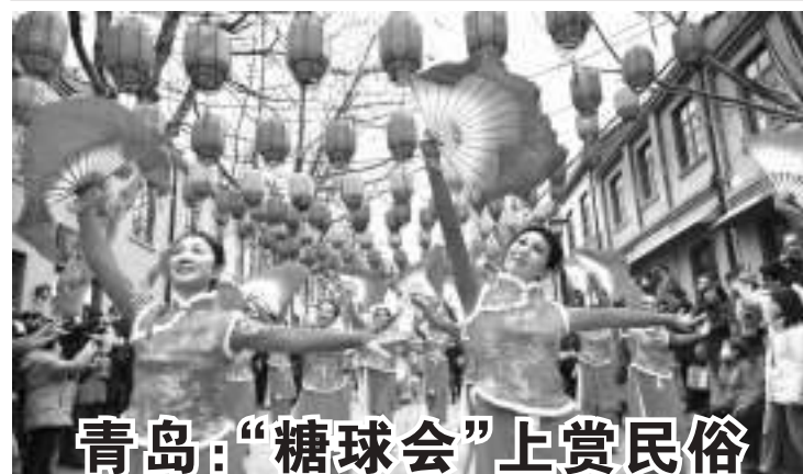
青岛:“糖球会”上赏民俗

通过政府声明的方式对备忘录予以认可。中国的核政策是有核中最明确、最先进的,包括不首先使用核武器,不对任何无核国家使用核武器,当然包括乌克兰在内。乌克兰危机发生后,习近平主席进一步指出,核武器用不得、核战争打不得,各方应共同维护核材料和核设施安全。中方履行了做出的承诺和承担的国际义务。 王毅强调,中国不是乌克兰危机的制造者,也不是当事方。但我们没有隔岸观火,更没有借机牟利。习近平主席指出,各国的主权和领土完整应该得到尊重,联合国宪章的宗旨和原则应该得到遵守,各国的合理安全关切