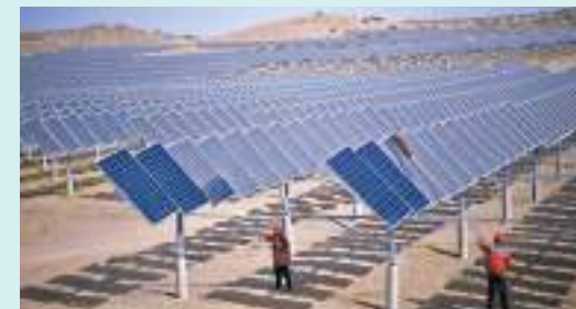
◆中國大規模推廣可再生能源的步伐正在加速。

分析人士認為，中國將繼續快速推廣可再生能源，預計每年繼續新增200至300吉瓦的風力和太陽能發電裝機容量。可再生能源投資已成為中國經濟的主要推動力，去年中國的清潔能源支出總額增長40%，達到8,900億美元。