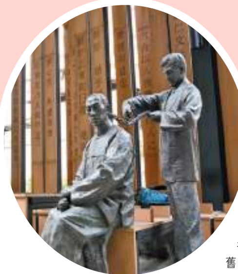
輔仁文社舊址。

正是在香港這個充滿神奇特質的地方，孫中山和他的革命同志完成了思想的啟蒙、組織的建構以及力量的準備，爲了一個更加美好的中國而努力。香港在中國歷史上所發揮的這一作用，不應該被忽視，也不能夠被磨滅。中山史跡徑之所以重要，就是因爲這一座建築承載的不僅是孫中山個人的生平，更是那一代中國人在香港進行救國事業的寫照。這一切，值得我們後人銘記。