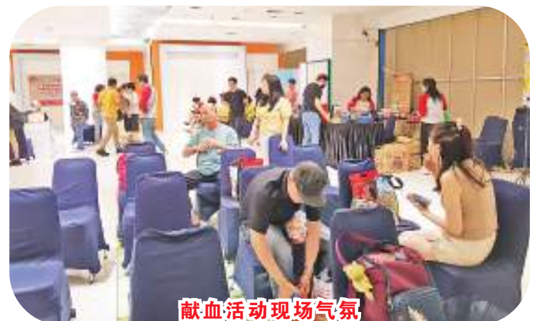
献血活动现场气氛