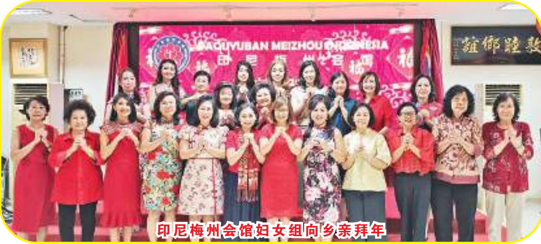
印尼梅州会馆妇女组向乡亲拜年