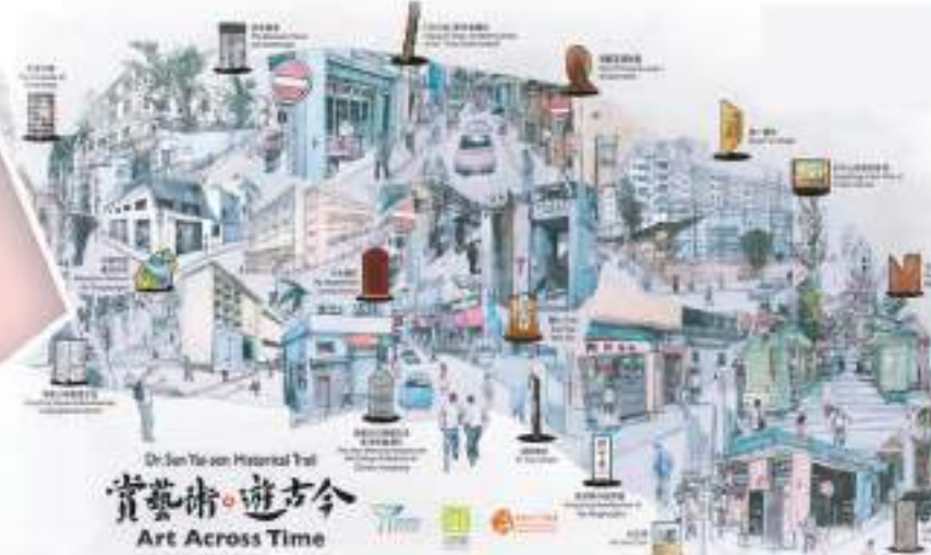
香港孫中山史跡徑遊覽圖。

今日香港大學的醫學院，就是孫中山當年學醫的大學之前身。可見孫中山允文允武，不僅以手術刀救人，也以革命的思想救人。