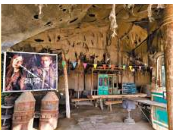
▲ 電影《刺陵》外部取景地。