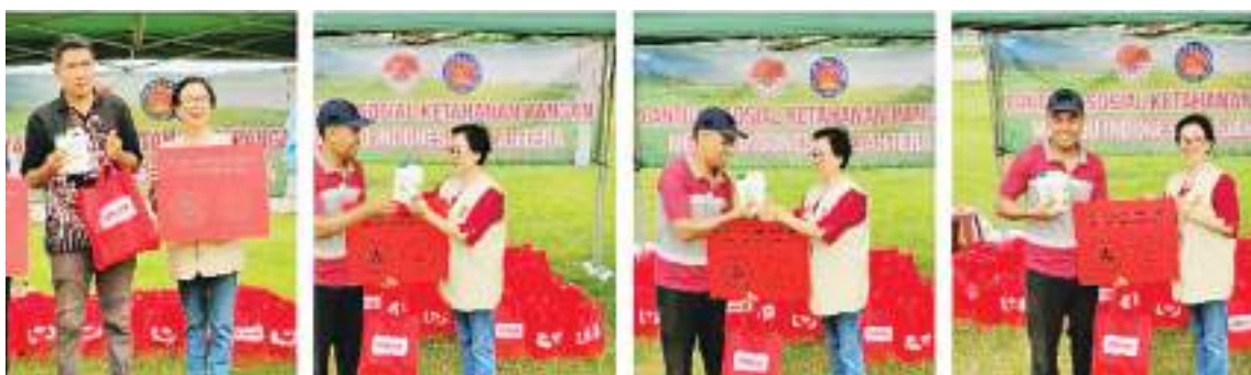
提供糧食化肥援助

【本报讯】为切实支持印尼的粮食安全和社区福利，印尼客联总会和印尼梅州会馆共同为博朗村提供援助。这项合作倡议由印尼客联总会和印尼梅州会馆社会福利部共同牵头，旨在改善农民的福利，同时提供援助，可以对已经成功向其他农民提供进一步援助的农民产生滚雪球效应。发放活动中，青年部提前两个月在Kampung Bolang博朗村进行了调查。通过与当地居民(包