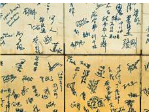
▲ 寧夏鎮北堡西部影城的影視明星簽名台。