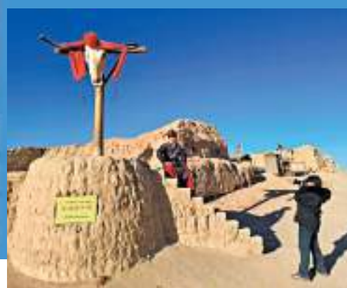
◆ 電影《大話西遊》外景地之唐僧受刑台。