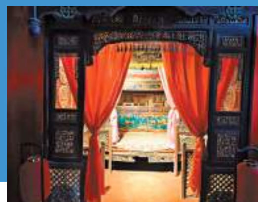
◆ 電影《大話西遊》取景地之婚床。