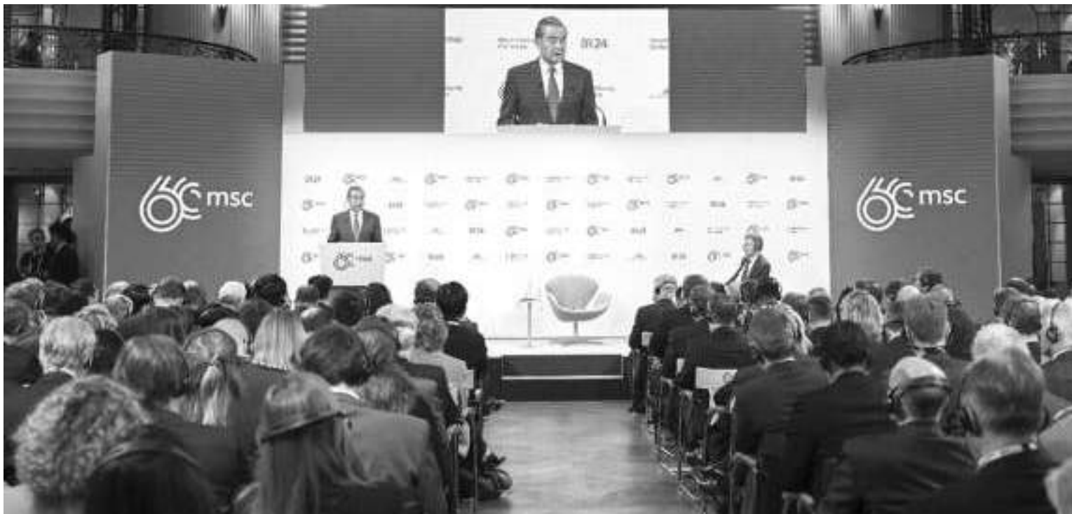
当地时间2月17日,中共中央政治局委员、外交部长王毅出席慕尼黑安全会议,在“中国专场”发表题为《坚定做动荡世界中的稳定力量》的主旨讲话。