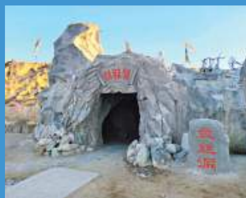
▲ 電影《大話西遊》盤絲洞外景。