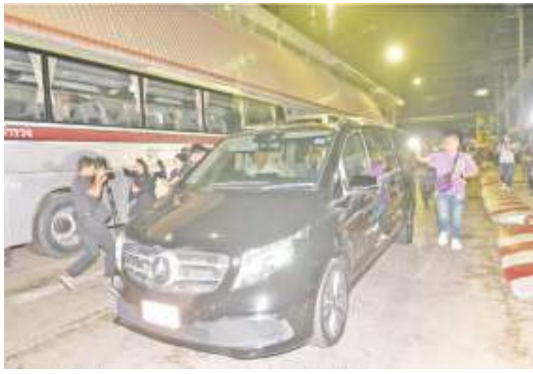
2月18日清晨,在泰国曼谷的泰国警察医院,在此治疗和服刑的他信乘车离开。

2月13日,泰国司法部长塔威说,本月共有930名服刑人员获得假释批准,他信是其中之一。批准他信获假释的理由是他已年过70岁、患有严重疾病且服刑时间超过6个月。泰国总理赛塔也公开表示,他信是按照相关法律法规获得假释。