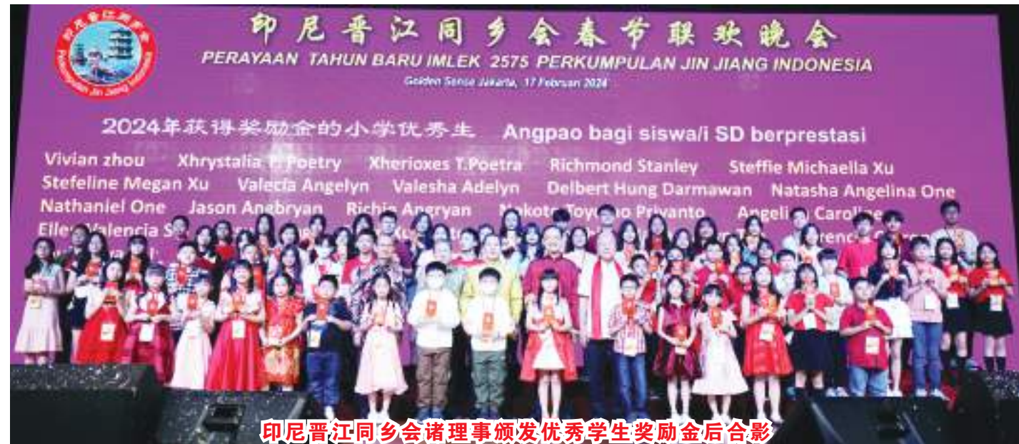
印尼晋江同乡会诸理事颁发优秀学生奖励金后合影