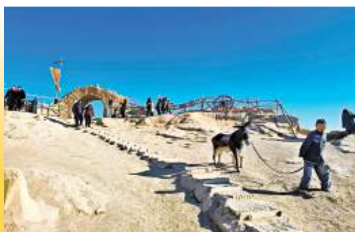
▲ 《紅高粱》外景地月亮門。