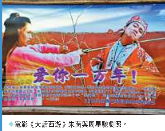
◆ 電影《大話西遊》朱茵與周星馳劇照。

多年前，周星馳與朱茵主演的《大話西遊》曾感動無數人。人們都還記得至尊寶站在城樓上與紫霞的擁吻，也記得那句：「愛你這件小事，十年太少，一萬年太假；我只希望是與你在一起的每一個朝夕。」而這部電影的取景地，是由著名作家張賢亮創辦的寧夏鎮北堡西部影城。影城建在「塞上江南」寧夏的兩座黃沙漫天的古堡遺址上，是中國十大影視基地之一。它的主要景點有明城、清城、老銀川一條街等，《新龍門客棧》、《錦衣衛》等香港經典電影也在此取過景。這裏還有着獨特的蒼涼、粗獷、悲壯……在許多影迷心中，這裏早已超越了「東方好萊塢」香港。影城也因此被評為「中國最受歡迎旅遊目的地」。