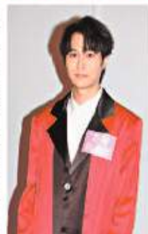
胡鴻鈞承諾今後不再犯。

香港文匯報訊(記者 達里)日前因非法攜帶數盒加熱煙彈過關的胡鴻鈞，17日首度出席公開場合回應事件，他對於自己所做的錯事，鄭重地向所有人講聲對不起，令到每位支持他的人都失望，承諾今後不會再犯任何錯誤，而現場也有數十位粉絲手持標語來支持他，並高呼「胡鴻鈞、胡鴻鈞，我們永遠支持你。」