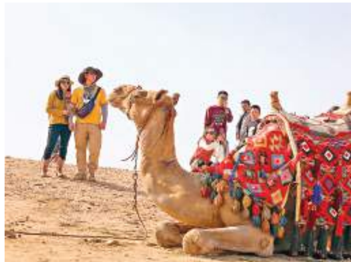
中國遊客參觀埃及吉薩金字塔景區。