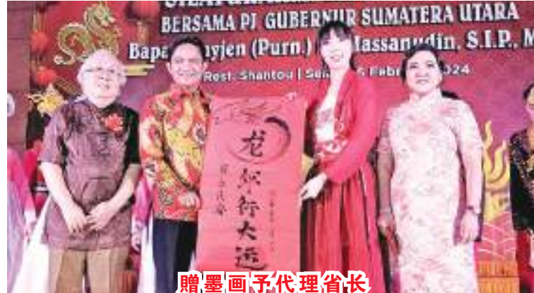
赠墨画予代理省长