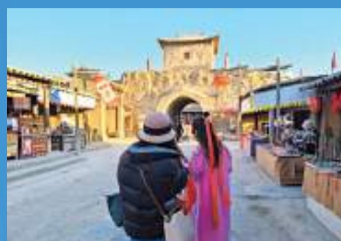
▲ 身穿古裝的遊客在《大話西遊》外景拍攝地打卡。