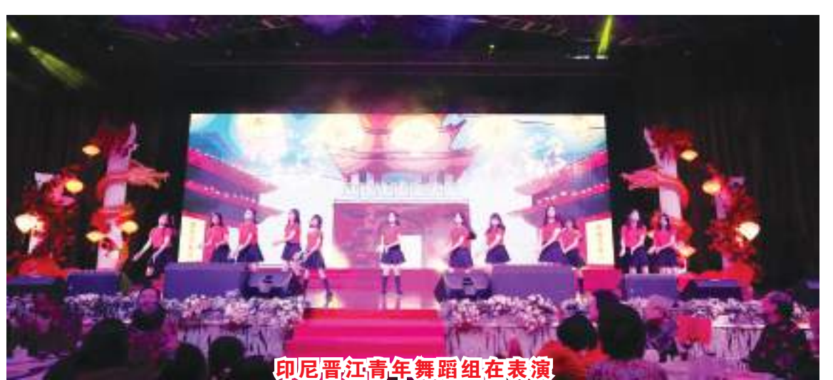
印尼晋江青年舞蹈组在表演