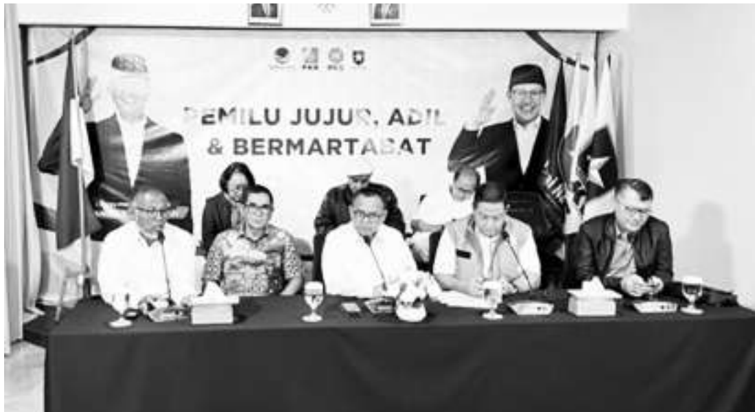
阿尼斯-穆海敏胜选团队要将选举舞弊数据通过宪法法院提出诉讼。

【本报讯】第一序号正副总统候选人阿尼斯-穆海敏国家获胜团队认为,普选委的统计系统中的数据出现的违规行为,是2024年总统选举舞弊的证据。阿尼斯-穆海敏国家获胜团队表示,如果向宪法法院提出诉讼会将提供这些证据。