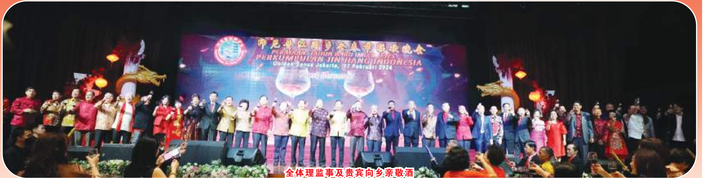
全体理事及贵宾向乡亲敬酒

【本报讯】2024年农历正月初八(2月17日星期六)18时,印尼晋江同乡会周在雅加达金沙大酒楼,举行新春联欢晚