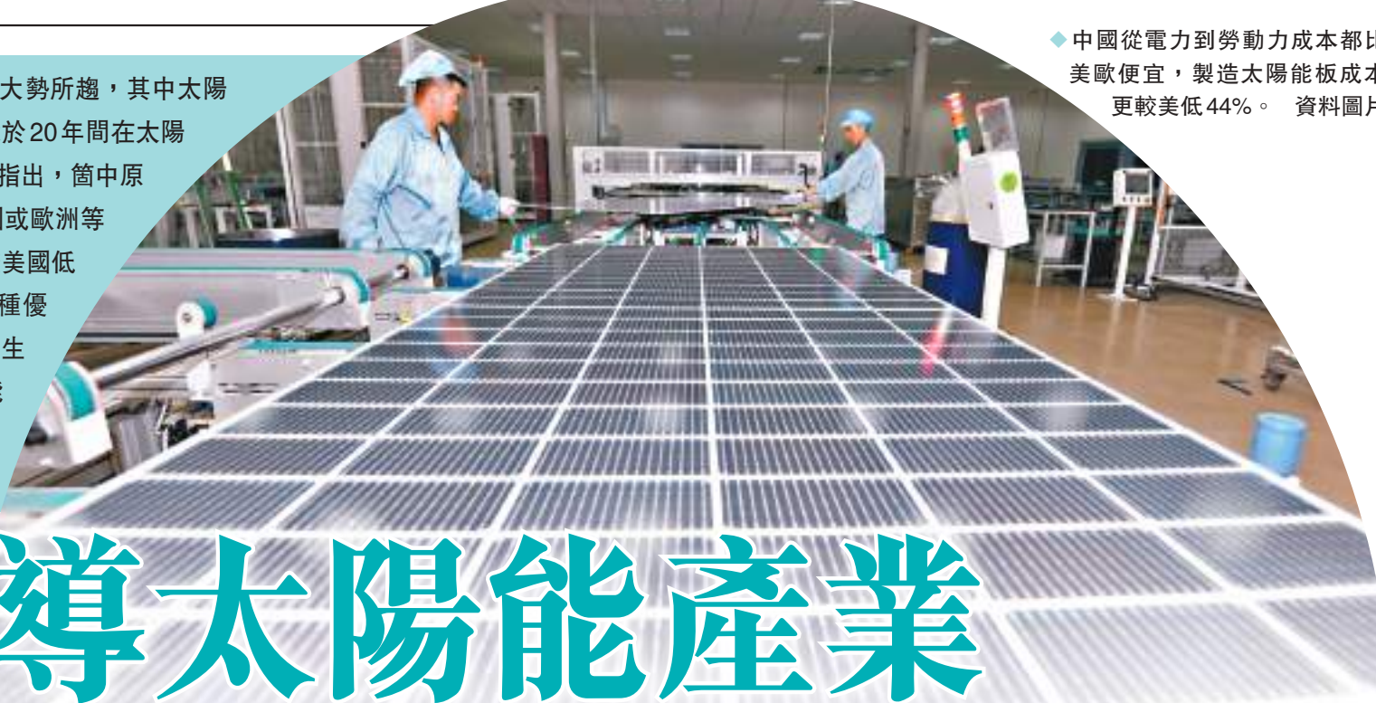
◆中國從電力到勞動力成本都比美歐便宜，製造太陽能板成本更較美低44%。資料圖片

香港文匯報訊 推動使用環保能源已是全球大勢所趨，其中太陽能板的製造過程本來漫長而複雜，但中國卻能於20年間在太陽能板產業建立主導地位。美國《華爾街日報》指出，箇中原因包括中國從電力到勞動力的成本，都比美國或歐洲等地便宜得多，估計中國製造太陽能板的成本較美國低44%。中國太陽能製造業規模龐大已成為一種優勢，吸引人才、研究資金和供應商。隨著可再生能源需求激增，美國正試圖建立自己的太陽能製造供應鏈，並提供巨大補貼作支持，但要挑戰中國的主導地位是困難重重。