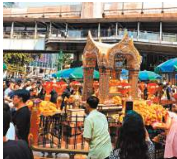
中國遊客在泰國曼谷網紅景點四面佛打卡。