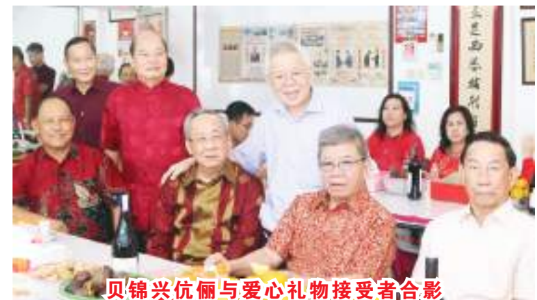
贝锦兴伉俪与爱心礼物接受者合影