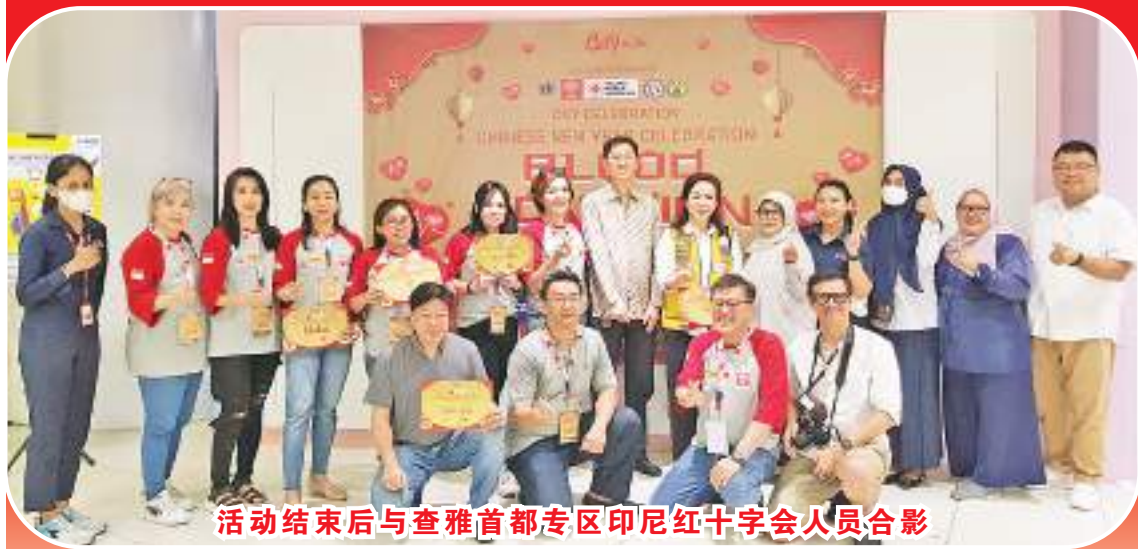
活动结束后与查雅首都专区印尼红十字会人员合影