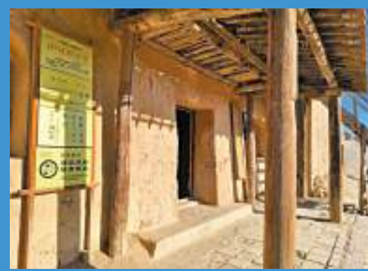
▲ 電影《大話西遊》外景地之蜘蛛精澡堂。