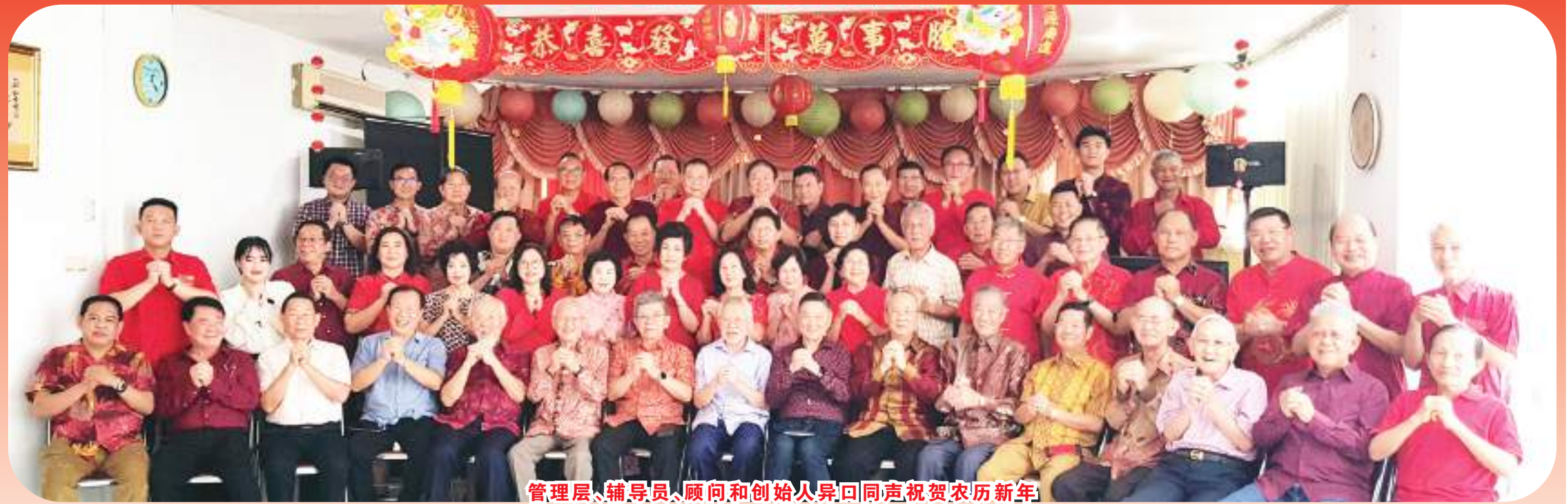
管理层、辅导员、顾问和创始人异口同声祝贺农历新年

【本报讯】赤道基金会领导层和管理层于周日(18/02/2024)下午在雅加达北区 Kompleks Nirwana Asri, J2 座门牌 19 号基金会秘书处办事处举行 2024 年农历新年聚会活动。