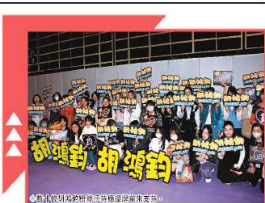
數十位胡鴻鈞粉絲手持標語前來支持。