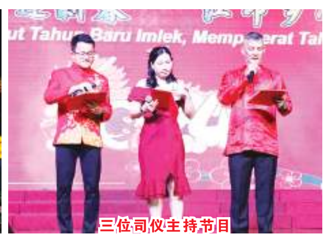
三位司仪主持节目