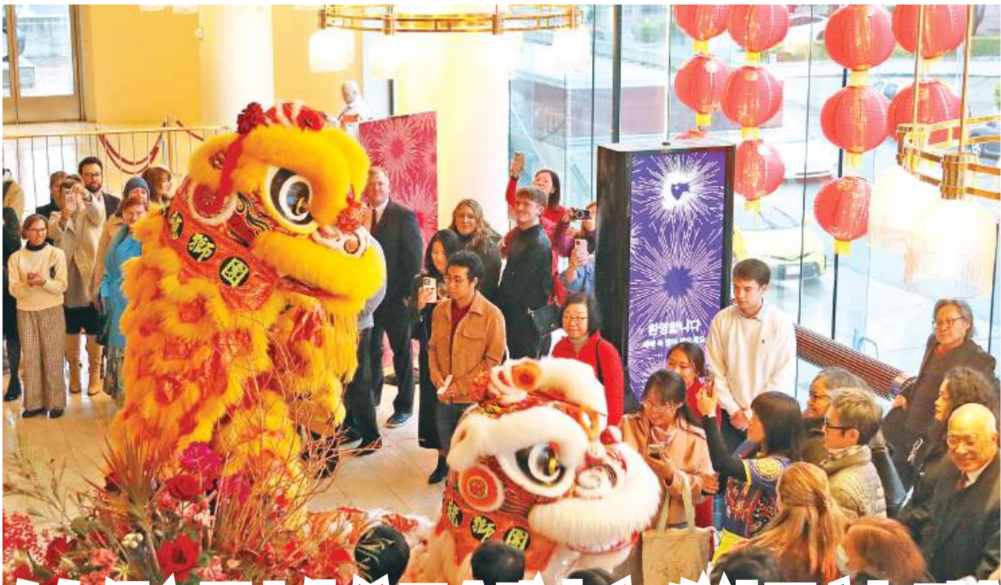
美国旧金山举行中国农历新年音乐会 2月17日,观众在美国旧金山戴维斯音乐厅观看舞狮表演。 当日,美国旧金山交响乐团举行中国农历新年音乐会,庆祝龙年来到。