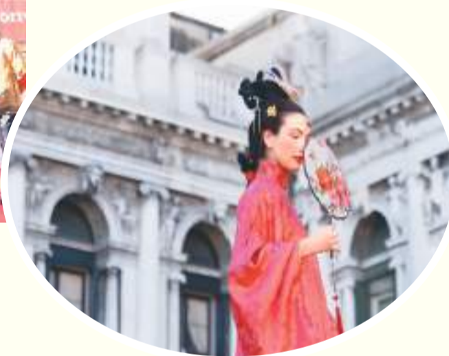
▲ 志愿者们身着各式各样的汉服，在活动现场合影留念。

近日，一场汉服巡游活动在意大利威尼斯圣马可广场上演。22名从意大利选拔的志愿者，身着由中国苏州丝绸博物馆提供的汉服，向威尼斯市民和世界各地游客展示东方美学。