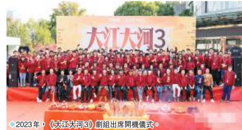
◆2023年，《大江大河3》劇組出席開機儀式。