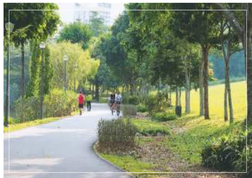
新加坡榜鹅一条公园连道上，民众骑自行车出行。