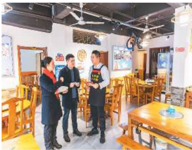
在重庆市云阳县青龙街道,中国建设银行云阳支行普惠信贷员来到辖区一家餐馆,为商户(右)介绍普惠金融政策。

年四季度末,保险业综合偿付能力充足率为197.1%,核心偿付能力充足率为128.2%,均高于100%和50%的达标标准。其中,财产险公司、人身险公司、再保险公司的综合偿付能力充足率分别为238.2%、186.7%、285.3%;核心偿付能力充足率分别为206.2%、110.5%、245.6%。