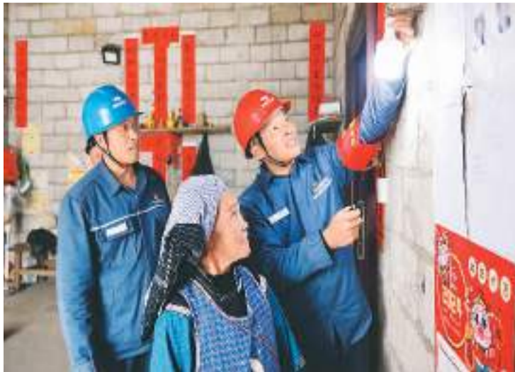
近日,南方电网贵州兴义供电局组织党员服务队到贞丰县沙坪镇开展安全用电巡检工作,为村民发放安全用电宣传资料及节能灯等,确保群众节日期间用电安全稳定。