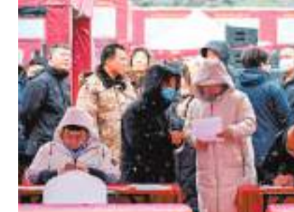
◆求職者在尋找適合的崗位。

除夕夜，神舟十七號乘組的年夜飯菜單揭曉，包含水餃、年糕、糯米八寶飯、醬鹿肉、熏魚、馬蹄豆腐等各式菜品。航天員們一邊享用年夜飯，一邊守在屏幕前觀看春節聯歡晚會。神舟十七號乘組還作為「表演嘉賓」，以視頻形式現身春晚，參與獻唱《看動畫片的我們長大了》。