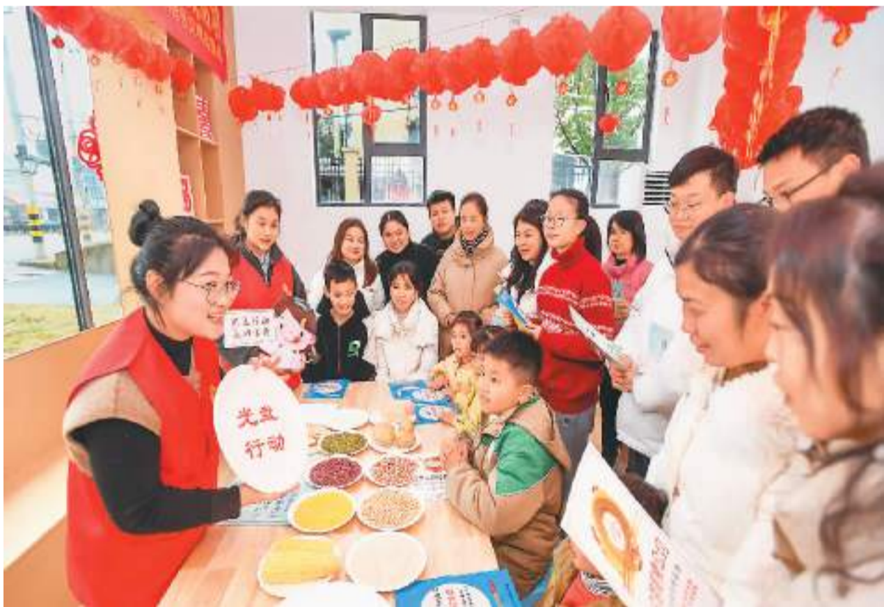
近年来,江西省宜春市丰城县通过“光盘行动”宣传进校园、进社区、进乡村、进酒店等活动,增强广大群众珍惜粮食的意识,让节约粮食、拒绝餐饮浪费成为新风尚。图为2月23日,该县城东社区的志愿者向居民宣传国家反食品浪费法和拒绝餐饮浪费行为等相关知识。