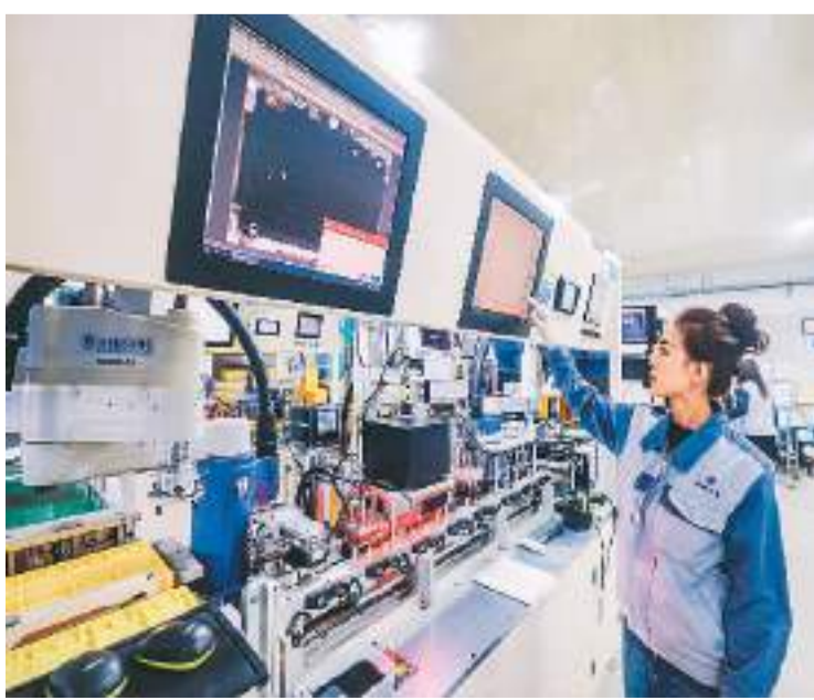
2月23日,在山东省荣成市港西镇一家外资电子制造企业的生产车间内,一名工人在操作智能电子设备进行作业。

商务部表示,2024年将继续发挥好外资企业圆桌会议制度作用,加强央地协同与部门联动,每个月召开一场圆桌会议。