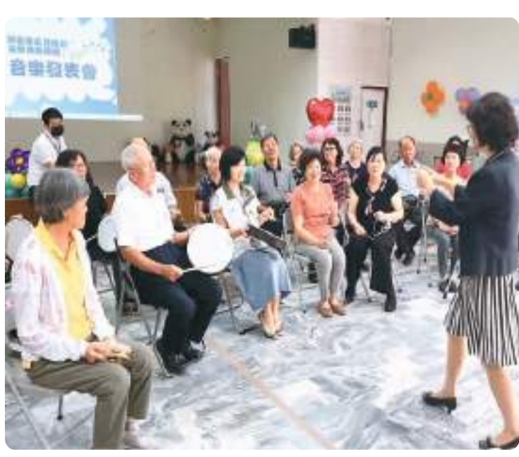
▲在台南进行的一场音乐辅疗课程。

“课程分为两部分,一是让学生教老年人一种音乐行为,如唱歌、舞蹈、打鼓;二是请老人教年轻人,可以是本地历史、非遗制作,或讲故事。”他说,互学效果好过单向学习。