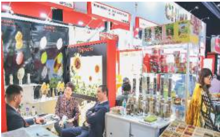
第二十九届海湾食品展上，中国企业展台吸引不少国际客商前来洽谈。