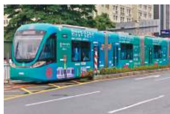
◆龍華有軌電車可以用數字人民幣支付。