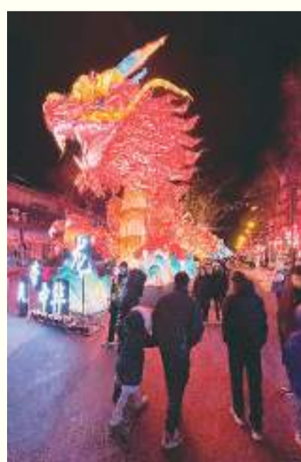
▲山西省高平市举办的第二届炎帝灯会吸引市民前来观赏。