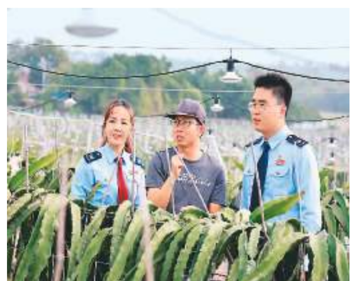
国家税务总局北海市海城区税务局深入开展便民办税春风行动,聚焦涉农企业发展,在落实落细优惠政策、优化便民服务举措上持续发力,助力产业向好发展。图为广西北海市税务干部到涠洲岛一采摘园开展个性化涉税服务。

据了解,自2011年5月中国五矿集团公司与青海省祁连县签订对口支援协议以来,中国五矿已累计向祁连县落实资金4600万元,实施各类援建项目26项。