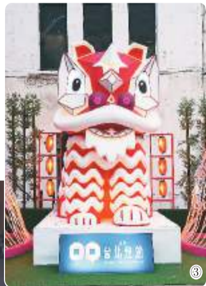
图①:民众参观十二生肖主题彩灯区。 图②:民众在西二门红楼光廊中拍照留念。 图③:造型可爱的“光年兽”灯组。 图④:民众观赏上海彩灯。