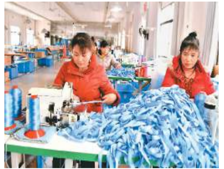
近年来,许多企业加大科研投入,不断开发新产品,产品远销国际市场。图为湖北省咸宁市通城县经济开发区一企业内,员工在赶制彩虹棉系列清涤出口产品。