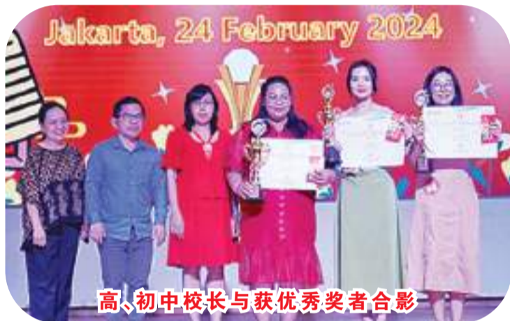
高、初中校长与获优秀奖者合影