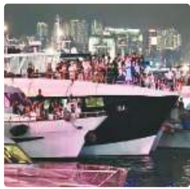
▲歌迷搭乘游艇在中环海滨观看演唱会。

据统计,2023年以来,平均每个月有2位知名歌手在香港举办大型演唱会,且大多举办两场甚至更多场次,场均吸引观众超过1万人。香港红磡体育馆(红馆)近一年来的使用率接近100%,亚洲国际博览馆、中环海滨活动空间等场地也承接了多场大型演唱会,每场观众人数由1万至2万不等,足见香港演唱会市场的火热程度。