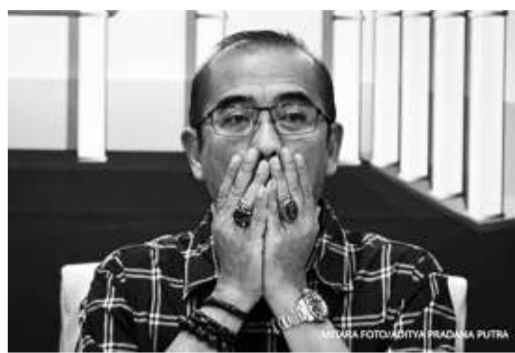
普选委员会主席哈欣。

【本报讯】2月23日，普选委员会主席哈欣表示，绝不会停止在概括信息系统中显示选票数据的透明度，特别是从投票站上传的C表格的原始照片，即投票站记录的选票汇总数据。尽管由于系统的误读，某些数据出现错误识别，但是普选委确保将通过手工操作重新统计选票汇总结果，并进行更正和同步数据阶段验证。关键是对照片，我们将继续上传投票站的C表格的选票汇总结果。不然，没有证人的政党或选民想获得有关投票站的结果，如何获得呢？正是通过概括信息系统，大家可以下载并获得信息，以进行监控。