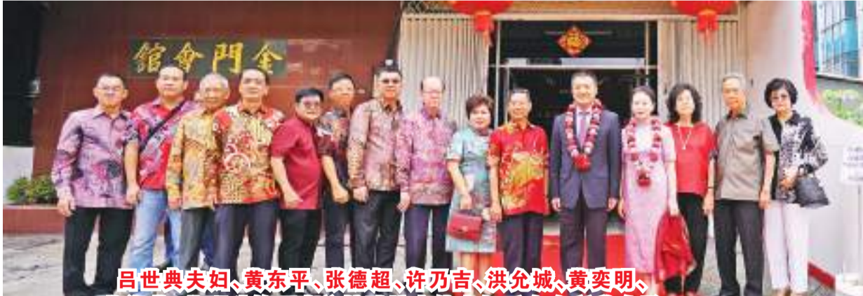
吕世典夫妇、黄东平、张德超、许乃吉、洪允城、黄奕明、黄海燕、黄明珠等理事迎接陆慷大使夫妇后在会所前合影