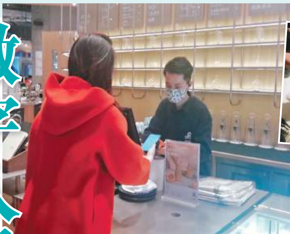
▲數字人民幣支付快捷。