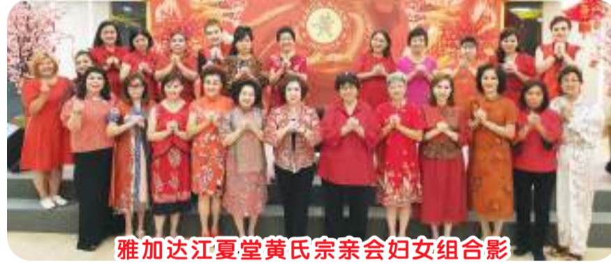
雅加达江夏堂黄氏宗亲会妇女组合影