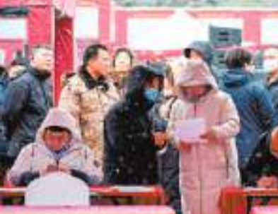
◆求職者在尋找適合的崗位。

年，貴州還採取點對點聯繫省外大中型企業、包列車客車、提供自駕補助等方式，強化農民工就業服務保障，助力外出務工人員返崗就業。