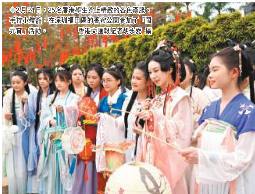
◆2月24日，25名香港學生穿上精緻的各色漢服、手持小燈籠，在深圳福田區的香蜜公園參加了「鬧元宵」活動。