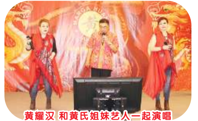
黄耀汉和黄氏姐妹艺人一起演唱