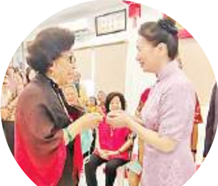
陆慷大使夫人向金门籍长者派发新春红包