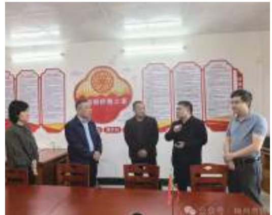
在大柘鎮姚家祠“僑胞之家”調研