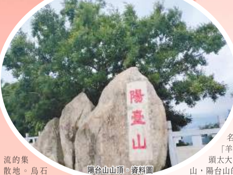
陽台山山頂。資料圖

烏石岩廟的香火不是一般的繁盛，四鄉八鎮的人們都來朝拜，逐漸形成一個商業中心。由於佛寺的公共屬性，寺廟人員流動量極大，明清形成了「因寺立墟」的習慣，「烏石岩墟」便也應運而生，明嘉慶《新安縣志》卷2《輿地略·墟市》記載為「新增」，可見該墟當成立於嘉慶年間（1796-1820）。烏石岩墟地處南頭、龍華、公明交界，連接珠江口和陽台山山區，是漁貨和山貨交