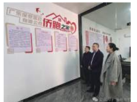
在廣東保靈醫藥有限公司了解“僑胞之家”建設情況