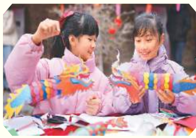
广西壮族自治区桂林市灵川县定江镇宝路村的小朋友在制作花灯。

连日来,神州大地张灯结彩,各地举行舞龙灯、猜灯谜、编灯笼等丰富多彩的节庆活动,人们在喜庆祥和的氛围中,迎接元宵佳节的到来。(相关报道见第八版)