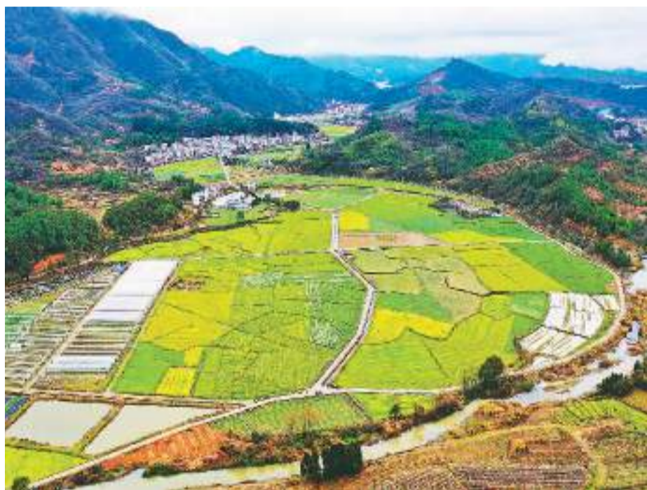
湖南省永州市新田县东升村近年依托良好生态环境,发展优质蔬菜产业和中小研学项目,推动农文旅融合发展,打造乡村旅游特色产业。图为该村盛开的白菜花。