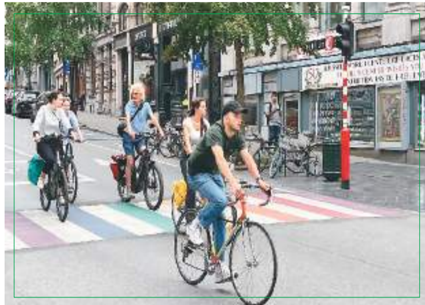
比利时布鲁塞尔，骑行日益成为受民众青睐的出行方式。