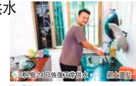
◆三民島24日恢復正常供水。網上圖片

22日8時許，粵海水務安排10台送水車趕到三民島上方南中高速橋面，通過軟管往三民島上輸水，各村村委在橋下用儲水罐接水後進行