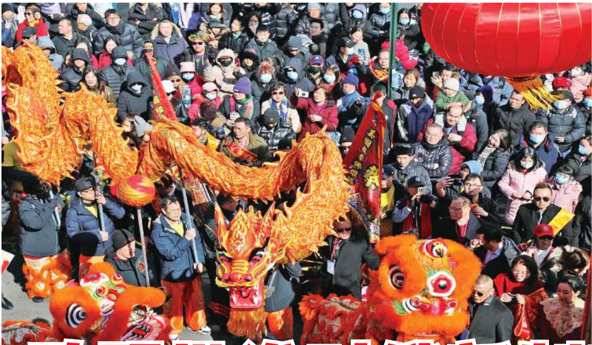
2月24日，在美国纽约，人们在元宵节庆祝活动上观看表演。