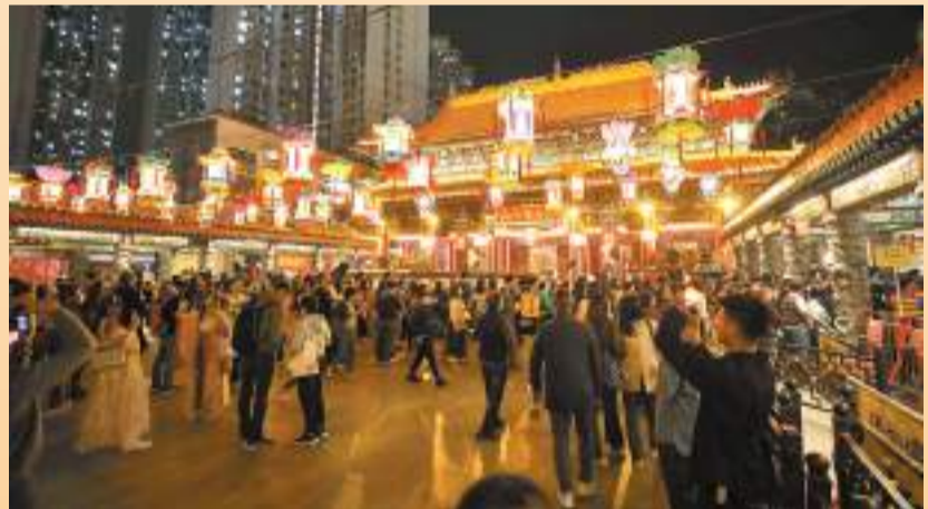
◆黃大仙廟元宵燈會十分熱鬧。

香港文匯報訊(記者 吳健怡)24日是農曆正月十五，為傳統節日「元宵節」，是一家人團圓相聚好日子，也是中國情人節，香港多處都舉行元宵活動。其中，由香港灣仔區各界協會主辦、灣仔民政事務處協辦的「灣仔元宵綵燈會」當晚在銅鑼灣開市舉行，現場設有免費民族服裝試穿、傳統歌舞表演、傳統工藝坊及打卡拍照熱點，氣氛熱鬧。當色園黃大仙祠亦延長開放時間至晚上10時，讓市民到場參拜月老，現場還有猜燈謎和夜光舞龍表演等活動，吸引大批市民和遊客到場歡度佳節。 「灣仔元宵綵燈會」24日晚在銅鑼灣記利佐治街及百德新街舉行。香港文匯報記者當晚到場，發現是次活動吸引不少市民。現場特別安排10個中國傳統文化特色攤位，以及設有新潮中國風的元宵節打卡布置，讓社會大眾感受佳節的氣氛外，更有免費民族服裝試穿和傳統歌舞表演，主辦單位並鼓勵市民以漢服造型到場，讓活動現場充滿濃濃的「漢風」。 現場更特設漢服造型比賽，分別有「最佳古裝造型男士組」及「最佳古裝造型女士組」，由主辦單位評選出各獎項得獎者，炒熱現場氣氛。 參與比賽的張小姐表示，自己近兩年對漢服文化着迷，故趁元宵悉心打扮，穿上長袖長袍青色漢服，戴上古代假髮，仙氣十足。 張小姐的朋友謝小姐同樣都是「漢服迷」。身穿馬面裙的她表示，漢服也曾登上時裝秀場，東風之美也驚艷了世界的目光，期望香港特區政府多舉辦類似的文化活動，