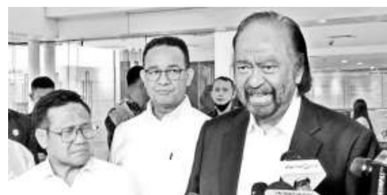
民族民主党总主席巴洛 (右)。

在2024年总统选举中，民族民主党推举阿尼斯-穆海敏成为总统和副总统候选人。民族民主党与公正福利党和民族复兴党联盟。