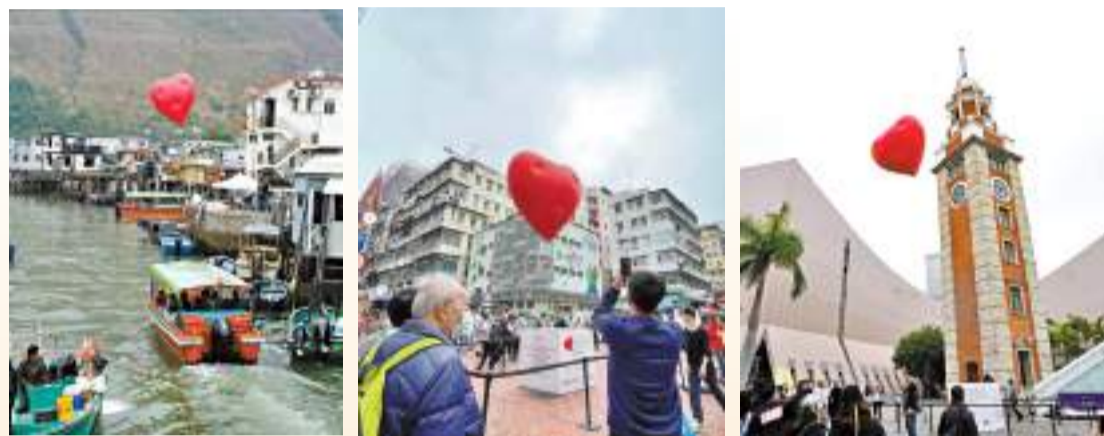
◆Chubby Hearts 24日分別在大澳(左)、深水埗(中)和尖沙咀(右)「快閃」。