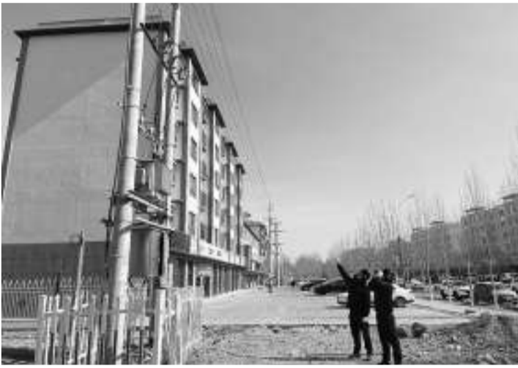
据国网阿合奇县供电公司介绍,当地主电网和配电网运行正常。目前,当地列车运行暂未受到影响。

地震发生后,新疆消防救援总队克孜勒苏柯尔克孜自治州消防救援支队、阿克苏地区消防救援支队与辖区速报员以及当地公安、应急等部门核实,截至13时暂无人员伤亡或房屋倒塌报告。