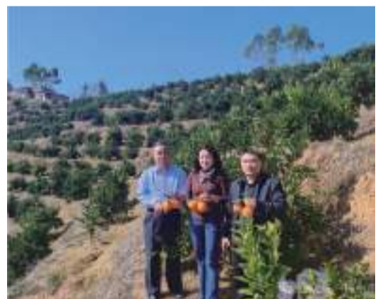
在中行鎮鴻基生態園綠映紅臍橙基地了解標準化種植情況