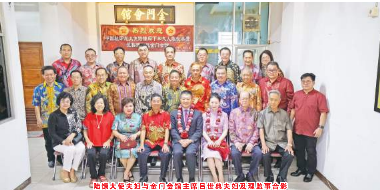
陆慷大使夫妇与金门会馆主席吕世典夫妇及理监事合影

【本报讯】2024年2月25日(星期日)上午11时，中国驻印尼全权陆慷大使和夫人、陈悦参赞一行受邀出席雅加达金门互助基金会2024年春节活动。金门互助基金会总主席吕世典偕夫人徐柳娘及基金会