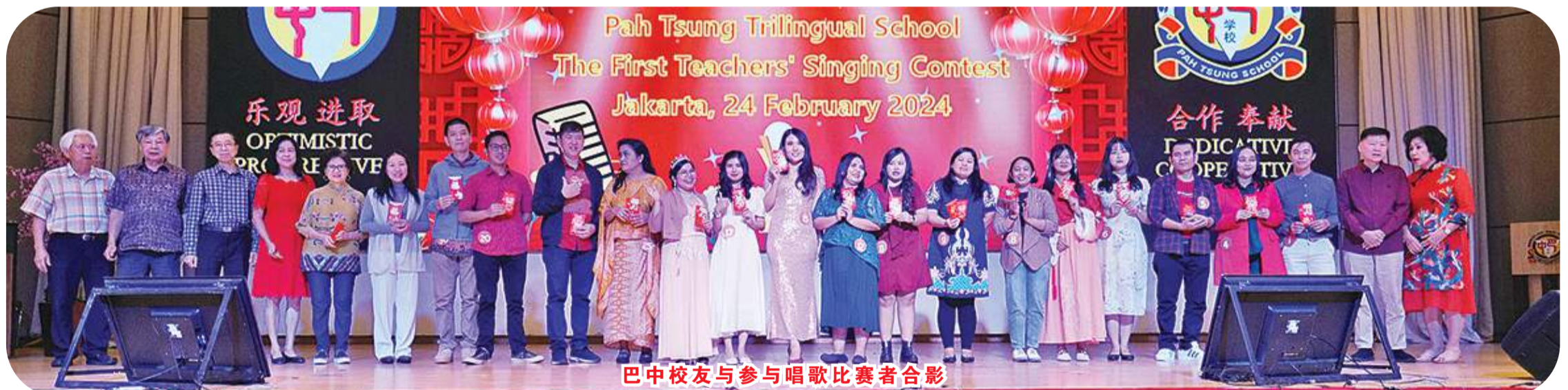
巴中校友与参与唱歌比赛者合影