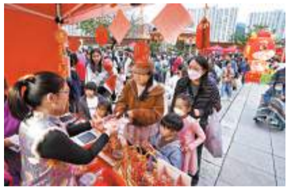
◆香港深圳社團總會聯同沙田民政事務處等舉辦「沙田元宵樂繽紛」活動。

香港文匯報訊(記者 子京)「18區日夜都繽紛——沙田元宵樂繽紛」於24日和25日一連兩天在沙田公園舉行。24日現場所見，場內設置多個節慶燈飾布置，供市民打卡；多個攤位遊戲前亦大排長龍，吸引一家大小參加。本次活動預計派出超過1萬份商場商戶優惠券，市民可以憑券到場參加抽獎，獎品總值超過16萬港元。 為配合香港特區政府18區「日夜都繽紛」的主題，沙田民政事務處、沙田區議會及香港深圳社團總會趁元宵佳節，於24日和25日舉辦「18區日夜都繽紛——沙田元宵樂繽紛」。 香港民政及青年事務局長麥美娟、民政事務總署署長張趙凱瑜、沙田民政事務專員余懷誠等出席活動啟動禮。麥美娟致辭時表示，是次活動有別於一般的市集，不是提供銷售攤位，而是與區內的商會、商場及商戶合作，通過幸運大抽獎、派發現金券及優惠券的形式，刺激市民的消费意慾。體現了政、商、民三方的通力合作，共同提振地區經濟。同時，活動也推廣了傳統中國文化，具有非凡意義。 香港深圳社團總會會長鄧清河介紹，本次活動設置了豐富多元的活動內容，包括花燈裝飾、節目演出、特色攤位等，讓市民在新春喜慶的日子裏，感受到中國傳統文化的獨特魅力，同時亦為提升地區活力增光添彩。總會未來會多與地區合作，舉辦市民喜聞樂見的活動。 沙田區議會提撥地區經濟專責工作小組主席鄧開榮表示，今次活動通過整合各方資源和力量，讓市民共度愉快的元宵佳節，增添市民幸福感受，促進地區經濟。 24日活動於下午3時開始，多個攤位遊戲大排長龍，入夜後人流愈來愈多。家住沙田的鍾女士帶同兩名子女參加「元宵投壺樂」遊戲，她笑說，特別來感受一下現場的熱鬧氣氛，希望香港龍年會更好。活動25日繼續，由下午3時至晚上8時半結束。