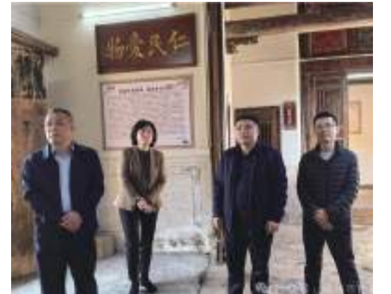
在中行鎮味真草廬了解“僑胞之家”籌建情況

建帶僑建”為引領，下大力氣推進“僑胞之家”建設，爭取在重點僑鄉鎮（街道）早日實現“僑胞之家”全覆蓋。同時要注重加強“僑胞之家”內涵建設，在聯誼交流、便民服務、僑情收集、文化交流等方面積極開展