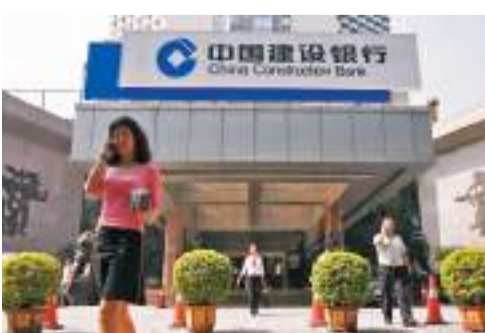
◆深圳建行以數字人民幣錢包作為橋樑，接入數字人民幣三方存管簽約和銀證轉賬功能。資料圖片

目前深圳建行已與11個區級政府、7個市級主管部門達成合作，面向全市11個重點行業共4.6萬戶預付商家推廣，資金監管規模逾1.1億元人民幣，為6.6萬市民保障預付資金安全。