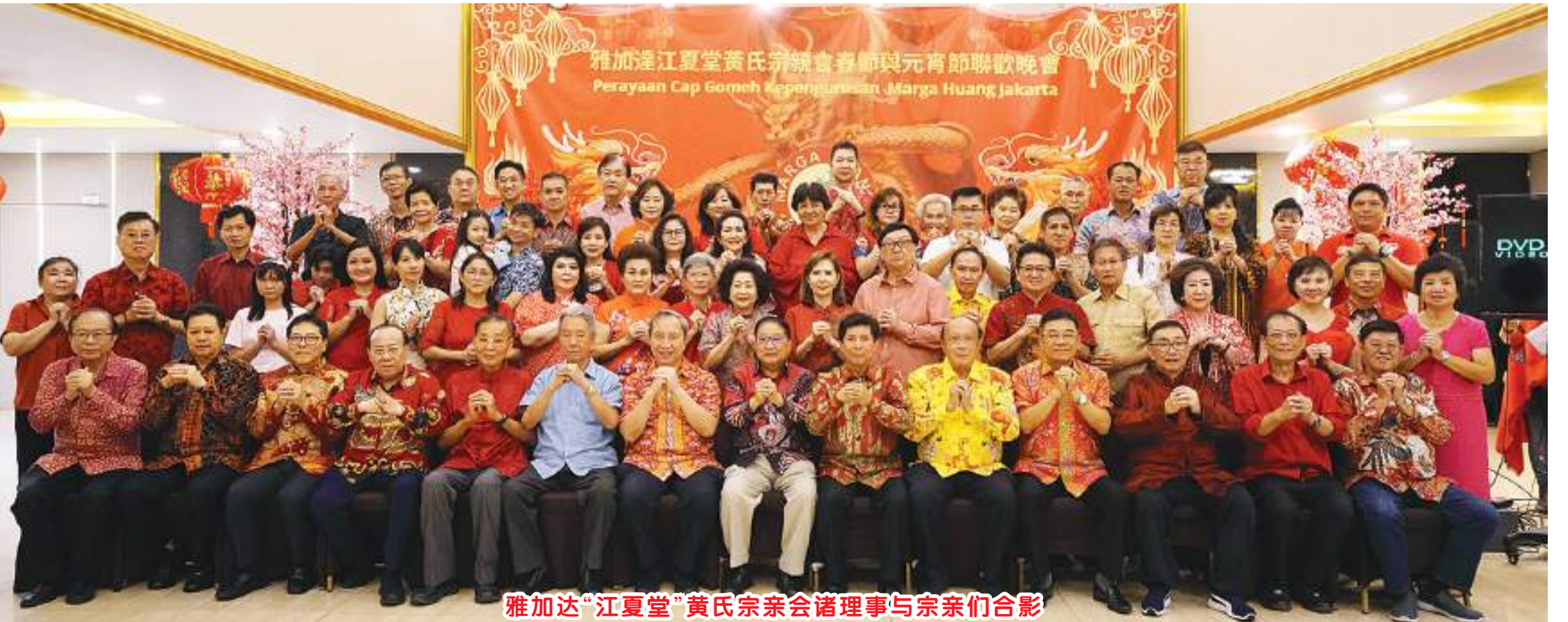
雅加达“江夏堂”黄氏宗亲会诸理事与宗亲们合影