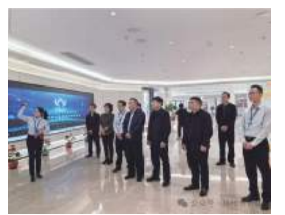
在廣東盈華電子材料有限公司聽取生產運營情況