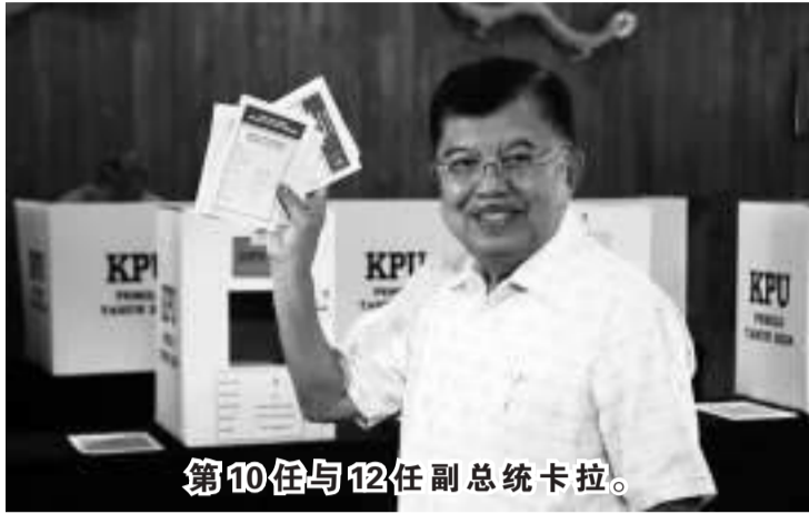
第10任与12任副总统卡拉。

【本报讯】2月24日，我国第10任与12任副总统尤淑夫·卡拉表示，国会若提交2024年大选涉嫌舞弊行为的调查权将使各方受益。此举将向公众证明是否发生舞弊的指控。当然调查权对双方都有好处，因为这次选举出现很多问题。调查权是为了证明2024年选举中涉嫌舞弊现象。但是，如果没有得到证实，公众就晓得出现的各种怀疑是没有发生的。因此如果进行调查，发现问题有问题，最好消除怀疑。希望任何一方都不应对提交调查权感到焦虑。原因是来自多个政党的过度困扰，甚至导致人们认为2024年选举中确实发生了舞弊行为；继