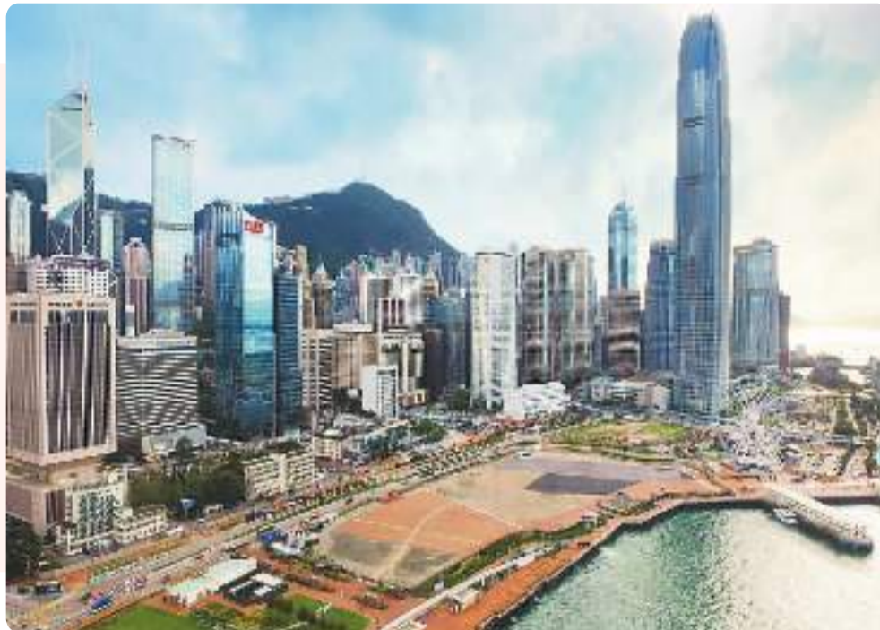
香港中环海滨演唱会场地。资料图片

随着“演唱会经济”不断升温,香港也面临着演出场地紧张、配套设施不完善等“痛点”问题。目前香港能够举办演唱会的主要场地可容纳观众人数均在1万—2万左右,最受欢迎的演出场所