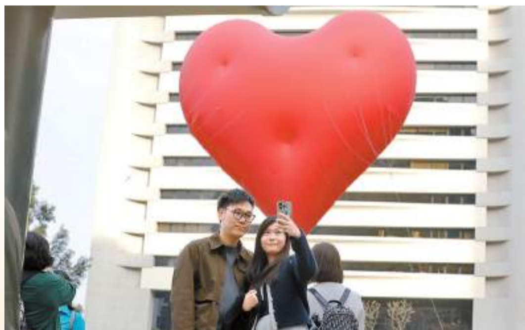
◆巨型飄浮紅心藝術裝置「Chubby Hearts Hong Kong」展期最後一天，吸引不少香港市民以至旅客到中環皇后像廣場的巨型紅心前打卡留念。

Chubby Hearts由本月14日的西方情人節開始一連11日在港展出，至24日的中國情人節畫上圓滿句號。其中，以在皇后像廣場長駐的巨心吸引最多市民和遊客，直徑約3公尺的「細心」亦每日在港九新界不同地點「快閃」，為多個社區增添趣味和創意，並為市民帶來歡樂。24日，Chubby Hearts 又在大澳水鄉、尖沙咀鐘樓以及深水埗鴨寮街現身，不少市民和遊客都感到驚喜，紛紛在這個飄浮紅心裝置前拍照。