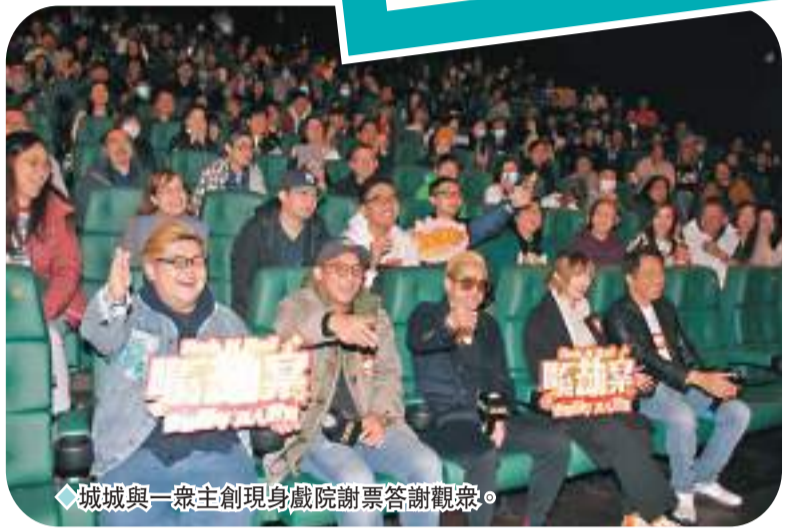
城城與一眾主創現身戲院謝票答謝觀眾。

問到小朋友有沒有看他演出，城城說：「暫時未看得，不過在家有讓她們看宣傳片，她們見到我中槍倒地都有喊，她們不是被嚇親，只是情商高很傷心。」城城又感謝劇照攝影師提早送他角色的巨型照片，所以小朋友都認到劇中角色原來是爸爸，待她們長大後一定會讓她們重看。至於電影上映場次不及其他電影，但仍贏得不少口碑是否是預料中事，城城深思一陣子後，以戲中金句「多謝」做回應。