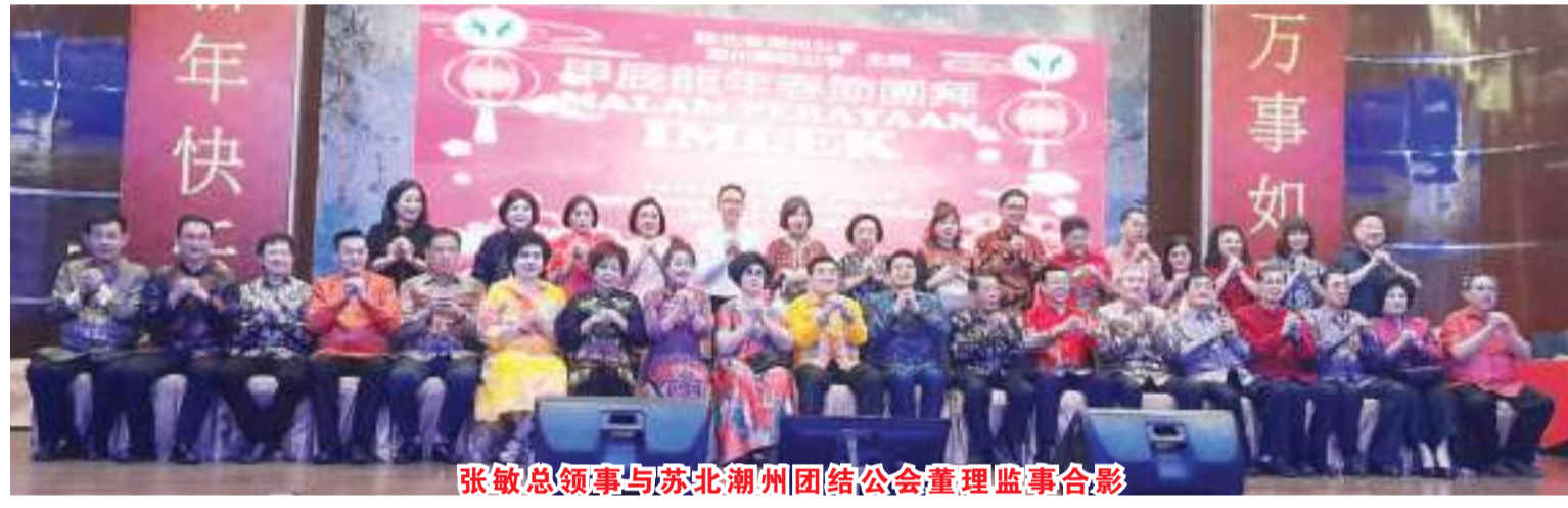
张敏总领事与苏北潮州团结公会董理监事合影