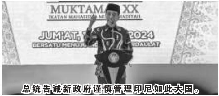
总统告诫新政府谨慎管理印尼如此大国。

【本报讯】3月1日，总统秘书处YT频道报道说，在南苏门答腊省巨港举行的穆罕默迪亚学生协会第廿届大会开幕式上发表讲话时，佐科维总统申明，下一届新政府必须谨慎管理像我们这样很大的国家。过去两个