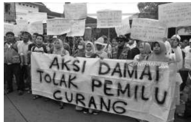
2024年选举涌现许多疑似舞弊事件引发各种示威活动

夏坎达指出，如果一个民族被舞弊，人民的权利受到干扰，那么人民应该生气。愤怒可以通过各种步骤来发泄，其中之一就是通过示威。选举中的