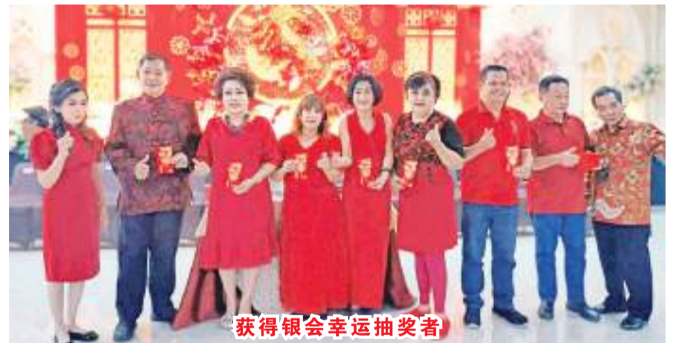
获得银会幸运抽奖者

OK、社交聚会、与其他团体以卡拉OK会友建立友谊。已有14年历史的和谐卡拉OK俱乐部也定期举办献血社交活动。” 他继续说, 这是因为自2007年以来一直参与捐血帮助红十字会(PMI)他指出, “最初, 当我筹备