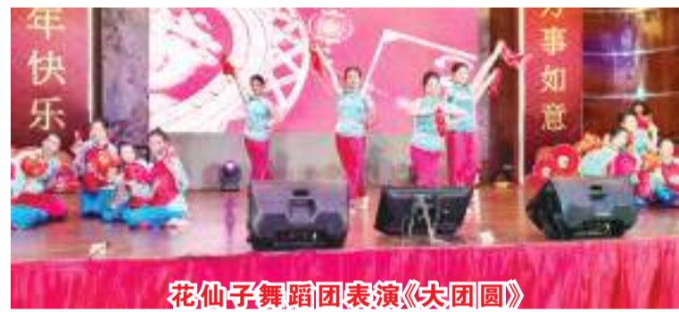
花仙子舞蹈团表演《大团圆》