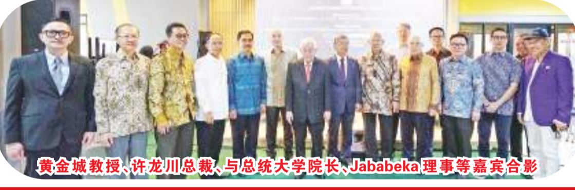
黄金城教授、许龙川总裁、与总统大学院长、Jababeka 理事等嘉宾合影