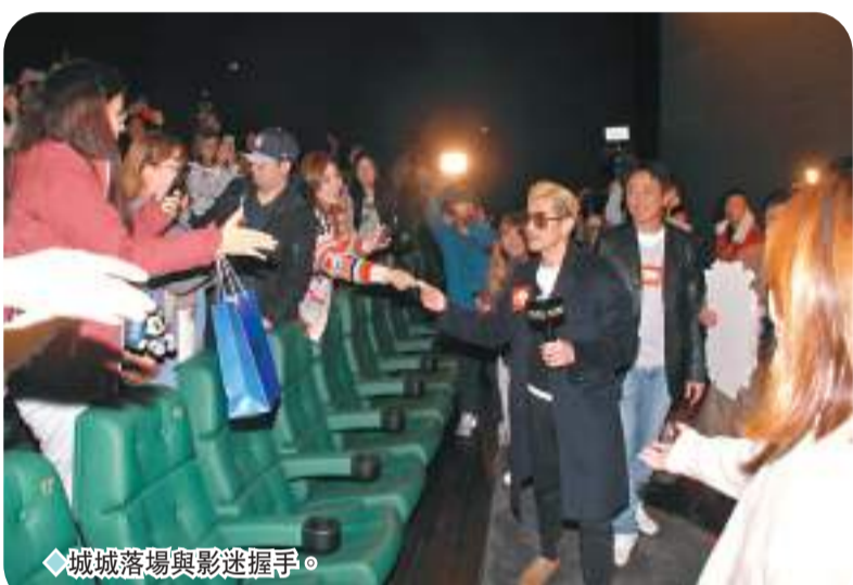
城城落場與影迷握手。