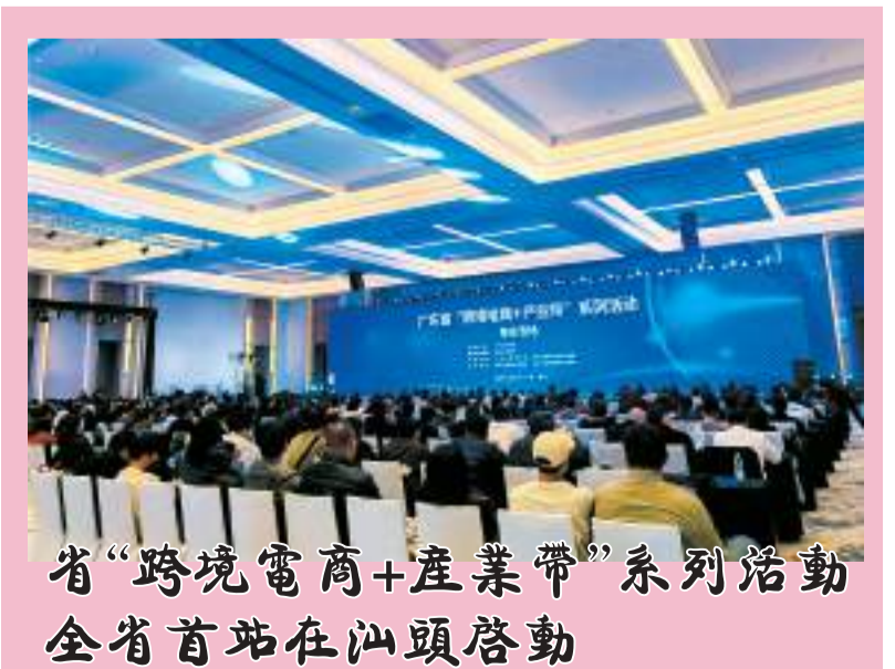
省“跨境電商+產業帶”系列活動全省首站在汕頭啟動

在跨境電商方面，汕頭市提出對在華僑試驗區註冊經營的跨境貿易和服務貿易企業，提供低成本、低延時、高穩定的國際通訊服務。在數字創意產業上，深圳與汕頭合作共建數字創意產業基地，對入駐基地的企業實施租金減免，服務汕頭市“工商並舉”現代產業體系建設。（李德鳴）