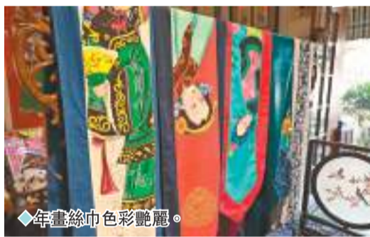
◆年畫絲巾色彩豔麗。

在全球一體化的當下，各個國家和地區非常重視「文化母語」。木版年畫作為傳統民間藝術的精華，具有重要的「文化母語」價值。在這個大趨勢下，綿竹年畫在繼承中發揚、不斷推陳出新，產品遠銷東南亞、歐美等50多個國家和地區，成為傳播中國文化、講好中國故事的一個有效載體。