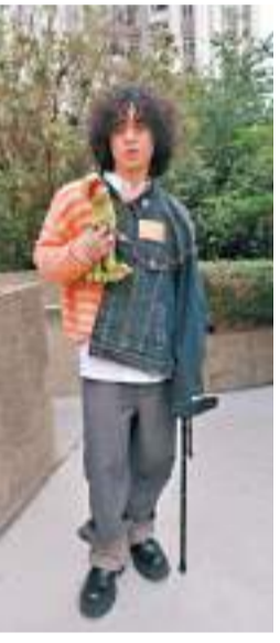
曾比特早前撐着拐杖出席活動。

Mike因行動不便，近日盡量減少出席公開活動先作休養，1日他終於在社交網「蒲頭」宣布好消息：「休息咗一星期，好榮幸同大家講，我可以慢慢行啦！」Mike透露現在可以郁得返，承諾未來會多拍攝，唱多些歌，跟大家多見面。