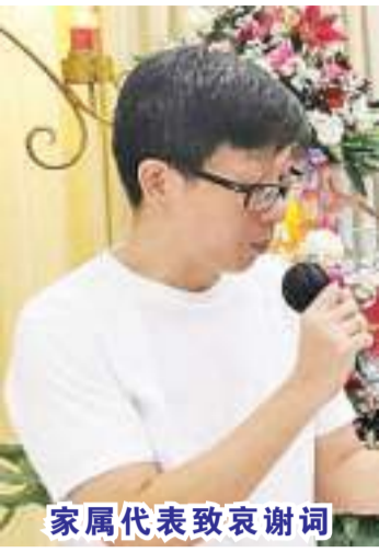
家属代表致哀谢词