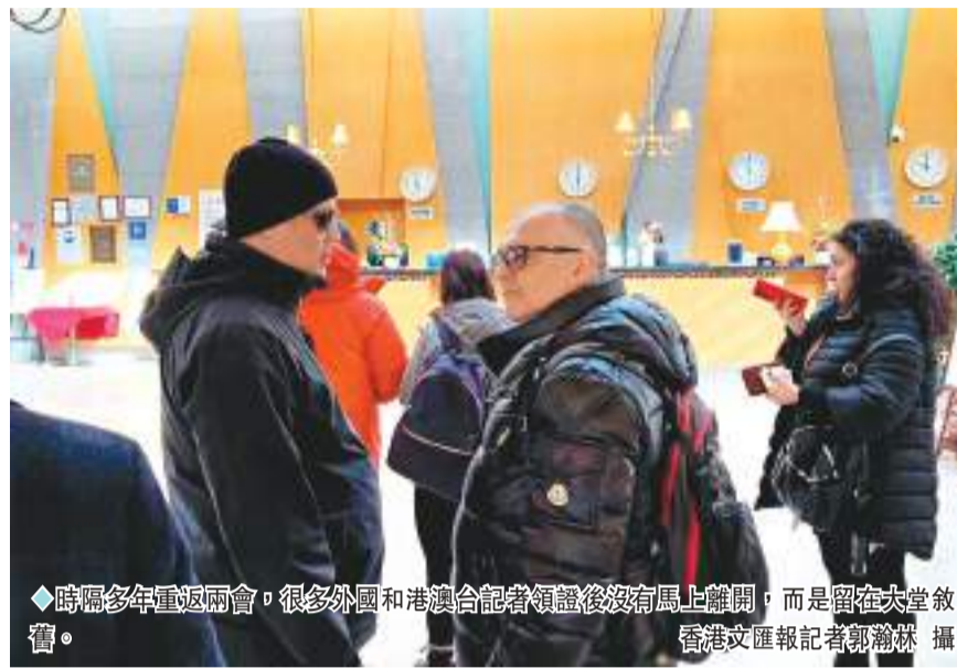
時隔多年重返兩會，很多外國和港澳台記者領證後沒有馬上離開，而是留在大堂敘舊。

意大利廣播電視公司(RAI)：我們更關注今年「兩會」中國政府會提出哪些提振經濟的方針政策，很關心今年政府工作報告中的內容。