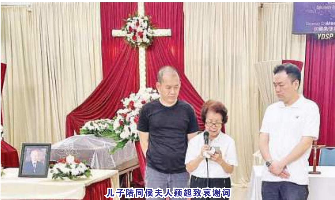
儿子陪同侯夫人颖超致哀谢词