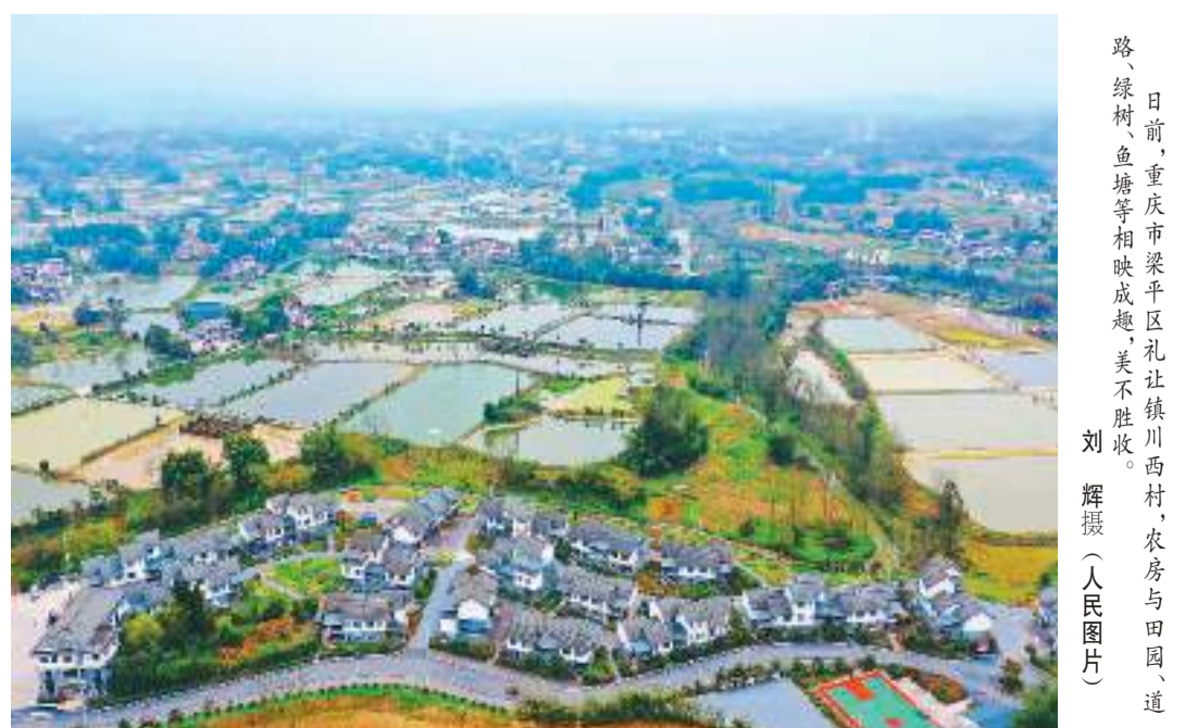
日前,重庆市梁平区礼让镇川西村,农房与田园、道路、绿树、鱼塘等相映成趣,美不胜收。

总统一道努力,赓续两国人民传统友谊,深化两国政治互信和各领域交流合作,推动高质量共建“一带一路”合作,引领中匈全面战略伙伴关系迈上新台阶。