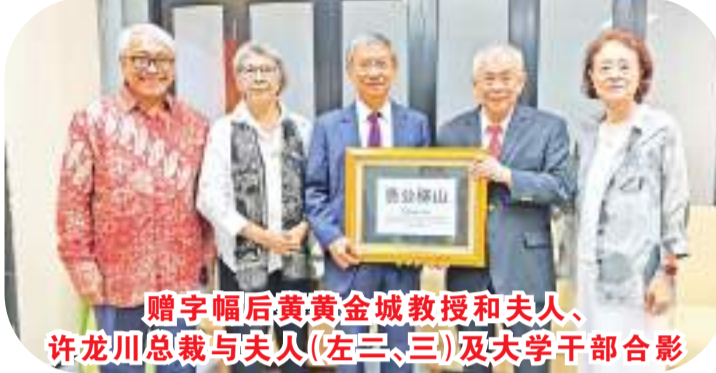
赠字幅后黄金城教授和夫人、许龙川总裁与夫人(左三、三)及大学干部合影