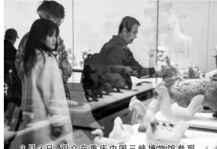
3月3日,观众在重庆中国三峡博物馆参观。时值周末,许多市民和游客来到重庆中国三峡博物馆参观,了解文物知识、领略历史和文化魅力,乐享周末时光。