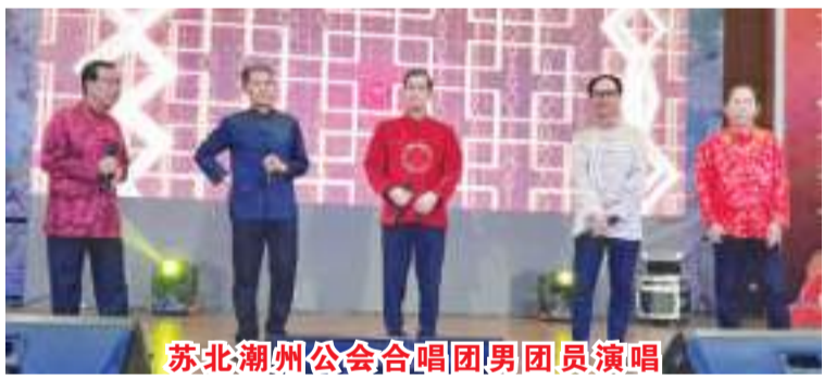
苏北潮州公会合唱团男团员演唱