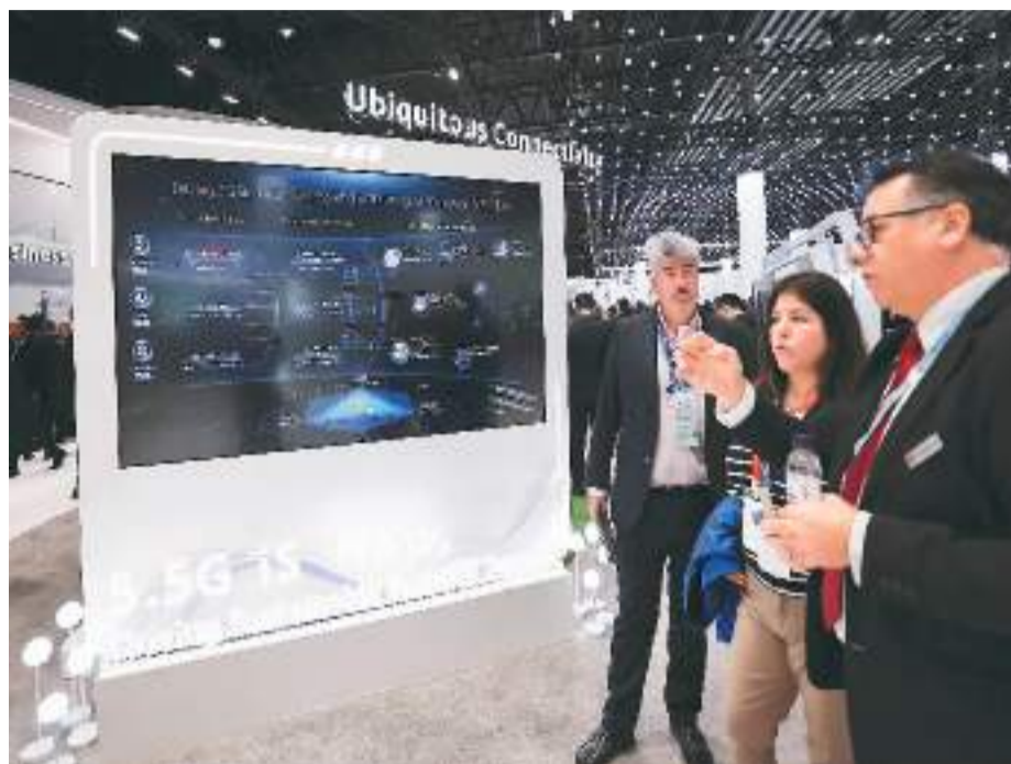
图为2月28日，在西班牙巴塞罗那举行的2024年世界移动通信大会上，人们在华为展台关注5G-A技术。

2月26日至29日，2024年世界移动通信大会在西班牙巴塞罗那会展中心举行。今年大会的主题为“未来先行”，重点关注超越5G、智联万物、人工智能人性化、数智制造等。来自200多个国家的2400多家企业参会，集中展示相关领域新产品新技术新方案。近300家中国企业积极参会，整体创新实力引发关注和好评。