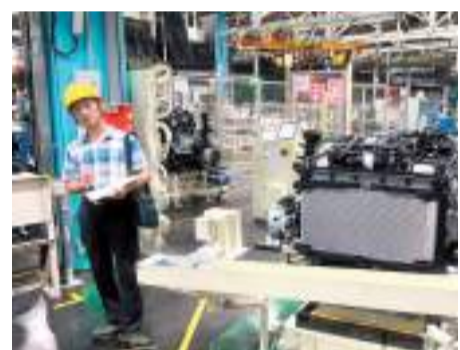
◆廣州工業智能研究院的科研技術在汽車裝配行業應用。