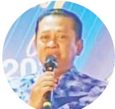
Bambang Soesatyo 致辞