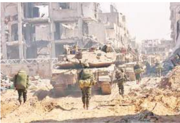
2月28日,以军部队在加沙地带南部城市汗尤尼斯展开军事行动。

新华社北京3月3日电 巴勒斯坦外交部长里亚德·马勒基2日说,巴民族权力机构希望加沙地带在本月开始的斋月来临前实现停火。