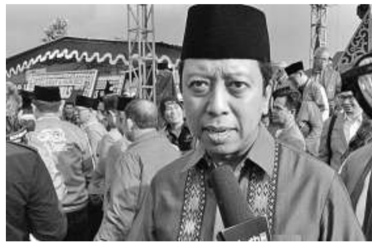
普拉波沃(左)在东帝汶执行秘密任务。

权有必要公开及透明地揭发大选期间的各种作弊行径。他也希望各界均保持克制，不需要对即将发生的进程感到敏感。他说：“上述调查权有必要公开揭发在大选进程中出现的各种作弊行径。因此没必要对此事感到敏感或担心。”