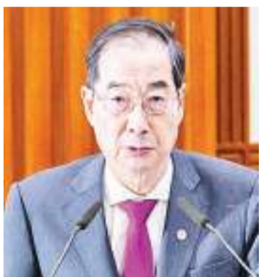
韩国国务总理韩德洙

香港中通社3月3日电 韩国国务总理韩德洙3月3日向政府设定的时限(2月29日)内未返岗的实习住院医师表示遗憾,并指出若医生继续非法离开医疗一线,政府将