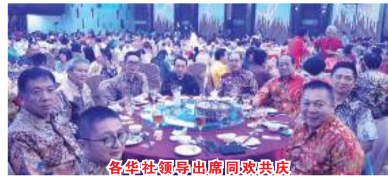
各华社领导出席同欢共庆