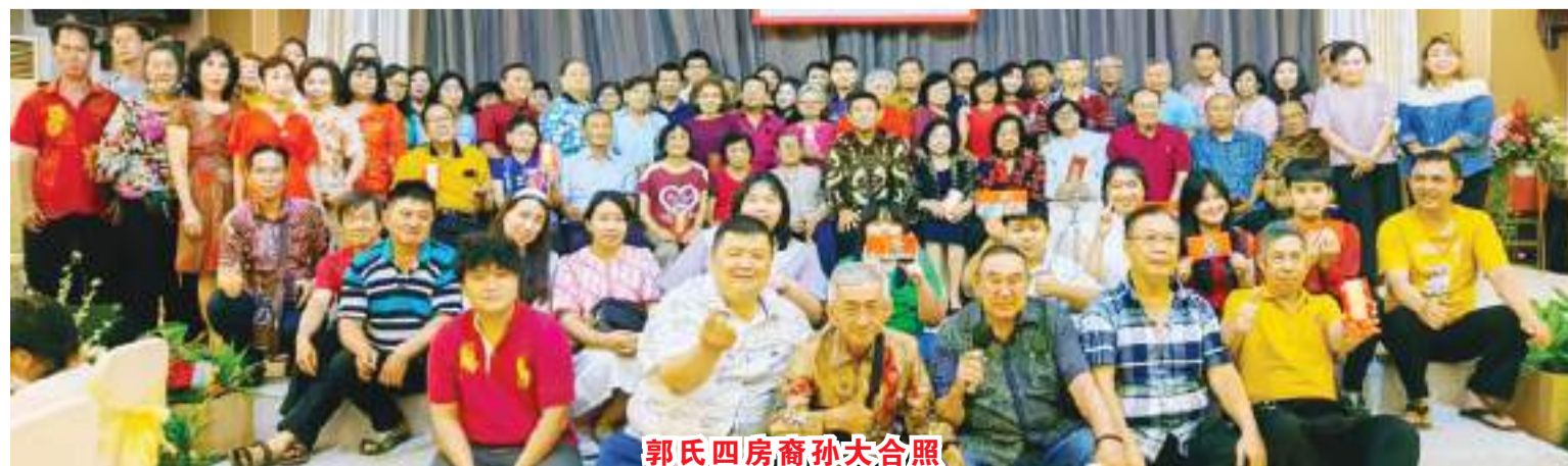
郭氏四房裔孙大合照