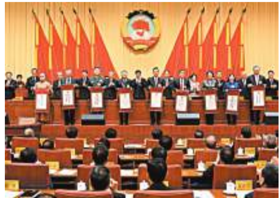
◆2023年度全國政協委員優秀履職獎表彰儀式3月2日下午在京舉行。圖為頒獎禮現場。

「我把這次獲獎，看作是對所有愛國愛港人士的褒獎。這個獎狀不單單是褒獎我，更是褒獎所有愛國愛港力量，激勵大家堅定維護國家安全和香港繁榮穩定。我將把這份榮譽帶回香港，讓所有愛國愛港人士受到鼓舞、堅定信心，齊心協力推進『一國兩制』行穩致遠。」他說。