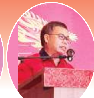
国会议员陈金扬医生致辞