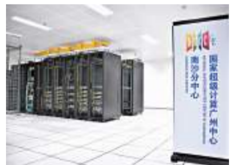
◆國家超級計算廣州中心南沙分中心由霍英東研究院運營。

▼高民介紹香港團隊利用廣州超算資源，為香港單車運動員提升運成績的典型案列。