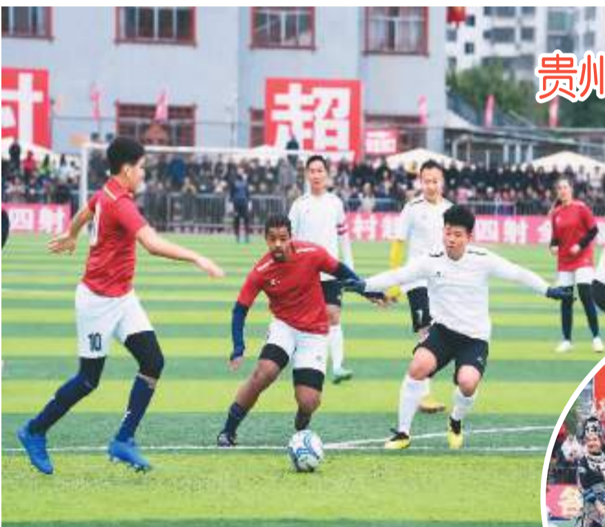
▲ 榕江村超联队球员与法国人民援助会足球队在比赛中。