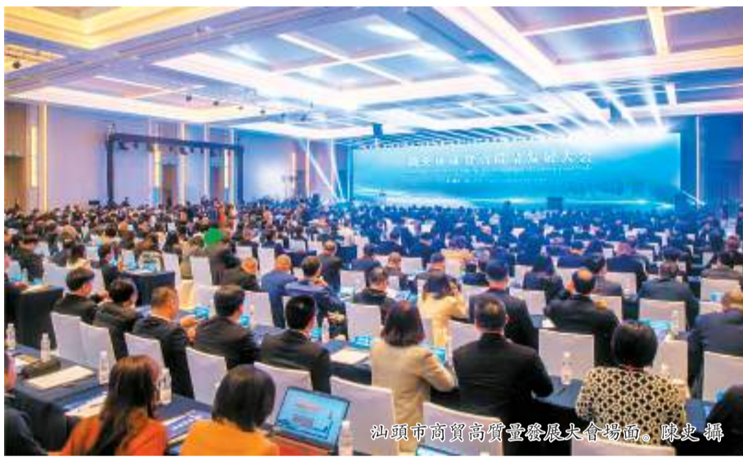
汕頭市商貿高質量發展大會現場。

【汕頭日報訊】2月27日，汕頭市委、市政府召開全市商貿高質量發展大會，深入學習貫徹習近平總書記視察廣東、視察汕頭重要講話重要指示精神，貫徹省委常務委員會在汕頭調研時的工作要求和省委常務委員會會議精神，落實全省高質量發展大會精神，堅持“貿”字當先、“工”字為本，以貿促工、以工興