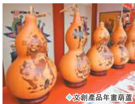
◆文創產品年畫葫蘆。