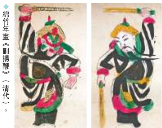
◆綿竹年畫《副揚鞭》（清代）。

對門神出售，換得幾文小錢回家過年。在創作時，沒有框框套套的束縛，全憑功力隨意發揮，一氣呵成。當時，富人對這樣的門神嗤之以鼻，只有窮人才買，甚至很多畫師也不承認自己會畫「填水腳」。誰料，隨意揮灑的幾筆類似於國畫大寫意，簡練粗獷、潑辣豪放、生動傳神，反而成了綿竹年畫中的上乘之作，顯得更加彌足珍貴。