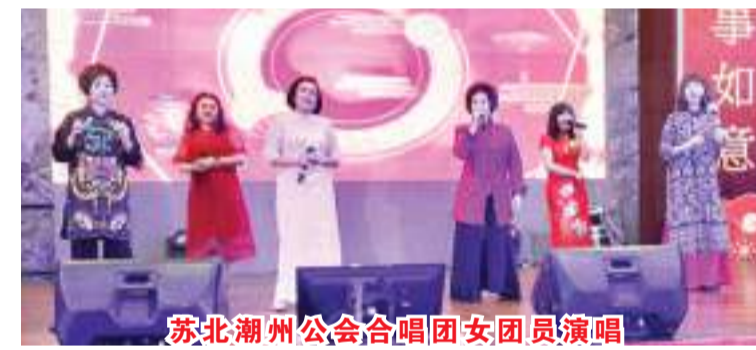
苏北潮州公会合唱团女团员演唱