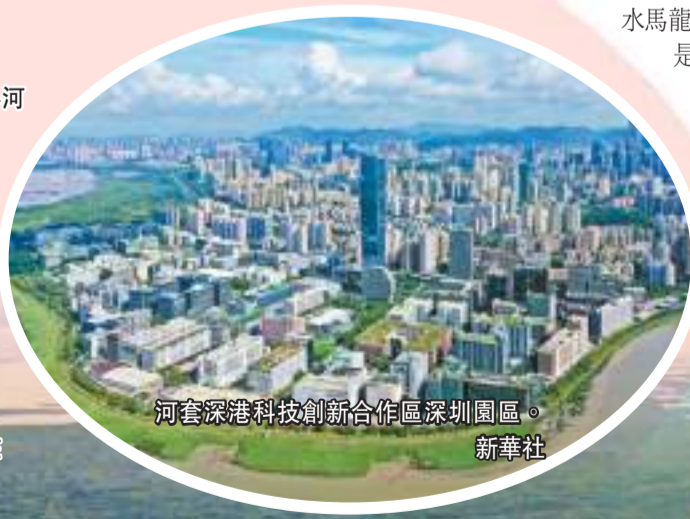
河套深港科技創新合作區深圳園區。