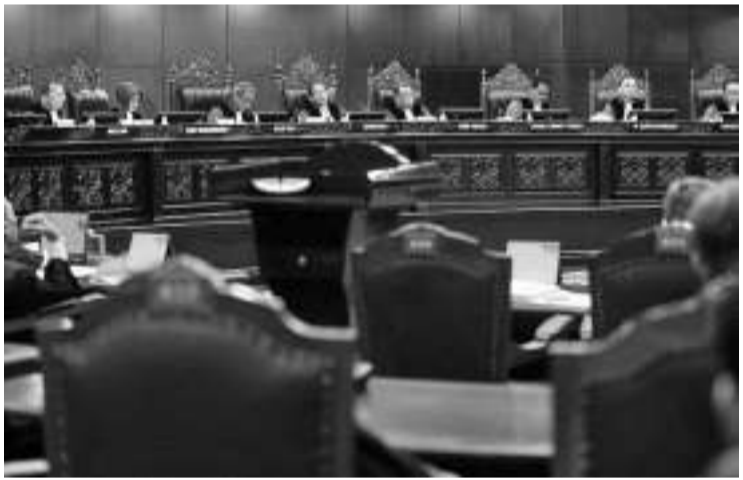
宪法法院庭审现场

【本报讯】继普选委员会主席哈欣(Hasyim Asy'ari)在4月2日庭审中睡着，被宪法法院首席大法官苏哈托约(Suhartoyo)训斥后，如今轮到普选监督机构主任也因为庭审过程中睡着遭苏哈托约斥责。 起初，甘贾尔-马福的律师团正在大选结果纠纷的庭审中提问时，苏哈托约向普选监督机构主席拉赫玛德(Rahmat Bagja)给予提问的机会，可是发现此人正在会见周公。 担任主审大法官的苏哈托约说：“普选监督机构主席睡着了，要不要提问？” 较早时，同样在宪法法院进行关于甘贾尔-马福