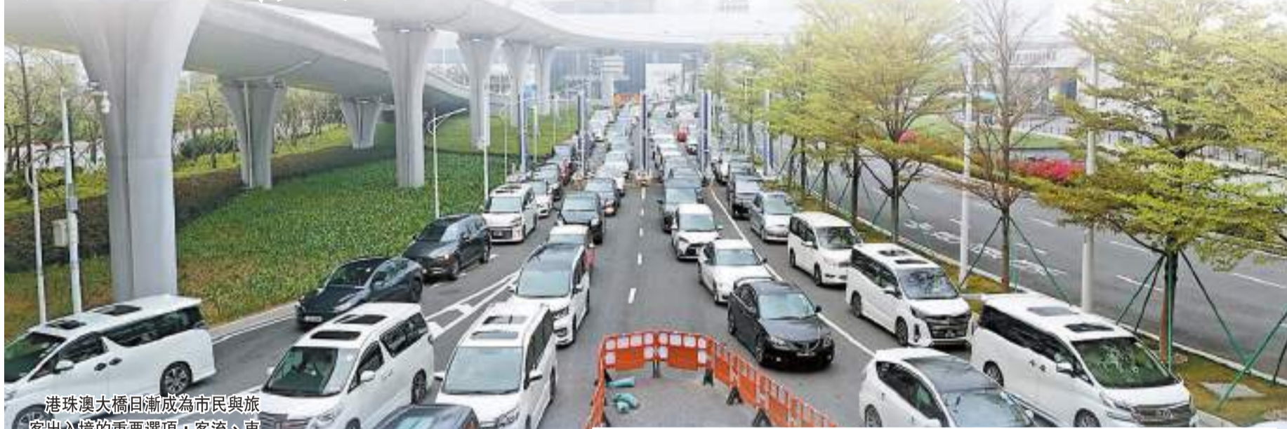
港珠澳大橋日漸成為市民與旅客出入境的重要選項，客流、車流連續4天單日超過10萬人次和1.64萬輛次。大橋橋道難得出現塞車景象。

【香港商報訊】記者陸紹龍、常亮、馮仁樂報道：入境處昨日發布數字顯示，3月29日至4月1日復活節長假期間，出入境人次合共錄得逾426萬，當中出境人次約219萬、入境人次207萬，顯示香港與內地在節日期間出現了「雙向奔赴」旅行消費的現象。在眾多口岸中，建成通車約5年的港珠澳大橋日漸成為市民與旅客出入境的重要選項，客流、車流連續4天單日超過10萬人次和1.64萬輛次，長假最後兩日車流更創下1.84萬和1.95萬輛次的新紀錄。