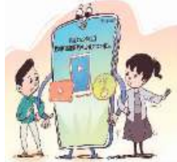
网络视听用户（漫画） 勾建山作