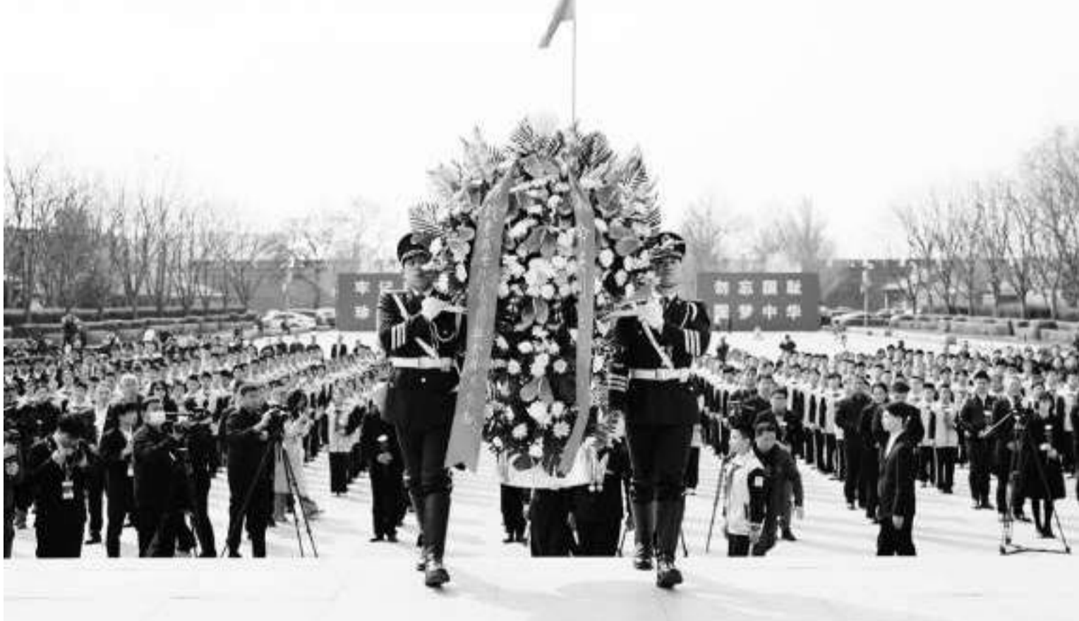
4月3日,老战士代表与学生代表在中国人民抗日战争纪念馆向抗战英烈献花。当日,“清明节的铭记——缅怀英烈志 筑梦现代化”主题教育系列活动启动仪式在中国人民抗日战争纪念馆举行。