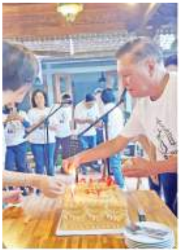
主席夫妇点燃生日蛋糕的蜡烛