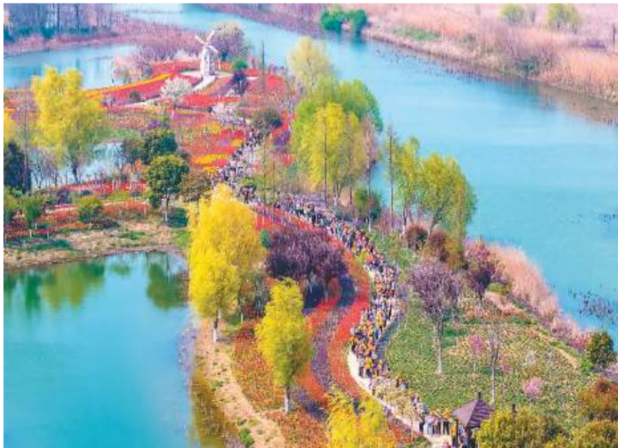
眼下,江苏省宿迁市泗阳县洪泽湖湿地景区春意盎然,百花盛开,该县青阳中心小学组织学生走进湿地景区,通过沉浸式研学之旅,感受家乡生态之美。图为4月1日,学生们在洪泽湖湿地景区游览。