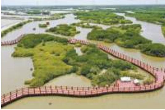
湛江金牛島紅樹林。資料圖片