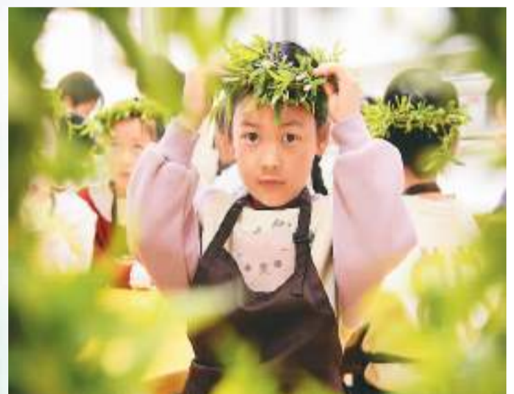
4月1日，河北省邯郸市广平县第四幼儿园的小朋友在体验戴柳帽民俗。