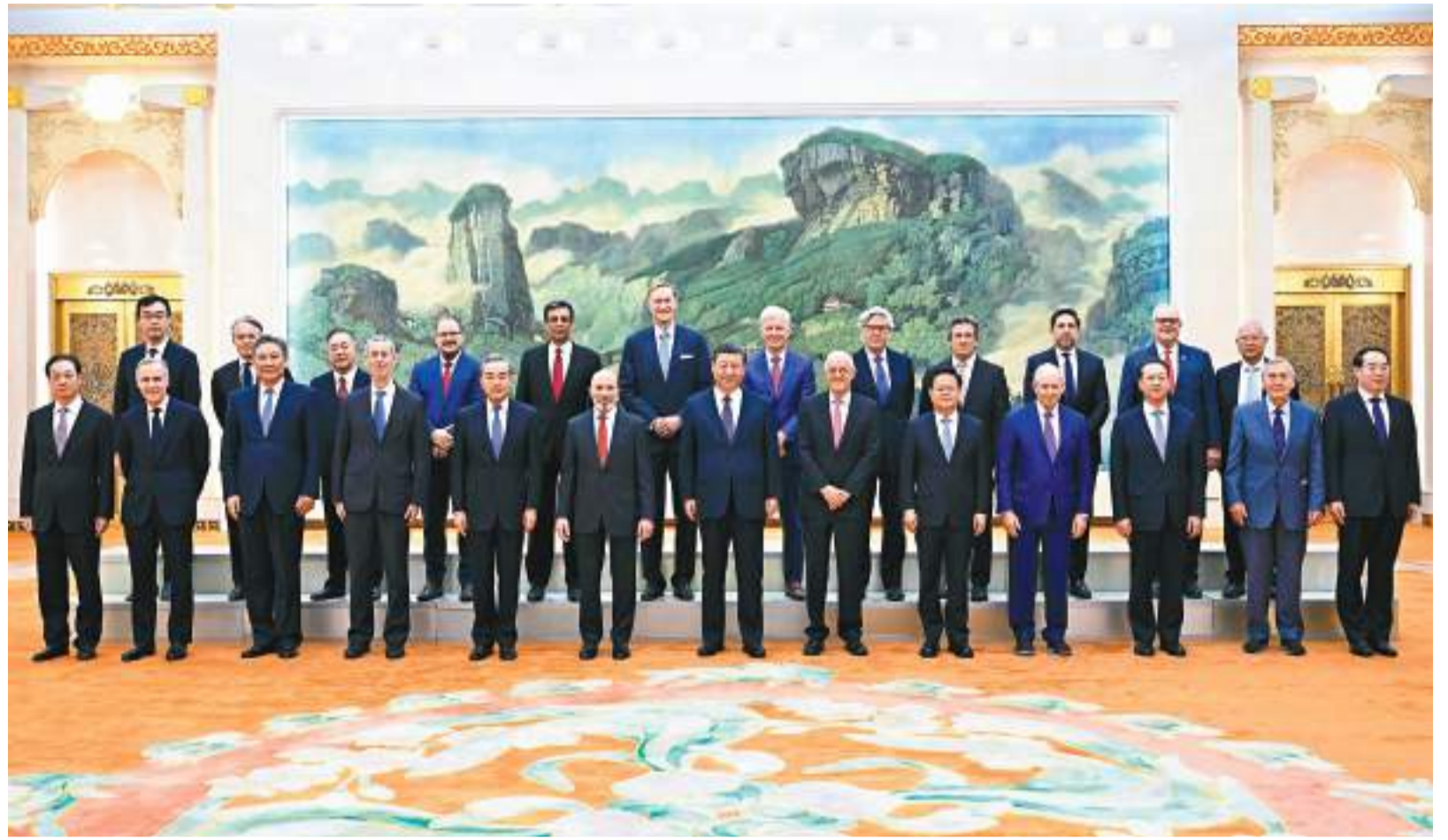
◆習近平應約同拜登通電話，強調如果美方願意開展互利合作，共享中國發展的紅利，中方的大門始終是敞開的。圖為3月27日，中國國家主席習近平在北京人民大會堂集體會見美國工商界和戰略學術界代表。

兩國元首認為，這次通話是坦誠、建設性的。雙方同意繼續保持溝通，貴成雙方工作團隊落實好「舊金山願景」，推進外交、經濟、金融、商務等領域磋商機制以及兩軍溝通，在禁毒、人工智能、應對氣候變化等領域開展對話合作，採取進一步措施擴大兩國人文交流，就國際和地區問題加強溝通。中方歡迎耶倫財長、布林肯國務卿近期訪華。