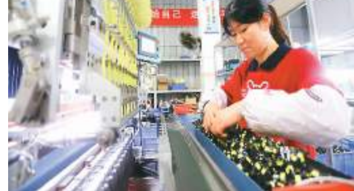
江西省吉安市安福县结合本地优势资源,出台相关优惠政策,支持当地劳动密集型企业在社区和农村建立“微工厂”,帮助群众在家门口就业。当前,该县“微工厂”数量达180余家,已吸收3600余人就近就业。图为4月2日,安福县洋溪镇桥村村民在当地一家电子厂加工电子零件。

中国人寿相关负责人表示,中国人寿将聚焦做好科技金融、绿色金融、普惠金融、养老金融、数字金融五篇大文章,强基础、优服务,改造提升传统动能,加快培育新动能,在推动建设中国特色现代金融体系中贡献力量。