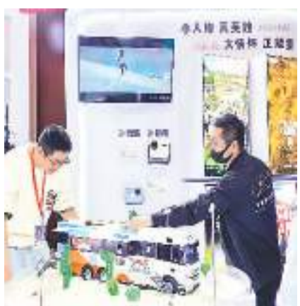
现场观众体验VR虚拟现实产品。