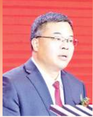
福州市委常委、福清市委书记叶仁佑致辞