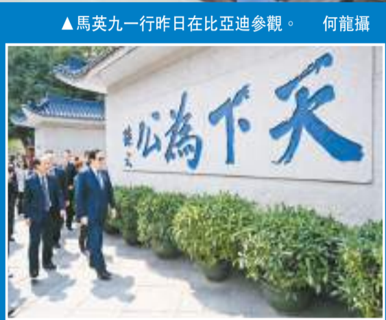
▲馬英九一行2日參訪位於廣東的孫中山故居。