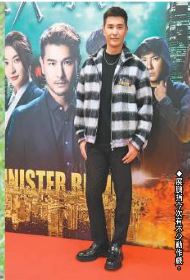
◆展鵬指今次有不少動作戲。