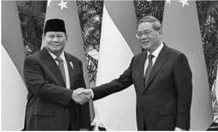
普拉博沃防长会见李强总理 领域交流合作。在全球范围，中国愿意加强与印尼的多边关系，包括从东亚到联合国的多边关系。

表示赞赏。 新华社援引李强的话表示，普拉博沃决定访华体现了两国的亲密关系。中方愿与印尼方一道，在全球和地区领域采取各种具体举措，推动两国合作。中国也愿意为印尼和中国带来更多利益。双方要加强“一带一路”倡议与印尼发展战略对接，加快重点项目建设。这一承诺还需要深化农林渔业等传统领域合作，扩大高新技术和新兴产业合作，加强民生