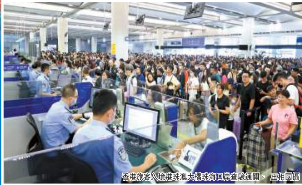
香港旅客入境港珠澳大橋珠海口岸查驗通關。

【香港商報訊】記者陸紹龍、常亮、馮仁樂報道：入境處昨日發布數字顯示，3月29日至4月1日復活節長假期間，出入境人次合共錄得逾426萬，當中出境人次約219萬、入境人次207萬，顯示香港與內地在節日期間出現了「雙向奔赴」旅行消費的現象。在眾多口岸中，建成通車約5年的港珠澳大橋日漸成為市民與旅客出入境的重要選項，客流、車流連續4天單日超過10萬人次和1.64萬輛次，長假最後兩日車流更創下1.84萬和1.95萬輛次的新紀錄。