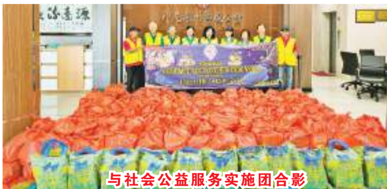
与社会公益服务实施团合影

在开斋节期间向经济薄弱家庭分发生活必需品礼包以减轻他们的负担，是印尼潮州乡亲公会每年例行开展的社会公益活动，在斋戒月表达他们的关怀和祝福。礼包内含大米、食用油、砂糖、营多泡面、饼干、糖浆、咖啡。(BAM/EKA)