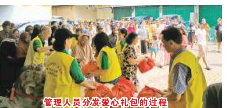
管理人员分发爱心礼包的过程