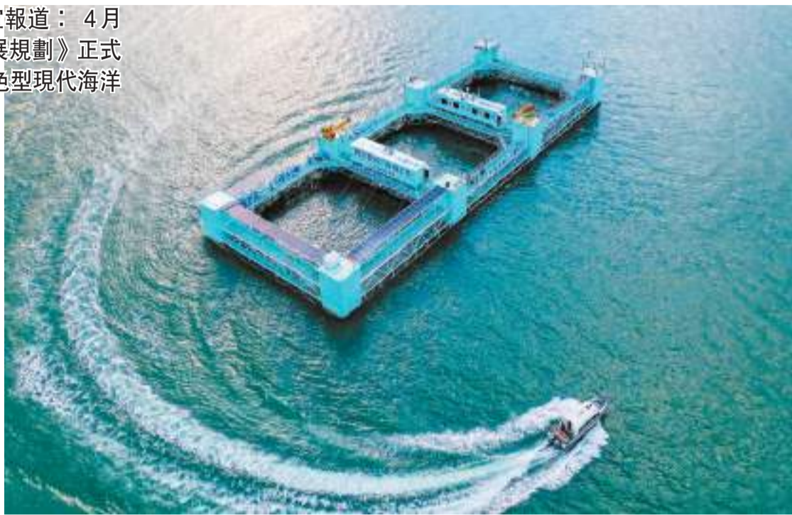
湛江建設海上牧場和「藍色糧倉」，圖為半潛桁架式巨型智能養殖平台「海威2號」，單個周期可養魚百萬斤以上。

具體來看，發展綠色臨港產業，打造世界級綠色臨港工業集聚區，主要包括大力提升鋼鐵石化產業集群