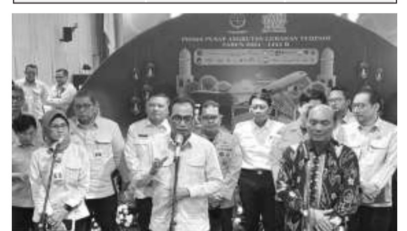
交通部设立开斋节运输哨站 交通部长苏马迪 (Budi Karya Sumadi) 于4月3日在雅加达,为设立开斋节运输中心监督哨站后提供说明。