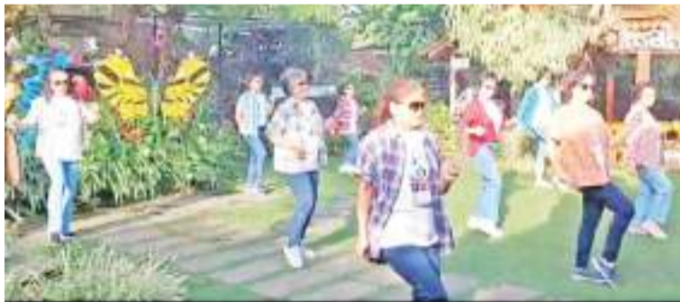
LD My Home Town