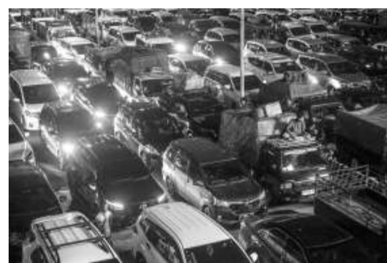
孔雀港返乡车辆开始拥堵