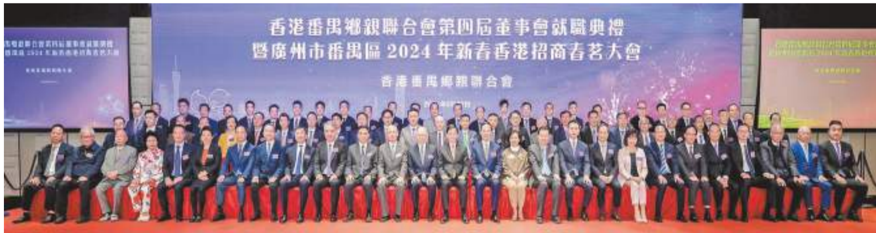
廣州市番禺區在香港舉辦香港番禺鄉親聯合會第四屆董事會就職典禮暨廣州市番禺區2024年新春香港招商春茗大會，賓主合照。

【香港商報訊】3月27日，廣州市番禺區在香港舉辦香港番禺鄉親聯合會第四屆董事會就職典禮暨廣州市番禺區2024年新春香港招商春茗大會，與香港政界、商界知名人士，番禺籍廣州市榮譽市民，旅港番禺鄉親共賀新春、共敘鄉情、共謀發展。香港特別行政區行政長官李家超，外交部駐港公署參贊、領事部主任魏文修，香港特區政府民政及青年事務局局長麥美娟，番禺區委書記黃彪，區委常委、統戰部部長、區政協黨組副書記鄧耀棋，區委常委、區委辦主任鄧展鵬，香港番禺鄉親聯合會會長霍啟文、主席李民強，以及區有關職能部門的領導出席大會。