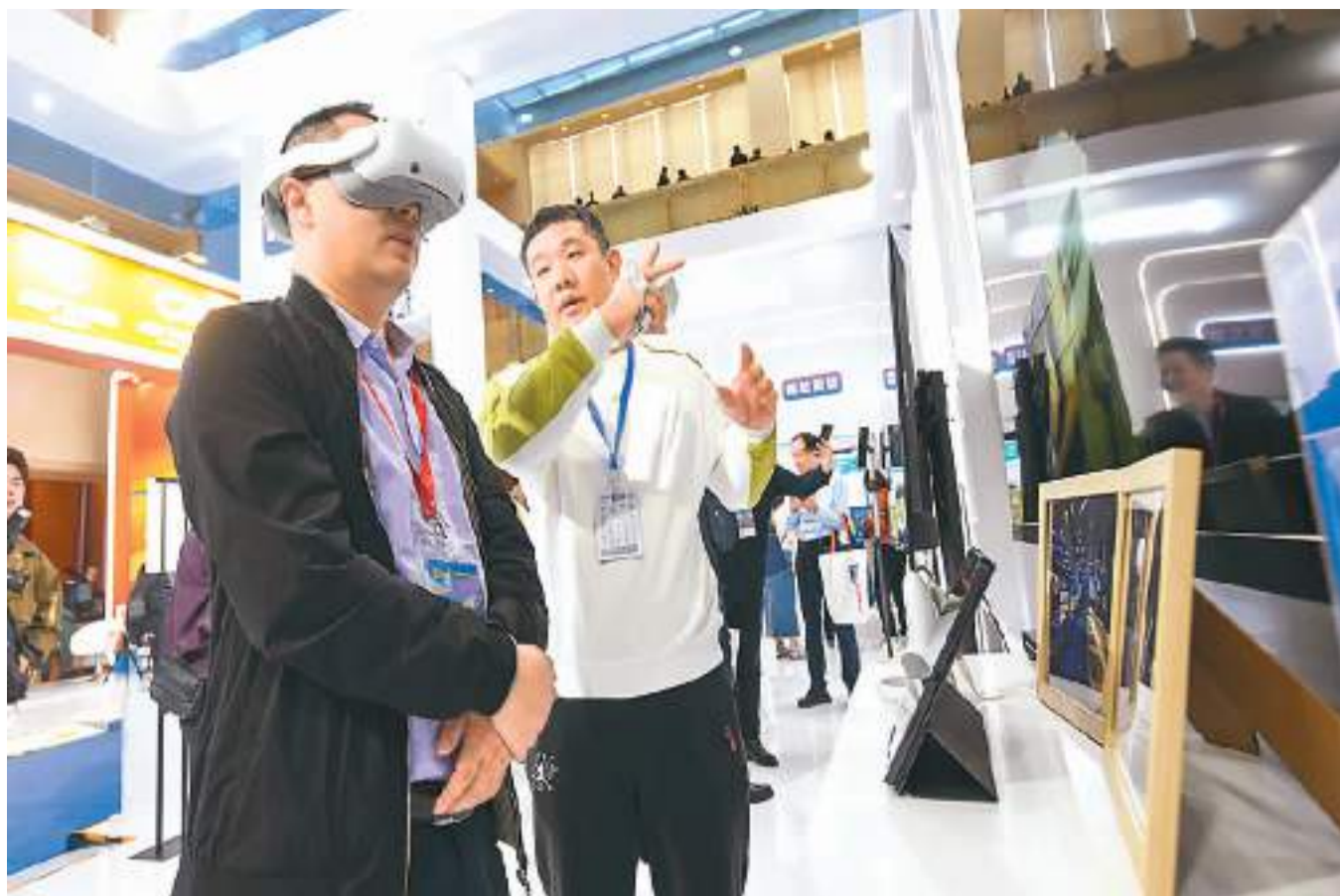
在第十一届中国网络视听大会“新技术与精品节目展”现场，参展商给参会者介绍VR虚拟现实产品。