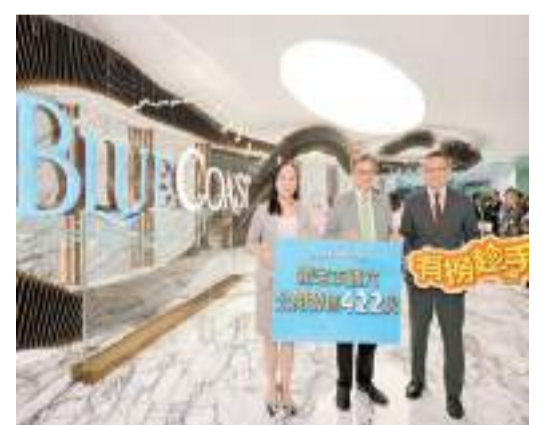
Blue Coast 宣布加推第三張價單，新加推174伙，本週六首輪發售422伙。

ONE STANLEY自上周五起接受預約人士參觀示範單位，據發展商透露，市場反應熱烈，預約名額持續爆滿，大部分查詢均對項目的4房4套設計的特色低密度住宅及獨立洋房感興趣，當中六成為用家、投資者佔四成；內地客佔五成。