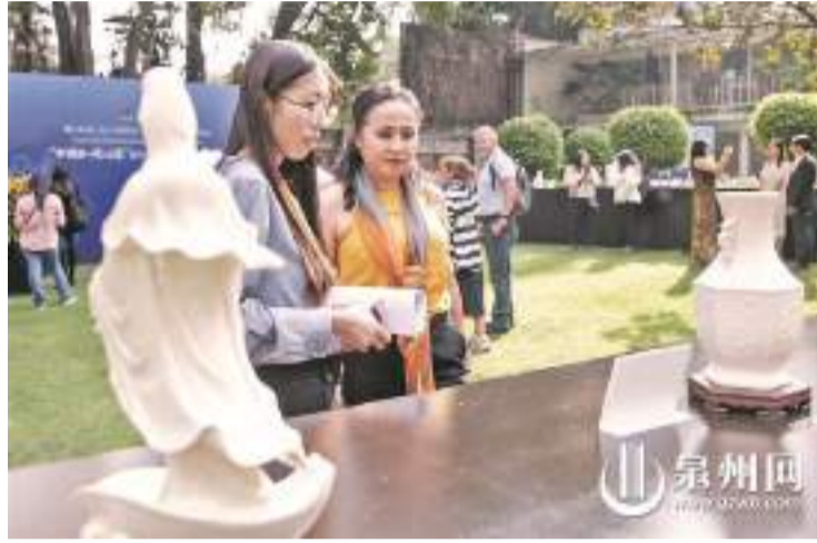
德化瓷深深吸引參觀者

泉州網3月30日訊(通訊員 林婉清 融媒體記者 許鈺鈺/文)日前,在美國、墨西哥、荷蘭舉行的2024年“中國白·德化瓷”國際巡展系列推介活動圓滿落幕。此次國際巡展為期9天,跨越美歐三國,在藝術互鑒、人文交流、市場拓展等方面取得豐碩成果。