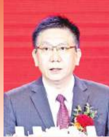
福建省委统战部副部长李文慎致辞