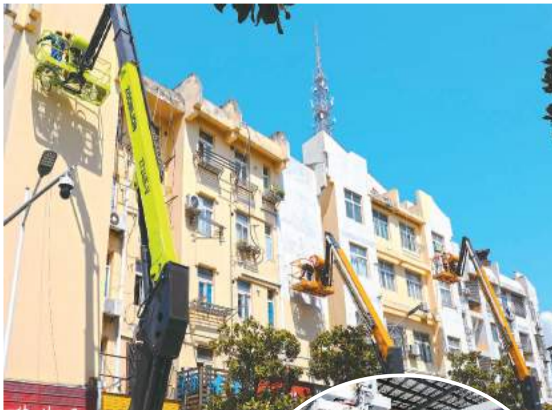
▲安徽芜湖市繁昌区有序推进老旧小区改造提升暖心工程，着力实施外墙立面修复、屋顶漏水修复、增设公共绿地等改造内容，积极推动绿色建筑、低碳建筑规模化发展。图为繁昌区繁阳镇安定西路一小区，施工人员在云梯机上粉刷绿色环保外墙。

像这样的低能耗建筑还有很多。近年，中国大力发展绿色建筑，2022年，全国新建绿色建筑面积占比已到达91.2%，累计建成节能建筑面积超300亿平方米。