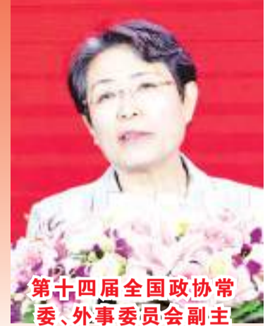
第十四届全国政协常委、外事委员会副主任、中国侨联原副主席隋军致辞

据“闽声”讯：4月1日至4日，世界福清同乡联谊会成立35周年暨第九届主席团会员代表大会在福清隆重举行。2日上午，世联第九届主席团就职庆典大会暨中印尼“两国双园”推介会正式开幕，大会围绕“团结爱乡初心在，承前启后创未来”的主题，来自世界各地近400位侨胞齐聚