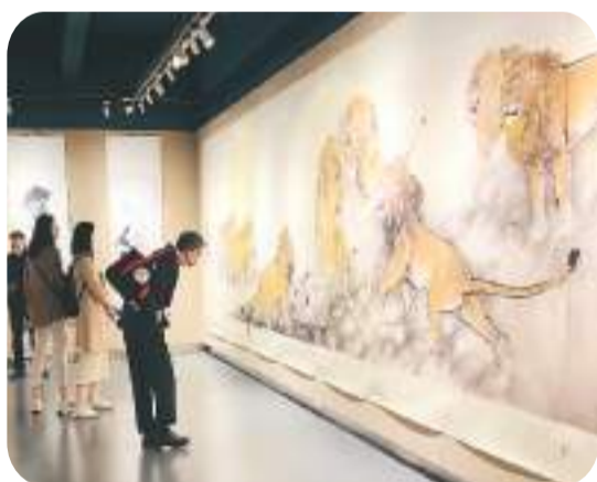
图为近日，观众在泉州华侨历史博物馆欣赏施荣宣的画作。

近日，“寻根溯源——泉籍华人艺术家施荣宣六十五年美的历程作品展”在福建泉州华侨历史博物馆举办。施荣宣祖籍泉州晋江，移居菲律宾逾60年，是岭南画派的一名海外传人。此次展览共展出70幅绘画作品。