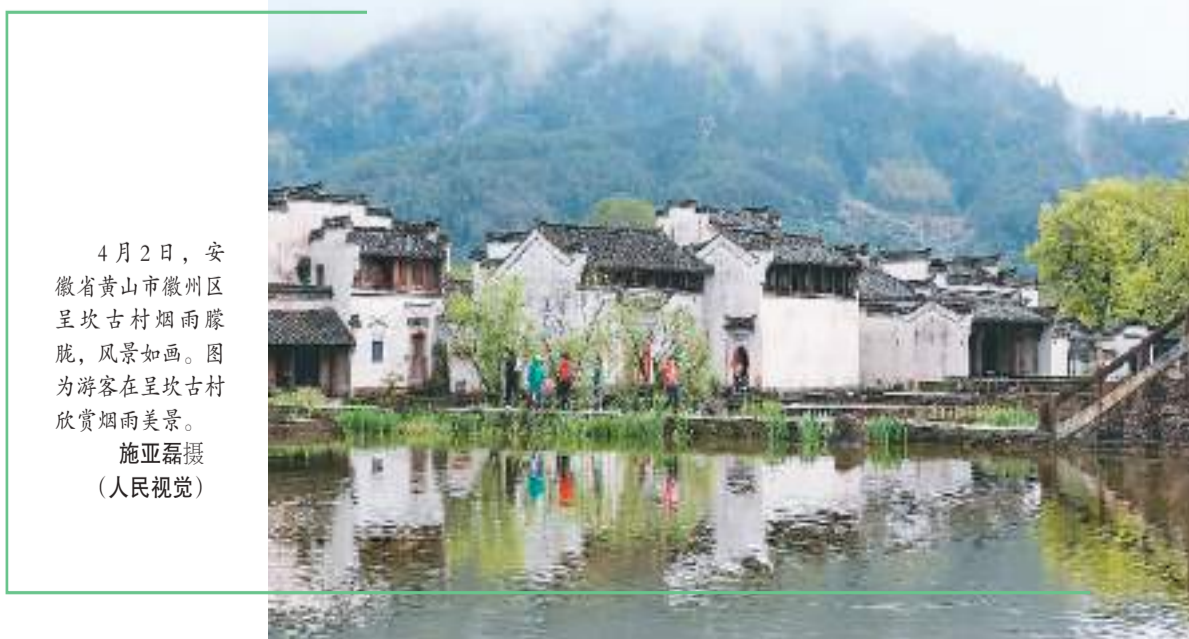
4月2日,安徽省黄山市徽州区呈坎古村烟雨朦胧,风景如画。图为游客在呈坎古村欣赏烟雨美景。

开发利用公共数据,是激活数据要素潜力的引领工程。国家数据局将推进公共数据资源管理和运营机制改革,对建立资源登记制度、授权运营披露机制等作出安排,同时明确公共数据授权运营的合规政策和管理要求,厘清数据供给、使用、管理的权责义务,激发“供数”动力和市场创新活力。