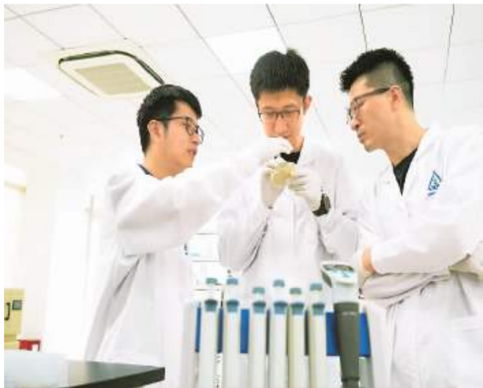
晃然（中）与团队成员在实验中。

本届大赛以项目落地为目标，决赛期间为参赛选手组织了金融对接会、落地需求对接会等服务活动，多个项目团队与有关企业、医疗机构等达成合作意向。