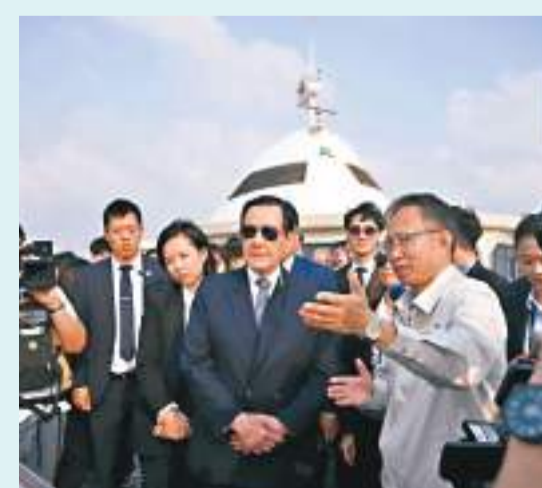
◆4月2日，馬英九一行在港珠澳大橋東人工島參觀。

大橋邊檢站2日公布，繼3月31日港珠澳大橋珠海口岸創下單日出入境車流1.84萬輛次紀錄後，4月1日口岸又