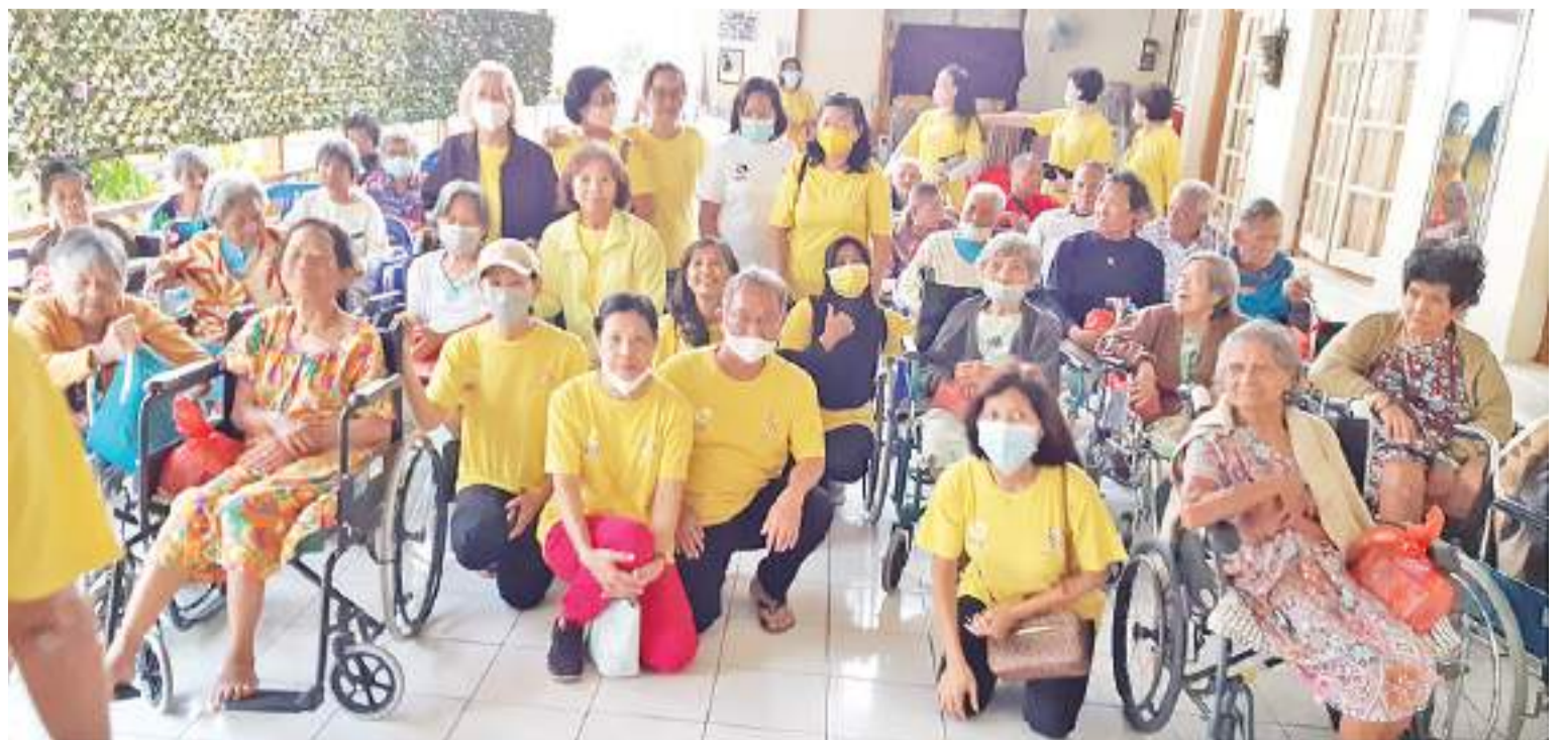
SSSC 去老人院捐献爱心