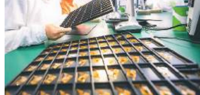
近年来,湖北省黄石市培优培强“专精特新”企业,发展新质生产力,目前全市拥有省级及以上“专精特新”企业203家,国家级专精特新“小巨人”企业24家。图为在黄石市一家光电技术企业车间,工人加紧赶制工业级触摸屏订单产品。

根据《中华人民共和国印花税法》的相关规定,企业从事离岸转手买卖,在企业采购、销售两道环节需对书立的合同按照合同金额的万分之三征收买卖合同印花税。