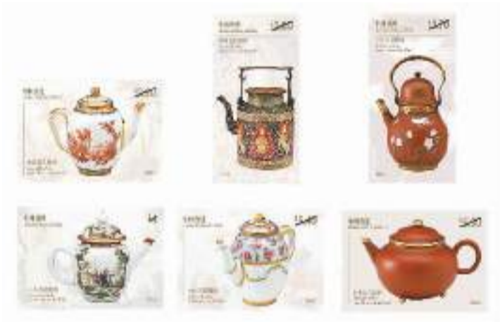
图为“香港馆藏选粹——中外茶具选粹”一套6枚邮票。

本报香港4月2日电（记者陈然）香港邮政2日宣布，将于4月18日推出以“香港馆藏选粹——中外茶具选粹”为题的特别邮票及相关邮品。