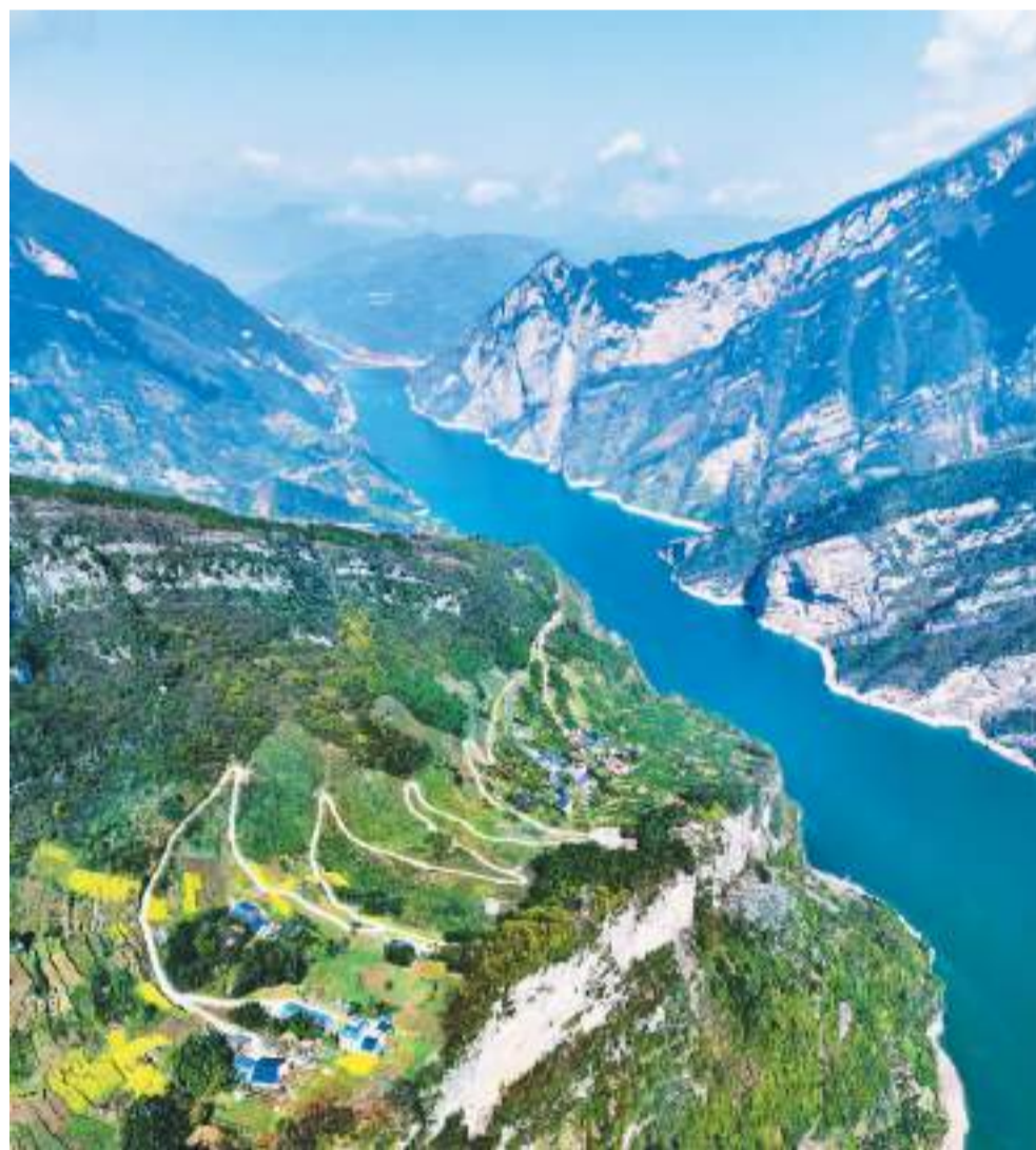
路畅景美 画里峡江

近年来,湖北省宜昌市秭归县为原来要攀着链子才能上山的链子崖村新修了公路,同时还修建了崖上步游栈道和观景平台,带动当地旅游,助力乡村振兴。图为链子崖村乡村公路穿行于美丽的峡江风景之中。