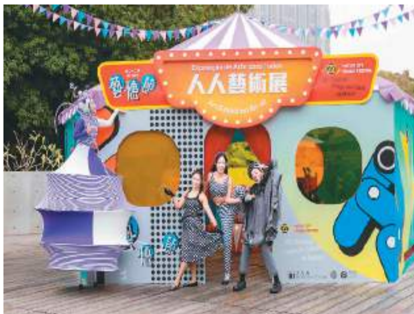
现场。图为澳门艺术节上举办的“人人艺术展”活动。

如今，“演艺之都”已成为澳门的一张新名片。国际性流行音乐演唱会、世界古典名家演奏会、实验性舞台演出等各类文艺活动，吸引文艺爱好者齐聚澳门，共同感受濠江小城的多元文化魅力。