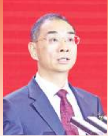
福州市委副书记、市长吴贤德致辞