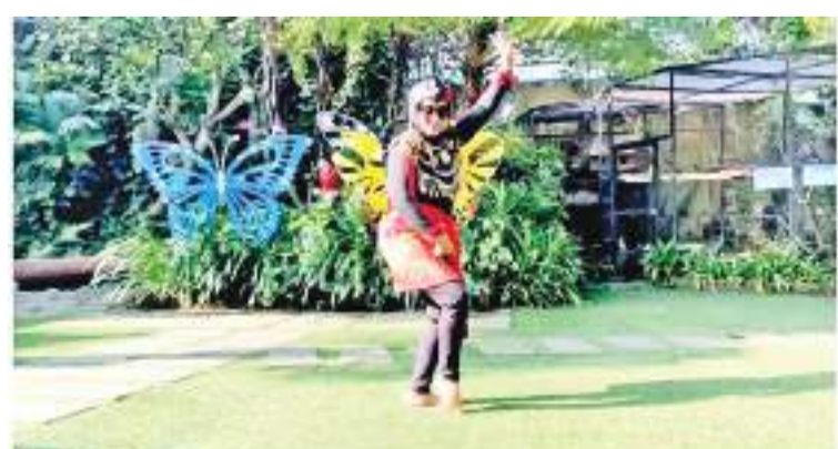
Tari Kuda Lumping Ennie di ultah ke 15 SSSC