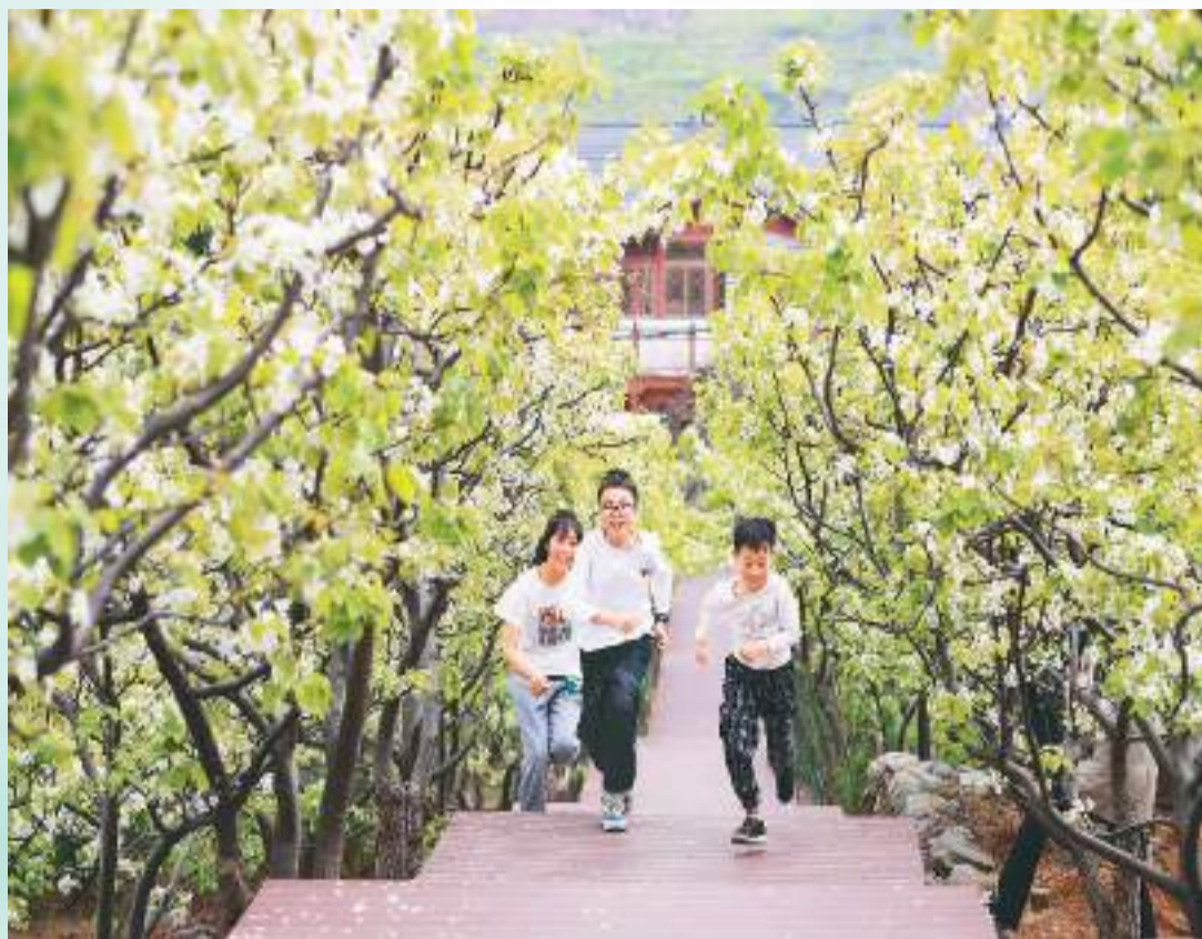
临近清明，人们纷纷走到户外踏青赏花，享受春光之美。图为3月31日，游客在四川省成都市彭州市葛仙山镇照玉村游览。

清明节是寄托哀思的传统节日，也是一次宣泄哀伤的机会。中医认为，清明祭扫，怀旧悼亡，有