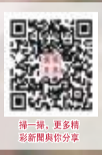
掃一掃，更多精彩新聞與您分享