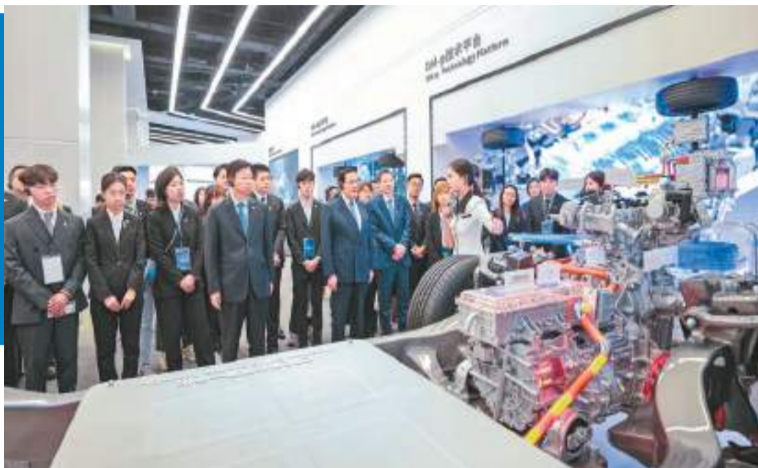
▲馬英九一行昨日在比亞迪參觀。

馬英九發言時表示，孫中山先生是他一生崇拜的偶像。來到孫中山先生的故居，內心非常地感動，他還提到，自己看到中山先生的故居非常的簡樸，