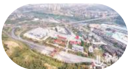
永春東農產品冷鏈物流園昨日投入試運營

泉州網訊(通訊員楊世陽 陳亦楨 融媒體記者吳麗嬌 文/圖)3月31日上午,廈福泉國家綜合貨運樞紐補鏈強鏈重點項目、全省首個全面建成並投營的貨運樞紐項目——永春東農產品冷鏈物流園正式投入試運營。