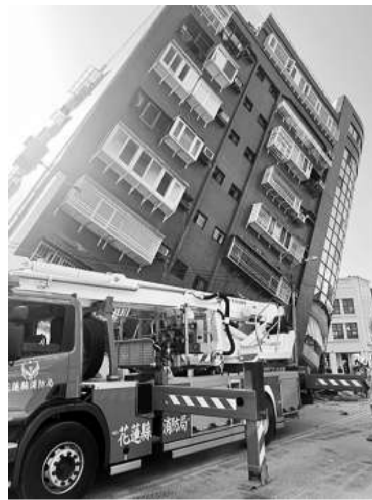
强震发生时,花莲县北滨街一栋公寓民宅大幅度倾斜(4月3日摄)。

中国地震台网正式测定:4月3日7时58分,在台湾花莲县海域(北纬23.81度,东经121.74度)发生7.3级地震,震源深度12公里。