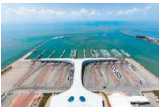
湛江徐聞港。資料圖片

接下來湛江將以《規劃》為藍本，加快制定特色型現代海洋城市建設的「湛江方案」，鑰定階段目標，細化項目任務，不斷讓規劃所刻畫的美好藍圖在湛江大地上早日變成施工圖、實景圖。