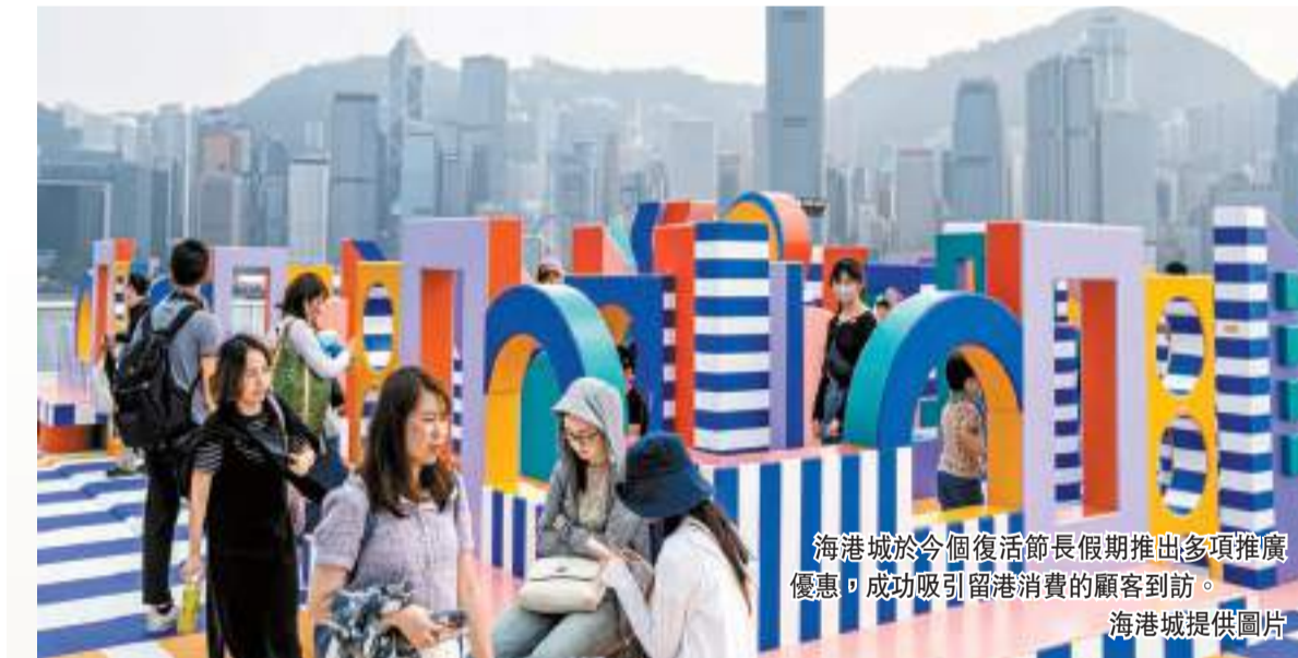
海港城於今個復活節長假期推出多項推廣優惠，成功吸引留港消費的顧客到訪。

程鼎一：強化香港旅遊樞紐角色 旅發局總幹事程鼎一說，去年全年訪港旅客錄得3400萬人次，高於去年初估計的2580萬人次，旅客滿意度為8.7分，也高於疫情前。他提及今年1、2月的過夜旅客佔總旅客量約一半，平均留港時間為3.2晚，人均消費5800元，與2019年的平均水平相若。他稱旅發局今年工作目標包括鞏固香港作為國際城市的地位、強化旅遊樞紐角色等。他亦表示局方在宣傳方面做了很多工作，例如去年共邀請2000名「網紅」來港，說好香港故事。