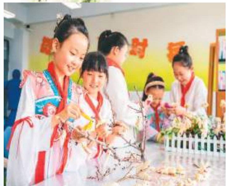
4月1日，内蒙古自治区呼和浩特市玉泉区通顺街小学的学生学习制作当地清明时节特色面塑“寒燕”。