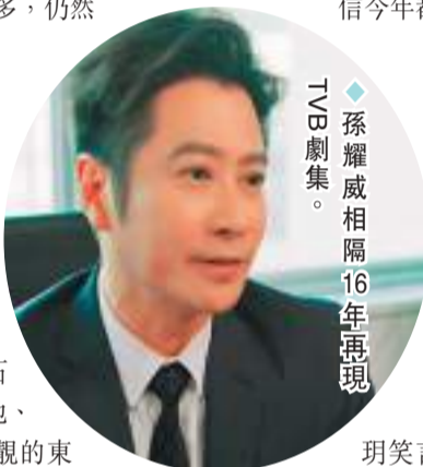
◆孫耀威相視16年再現TVB劇集。

另外，薇薇表示近日正忙於籌備其實驗室鑽石生意，計劃5月將啟劬網店，7月將在香港、內地、新加坡及印尼開設實體店。她笑言因自己喜歡靚的東