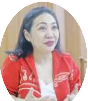
丹妮·普拉科萨接受中新社“东西问”独家专访。