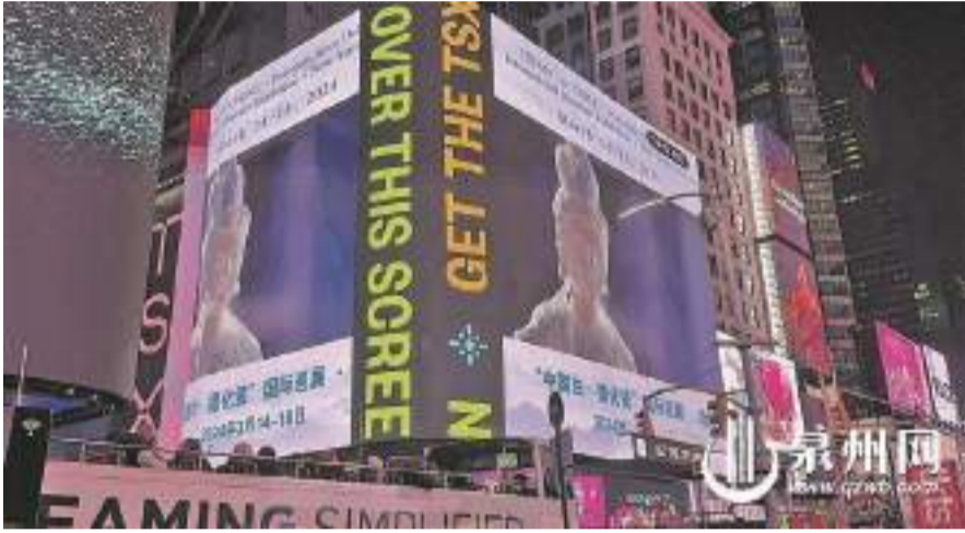
德化白瓷宣傳片亮相紐約時報廣場戶外大屏