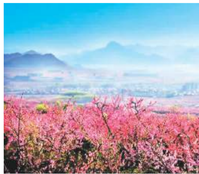
图为盛放的平谷桃花海。