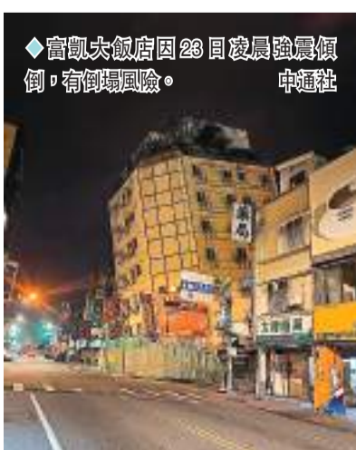
◆富順大飯店因23日凌晨強震傾倒，有倒塌風險。

香港文匯報訊 據中社社報道，台灣花蓮縣23日凌晨起地震不斷，截至23日早上已發生83次地震，其中規模最大的2起分別為6.3級及6級，全台有感。這也是4月3日花蓮強震後的最大餘震。餘震造成其中的2棟危樓，富順大飯店和統帥大樓發生倒塌和傾斜。所幸2棟大樓內已無人居住，也沒有人受傷。目前各地暫未傳出有人員傷亡事件。花蓮縣政府23日早上5時緊急發布消息稱，因地震不斷，全縣23日停班停課。