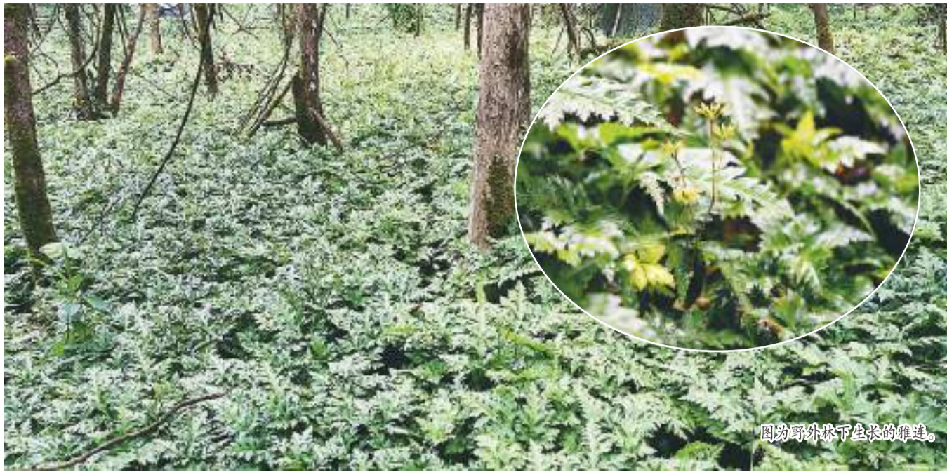
图为野外林下生长的雅连。