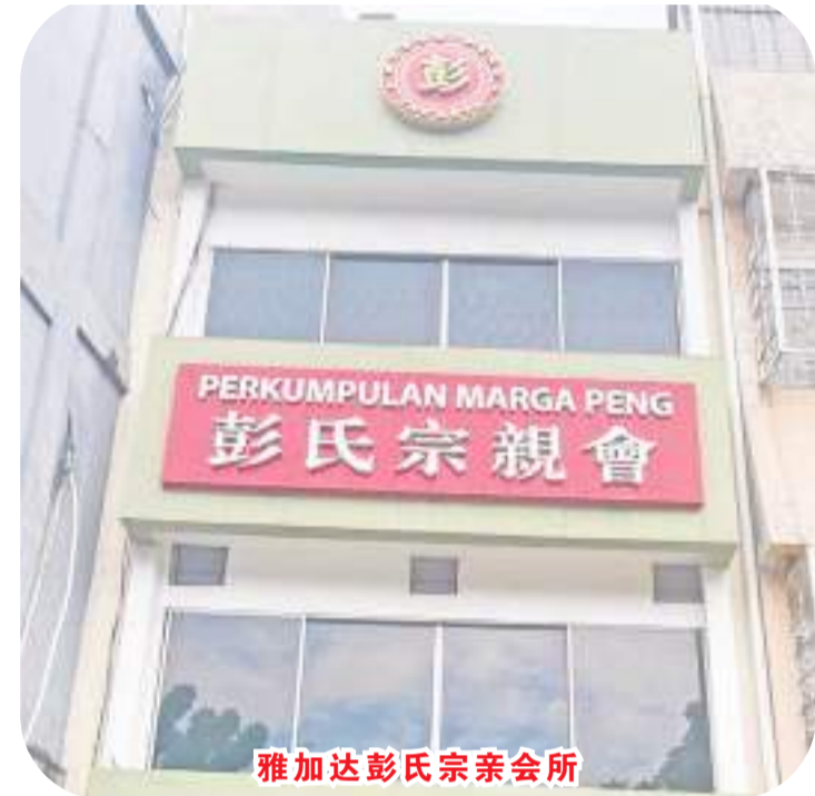
雅加达彭氏宗亲会所