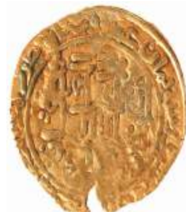
成吉思汗金币。

当地政府还积极实施“邛窑传播计划”，与景德镇陶瓷大学、四川大学、北京工业大学等高校合作开展考古研究、文创开发、产学研基地建设，通过现代创意激活邛窑历史文化资源，让邛窑遗址真正“活”起来，在新时代焕发异彩。