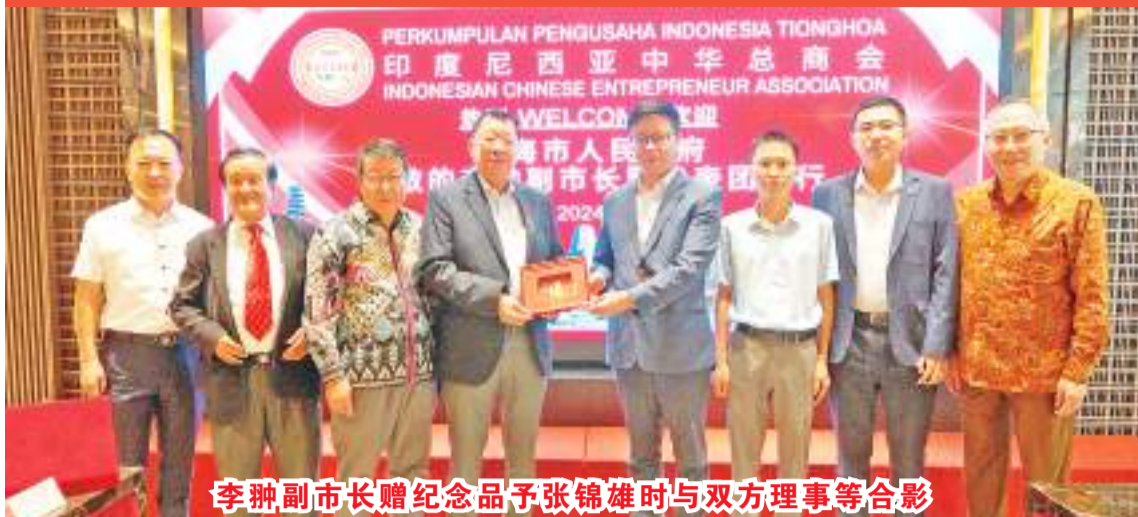
李翀副市长赠纪念品予张锦雄时与双方理事等合影