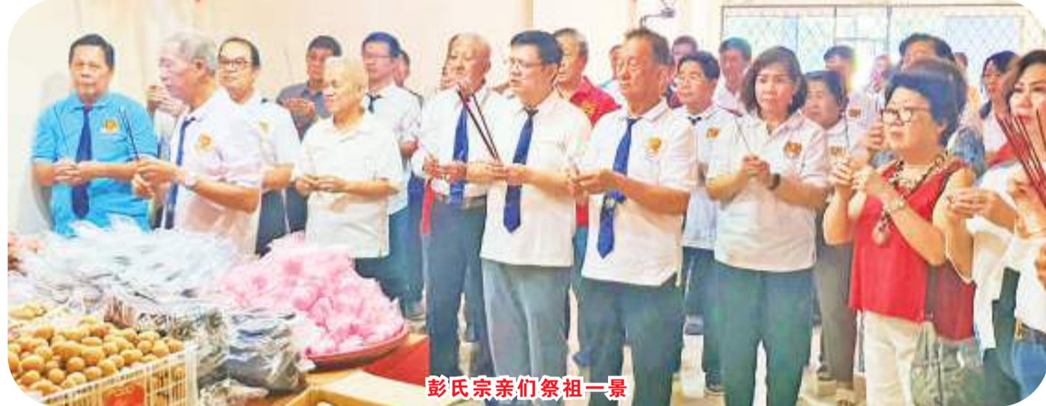
彭氏宗亲们祭祖一景