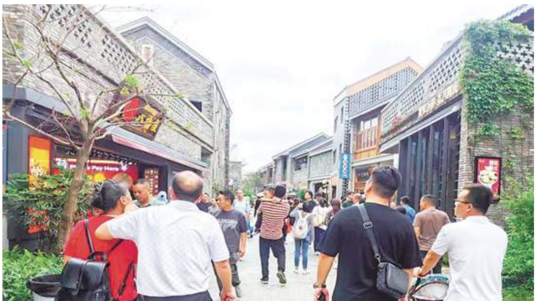
清明節假期，江門古勞水鄉吸引了眾多遊客。