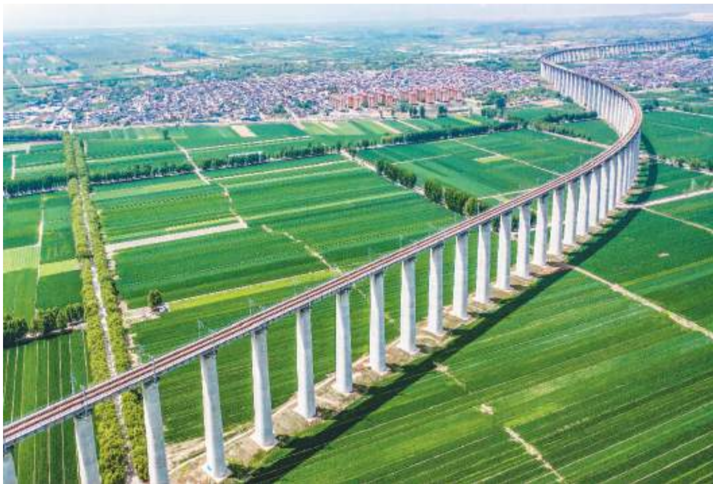
近年来，山西省运城市严格落实粮食安全责任制，通过加强高标准农田建设、示范开展“吨半粮田”创建、扩大水浇地面积等措施，持续提升粮食综合生产能力。图为天津市境内黄汾万亩粮食优质高产高效示范基地麦田美景。