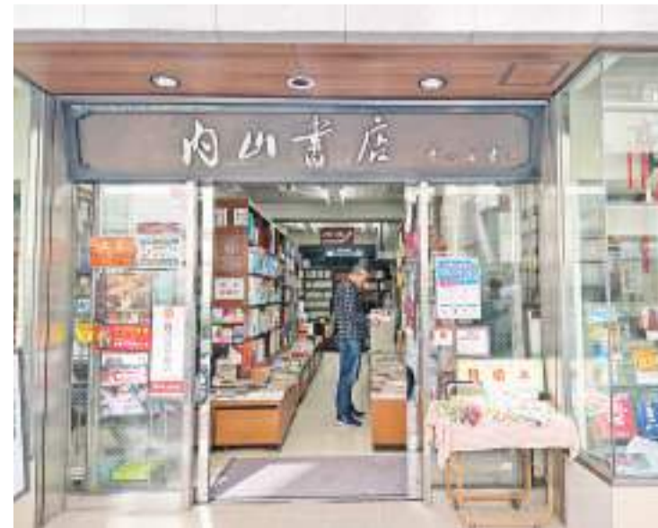
日本东京内山书店外景。

在东京内山书店内，寻找汉语学习书籍的日本读者，会与正好来购书的中国读者不期而遇，他们彼此之间会互相交换购书的心得和一些书籍的信息。这种读者之间互动的故事在内山书店时有发生。我希望内山书店能成为两国民间交流的空间。