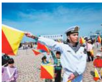
◆4月21日，青島港三號碼頭，小朋友在參加國際信號旗語體驗。