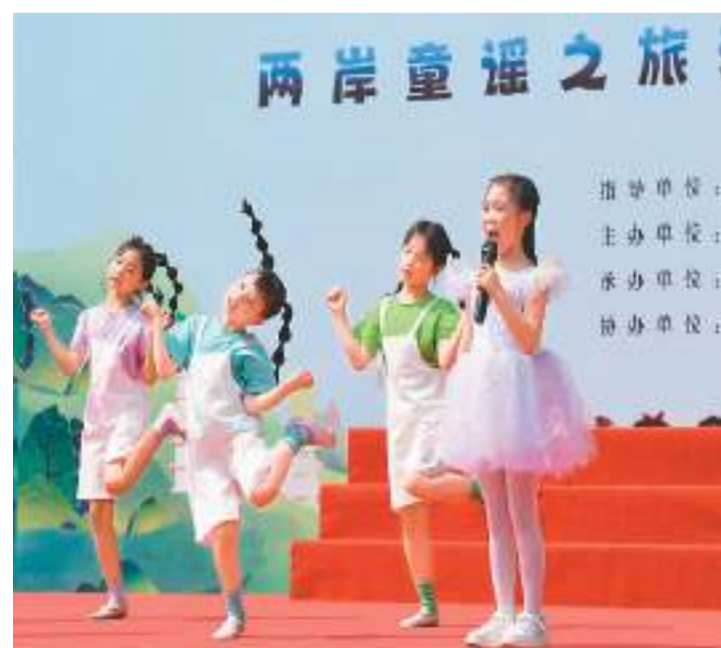
近日，由福建福州海峡两岸和平统一促进会发起的两岸童谣之旅主题活动来到福州市洪塘中心小学，两岸小学生通过童谣传唱、诗歌朗诵、非遗表演等形式同台表演，传承乡音，增进彼此的了解与友谊。图为小学生在表演闽南方言童谣。

在福建，像“台陆通”这样便利台胞的数字化服务平台越来越多，“闽政通”“e福州”等APP都已上线了台胞服务专区，提供台湾资讯、政策解读、资质审批、证照申领、e公证等服务，各类网上办事大厅或微信公众号也推出了台青创业就业补贴申报等网上窗口。