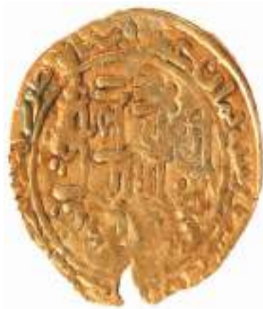
成吉思汗金币。

当地政府还积极实施“邛窑传播计划”，与景德镇陶瓷大学、四川大学、北京工业大学等高校合作开展考古研究、文创开发、产学研基地建设，通过现代创意激活邛窑历史文化资源，让邛窑遗址真正“活”起来，在新时代焕发异彩。