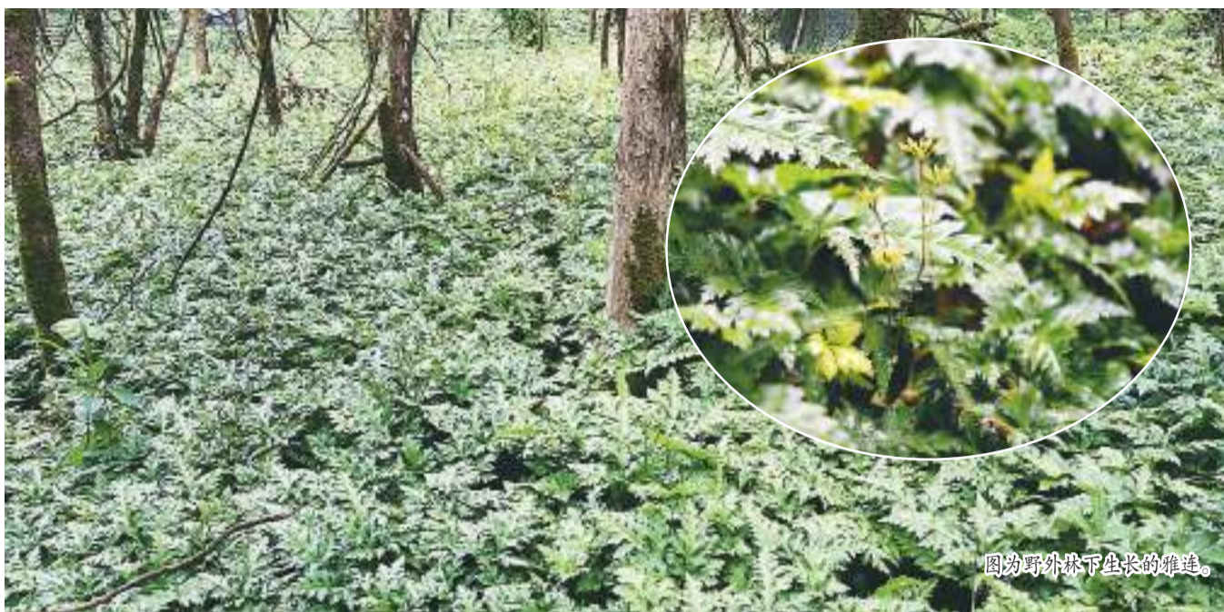
图为野外林下生长的雅连。