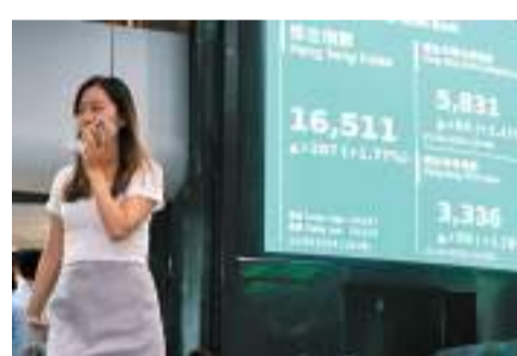
◆科技股22日表現強勢，帶動恒指收市升287點，大市全日成交1,049.25億元。中新社

22日科技股強勢，恒指三大成交股份依次為騰訊、美團及阿里巴巴；騰訊收報320.4元，