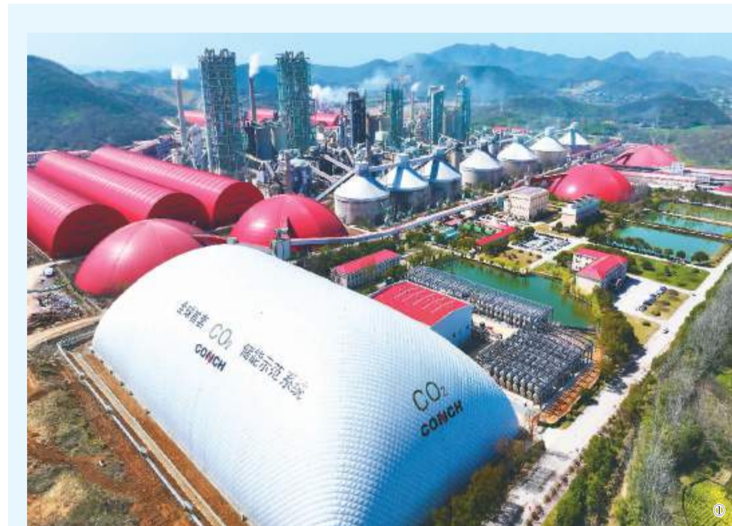
图①：3月21日，在安徽省芜湖市繁昌区繁阳镇库山村，航拍国家新型储能试点示范项目——海螺集团10MW/80MWh二氧化碳储能项目。