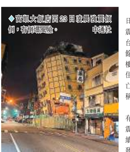
◆富順大飯店因23日凌晨強震傾倒，有倒塌風險。

香港文匯報訊 據中社社報道，台灣花蓮縣23日凌晨起地震不斷，截至23日早上已發生83次地震，其中規模最大的2起分別為6.3級及6級，全台有感。這也是4月3日花蓮強震後的最大餘震。餘震造成其中的2棟危樓，富順大飯店和統帥大樓發生倒塌和傾斜。所幸2棟大樓內已無人居住，也沒有人受傷。目前各地暫未傳出有人員傷亡事件。花蓮縣政府23日早上5時緊急發布消息稱，因地震不斷，全縣23日停班停課。