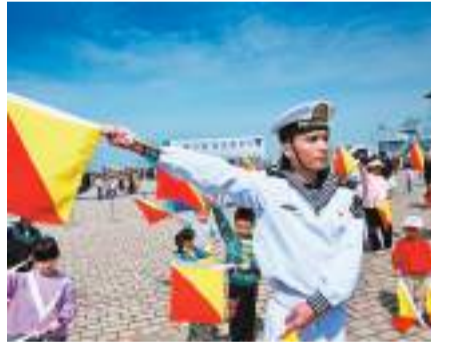
◆4月21日，青島港三號碼頭，小朋友在參加國際信號旗語體驗。

開放期間，戰艦將全部懸掛象徵海軍最高禮儀的滿旗，開放甲板、榮譽室等場所，組織旗語展示、輕武器分解結合、損害管制操演、戰傷救護等訓練科目。國防知識进校园、參觀見學、快閃打卡、遠洋食品品嚐等相關活動也將視情況展開。其中，唐山艦、廈門艦、日照艦、溫州艦四現役艦，是首次到命名城市靠泊開放。