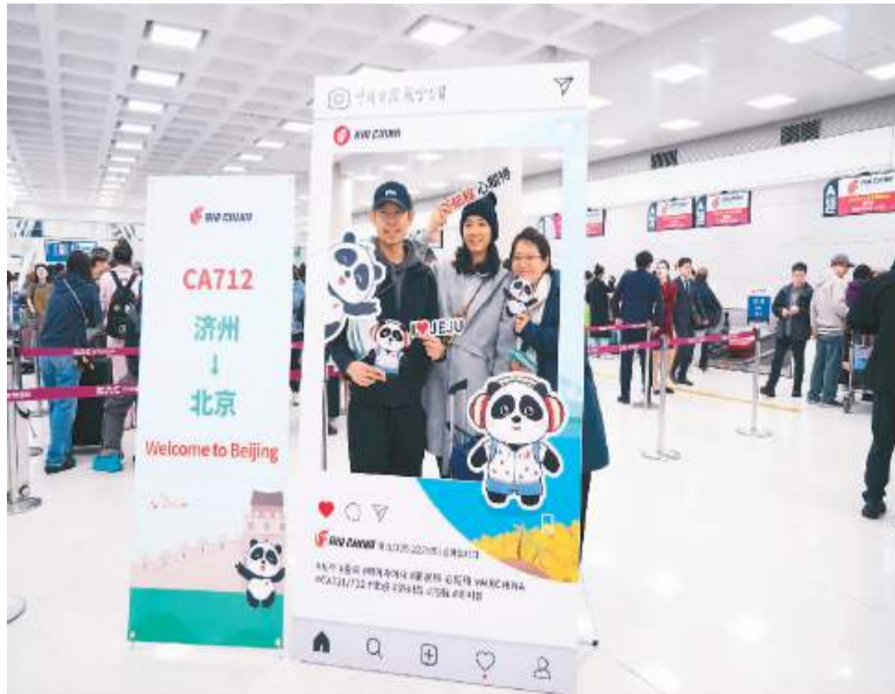
▲中国国际航空北京—济南航线复航仪式3月31日在韩国济州国际机场举行。此次复航的“北京—济南”航线由波音737-800机型执飞，每周三、四、日运营。图为乘坐国航济南至北京航线的旅客在值机区拍照留念。

“批量‘上新’的国际航线，说明中国经济和世界经济相互关联、相互依赖程度持续提升，中国经济国际化程度越来越高。”商务部国