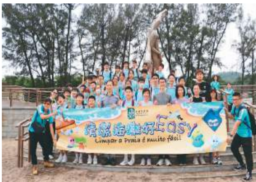
图为“清洁海滩好Easy”活动现场。

4月22日是世界地球日。为响应这一国际环保节日，澳门各界连日来推出一系列活动关注生态环保，推动回收减废措施，宣传低碳生活理念，共促绿色产业发展，为春日濠江带来十足“绿”意。