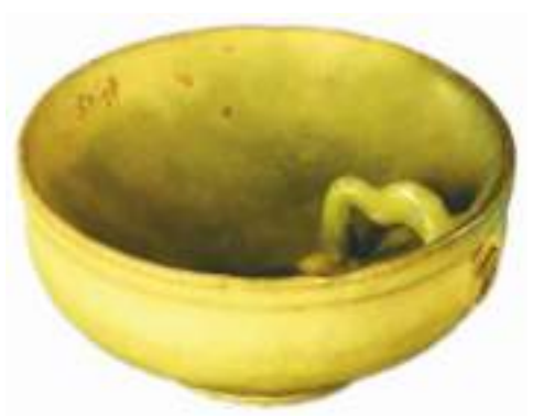
宋代乳浊浅绿釉省油灯。

北部平地作坊区紧临中心山体北侧，主要分布着从五代到宋末的作坊、储泥池、陈腐池、釉缸、水井等各类遗迹。其中，5号作坊是一处修筑较为规整的作坊建筑，多以废弃匣钵砌墙、铺地、筑井、造池，根据这些遗迹可以推断出从胎土制备到器表施釉的制瓷流程。