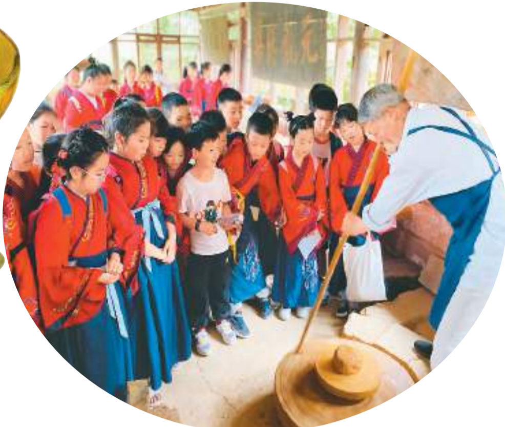
邛崃市西街小学学生在邛窑国家考古遗址公园观看窑工演示古法拉坯。