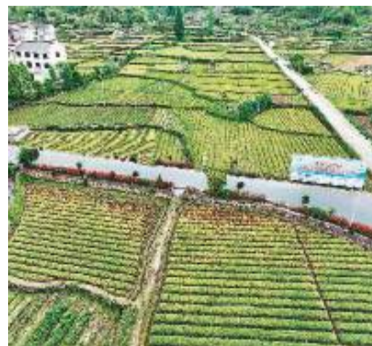
近年来，为壮大特色产业，浙江省东阳市马宅镇因地制宜发展元胡(延胡索)中药材种植产业，引领“共同富裕工坊”建设，统一规划生产基地，推进中药材追溯体系建设，从源头提升中药质量，打通“公司+合作社+农户”的共富路径。图为元胡(延胡索)中药材GAP标准化示范基地全景。