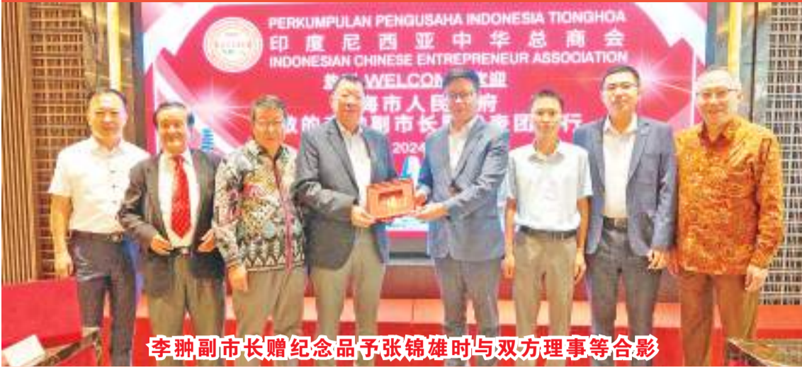
李翀副市长赠纪念品予张锦雄时与双方理事等合影