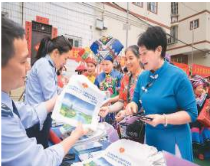
第33次全国税收宣传月期间,国家税务总局南宁市良庆区税务局组建工作小组,走进广西南宁金象社区开展税费宣传活动,集中解读个人所得税缴纳流程、查询缴费凭证方式等内容,让税费优惠政策更好惠及人民群众。图为税务工作人员为社区居民讲解税费政策。

一季度,各级财政部门在严格落实过紧日子要求、严控一般性支出的同时,继续加大对重点领域支出的保障力度,全国一般公共预算支出规模近7万亿元。