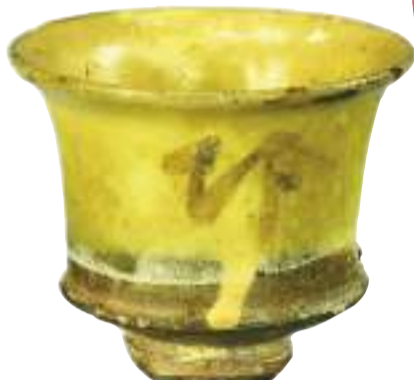
唐代青瓷褐彩“临邛”文字杯。