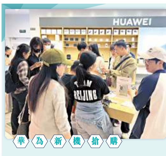
華為旗下最新Pura 70系列的Pura 70、Pura 70 Pro+兩款機型，於22日上午正式開售，在北京多家華為門店引發搶購熱潮。據悉，相較於華為Mate 60系列，Pura 70系列在衛星通信功能更進一步，不僅可以用衛星發送文字消息，還支持圖片的發送和接收，成為科技愛好者競相追逐的焦點。

繼特斯拉周日在包括中國在內的多個市場降價後，理想汽車22日宣布，下調旗下L7等多款車型售價，降價幅度高達1.8萬至3萬元，其中純電車MEGA降價3萬至52.98萬元。