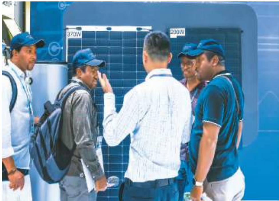
图为参展商在第135届广交会上向非洲采购商介绍太阳能电池组件展品。

专家表示，中非传统友谊深厚，合作成果丰硕。在共建“一带一路”倡议和中非合作论坛等机制平台下，中非在高科技、新能源、新产业领域交流日益密切。中国发展新质生产力，同非洲发展战略深度对接，为中非合作打开新空间、注入新动能。