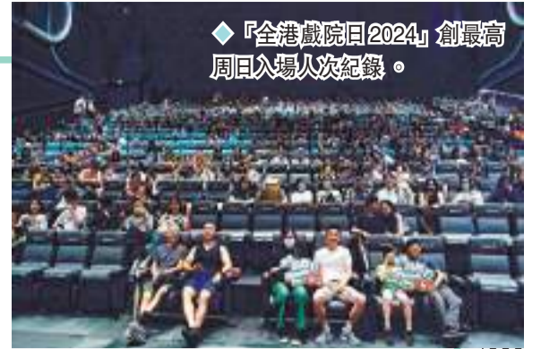
「全港戲院日2024」創最高周日入場人次紀錄。

望不同階層市民感受到，香港戲院業的優質服務和先進放映技術，並可定期到戲院欣賞電影。在此衷心感謝全港觀眾在天氣欠佳下，仍然熱烈支持活動，以及再次多謝香港電影發展基金及創意香港的資助，參與活動的片商、發行商及幫忙拍宣傳片的演藝界台前幕後，以及所有業界的鼎力支持。」 香港電影發展局主席王英偉博士表示：「今次活動再次獲得破紀錄佳績，實在令人振奮，亦十分高興看見21日市面熱鬧，行街、睇戲、食飯情況再現。香港電影發展基金未來會繼續推出措施，支援並推動戲院業及電影業蓬勃發展。」