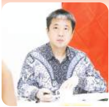
【本报讯】据来自中国驻泗水总领馆消息：2024年

4月22日，驻泗水总领事徐永举行领区媒体吹风会，围绕中国经济社会发展、构建人类命运共同体、中印尼关系等议题介绍情况，并回答记者提问。印尼安塔拉国家通讯社东爪哇分社、《爪哇邮报》《罗盘报》、泗水之声电台、“迪斯威”媒体集团、《千岛日报》《国际日报》等媒体负责人和记者参加。