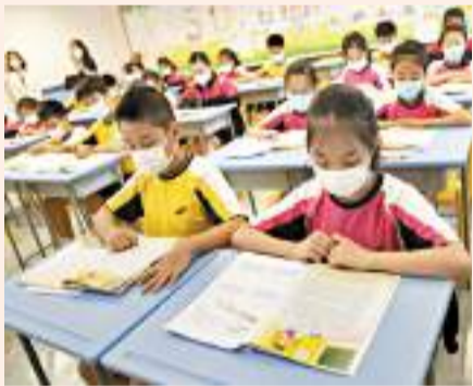
◆幼童處在大腦發育的最重要階段。圖為幼童在課堂上學習語言。