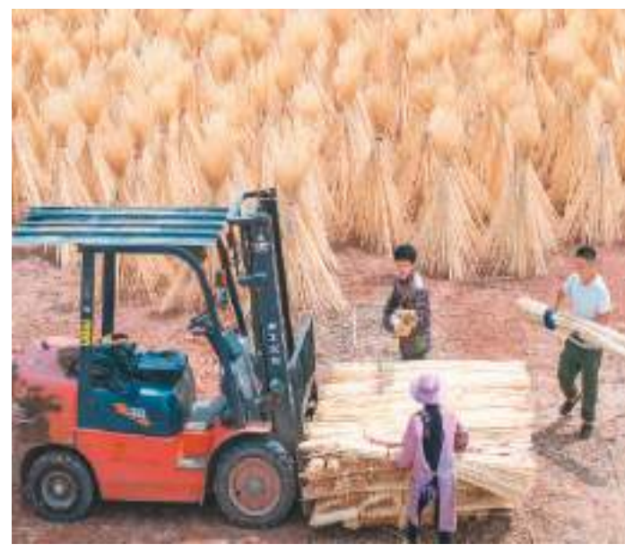
江西省抚州市南丰县白舍镇利用丰富的毛竹资源优势,大力推进毛竹种植和精深加工,做好“竹”文章,拓展农民增收渠道。图为在白舍镇瑛溪村,村民将晾晒好的竹丝装车。

目前,国开行在有关部门指导下为保障性住房建设提供“融制、融智、融资”服务,持续加大配售型保障性住房融资支持力度。