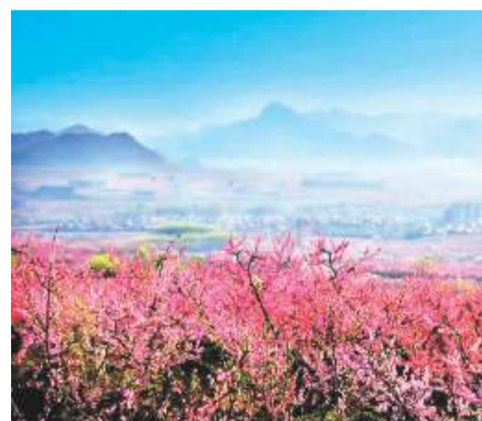
图为盛开的平谷桃花。