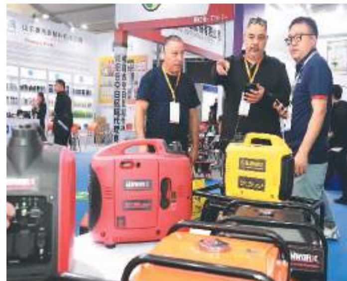
4月20日至22日,第8届中国义乌国际五金电器博览会在浙江义乌国际博览中心举行。本届博览会突出专业化、国际化、信息化特色,共设国际标准展位2100余个,展览面积6万平方米,产品涵盖五金工具、建筑五金、电子电器、劳保用品等行业的1500多个品类。图为采购商在博览会上参观咨询。

截至2024年3月31日,已有48.1万家企业在平台公开323.6万项标准,涵盖539.4万种产品,总访问量4.9亿次。