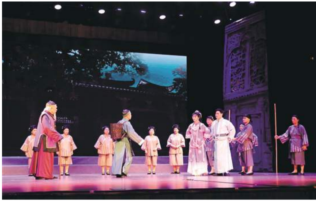
新編粵劇《碉樓》再度精彩上演，收獲歡迎和好評。

為促進粵港澳大灣區文化交流合作，慶祝澳門回歸25周年，共同推動中華文脈傳承，豐富群眾的文化生活，4月9日晚，江門、澳門兩地充分發揮地緣相近、人緣相親的優勢特點，聯合舉辦“珠水相連·粵韻同聲”澳門江門（開平）粵劇曲藝交流活動暨新編粵劇《碉樓》演出。活動由中共江門市委宣傳部、中共開平市委宣傳部、澳門開平同鄉聯誼會主辦，開平市文化廣電旅遊體育局、開平市文學藝術界聯合會承辦。 活動當天，“珠水相連·粵韻同聲”澳門