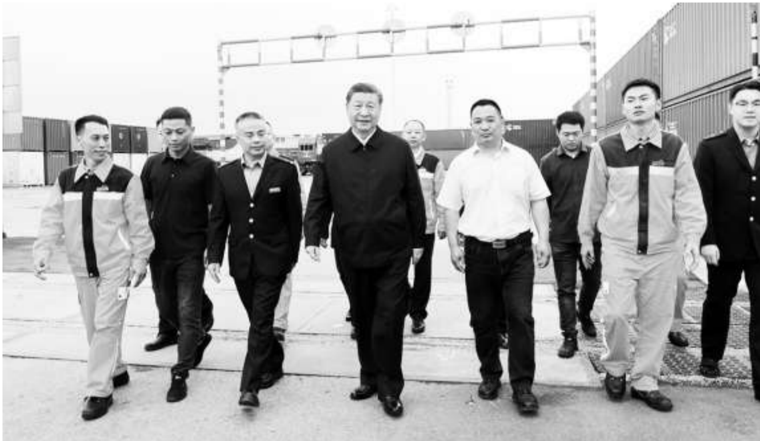
4月22日至23日,中共中央总书记、国家主席、中央军委主席习近平在重庆市考察调研。这是4月22日,习近平在重庆国际物流枢纽园区考察。

新华社北京4月23日电 4月22日至23日,中共中央总书记、国家主席、中央军委主席习近平先后来到重庆国际物流枢纽园区、九龙坡区谢家湾街道民主村社区、重庆市数字化城市运行和治理中心,了解当地加快建设西部陆海新通道、实施城市更新和保障改善民生、提高城市治理现代化水平等情况。