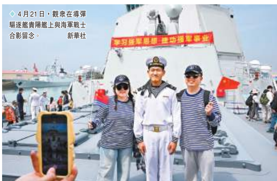
◆4月21日，觀眾在導彈驅逐艦貴陽艦上與海軍戰士合影留念。

香港文匯報訊（綜合央視新聞、新華社和記者胡臥龍報道）4月23日是中國人民解放軍海軍成立75周年紀念日，作為慶祝人民海軍成立75周年系列活動的重要一環，青島港三號碼頭、青島奧帆中心碼頭六艘艦艇向公眾開放。對於青島市民和軍迷來說，每年的海軍艦艇開放日就是他們的節日。開放日現場活動豐富多彩，市民不僅可以看到先進的艦艇裝備，還覺得更有安全感了。跟着海軍官兵學習表演旗語，購買海軍文創產品……對外開放的艦艇設有的「打卡點蓋章留念區」，備受市民追捧，很多人為了集齊六艘軍艦的郵戳，費了不少力氣。