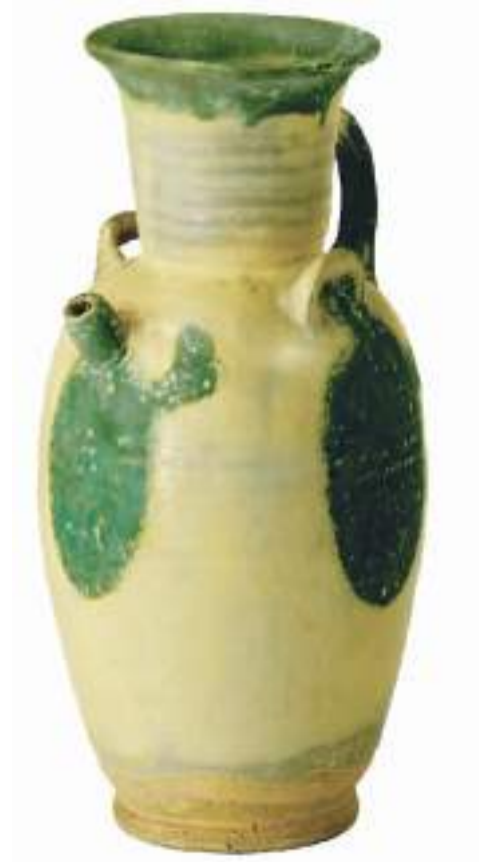
唐代青瓷绿彩斑纹执壶。