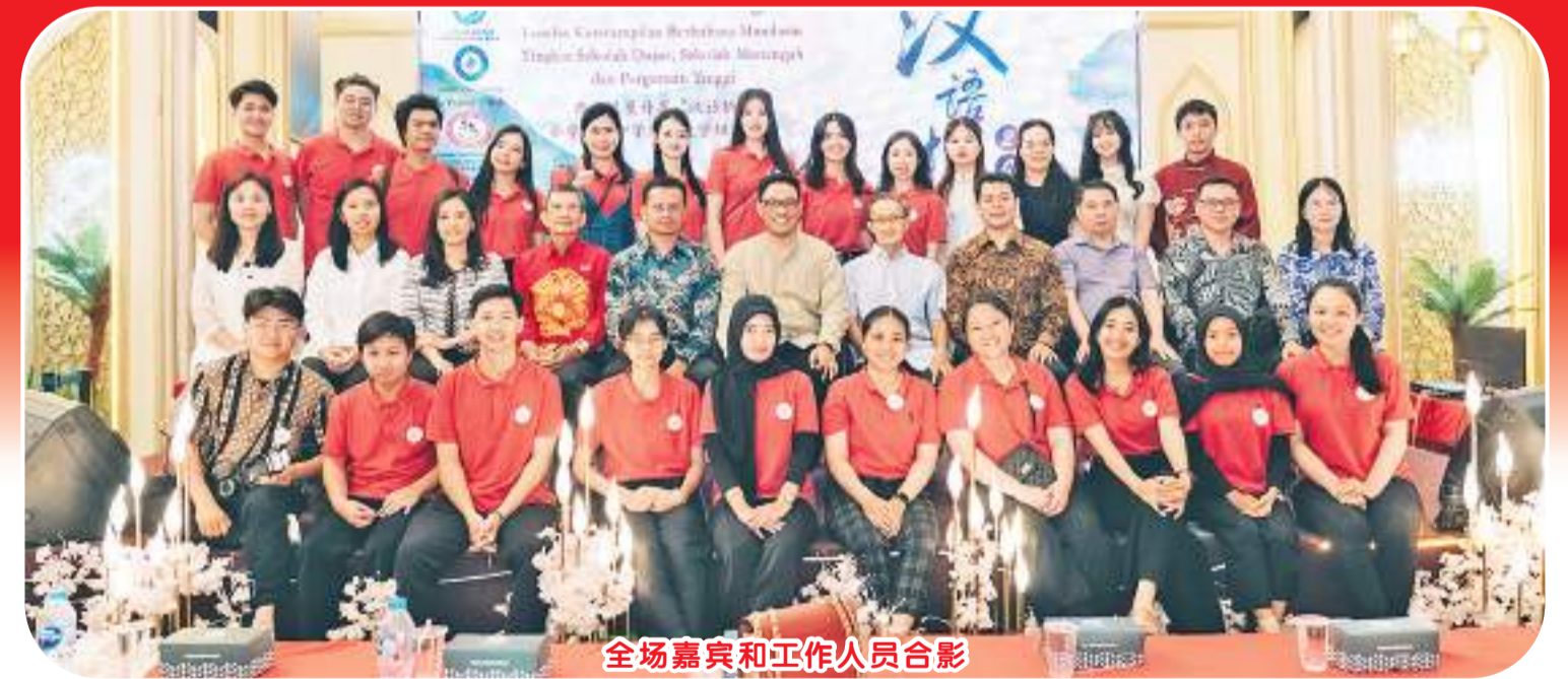
全场嘉宾和工作人员合影

经过紧张的前期准备，印尼西加里曼丹省“汉语桥”中文比赛西加省选拔赛决赛于 2024 年 4 月 21 日在坤甸市举办。这一年度赛事成为西加省中文教育机构检验中文教学成果、学生才艺水平及加强彼此交流的平台，得到来自坤甸、山口洋、孟加影、道房、绑嘉、喃吧哇等县市的大中小学热烈响应。各学校共派出约 120 名选手参赛，其中 34 名选手脱颖而出，挺进决赛。 本次决赛分现场演讲、即兴问答和中华才艺三个比拼环节。大、中、小学生组的演讲比赛主题分别为“天下一家”、“追梦中文、不负韶华”和“快乐中文”。选手们中文发音标准，语言流畅，面对现场即兴提问自信大方、对答如流，展现出优秀的理