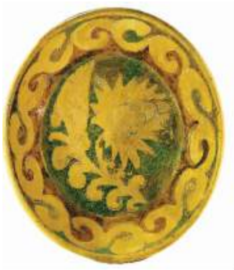
唐代青瓷褐彩双彩刻划莲花纹大盆。