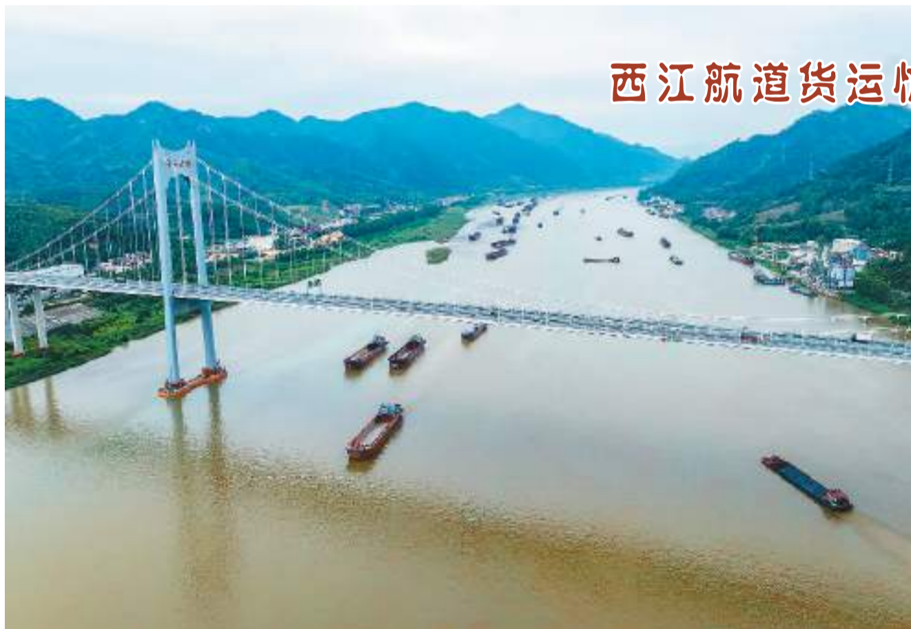
连日来，西江航道广东肇庆段迎来繁忙的航运季。装载各类货物的船舶在江面上往来穿梭，有序航行。图为西江航道广东省肇庆市德庆县悦城镇河段。