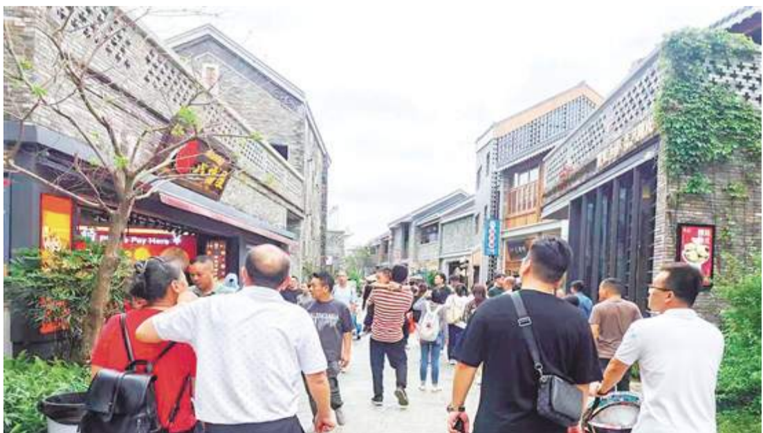
清明節假期，江門古勞水鄉吸引了眾多遊客。