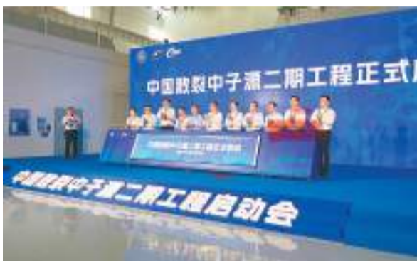
▲中國散裂中子源二期工程正式啟動建設。 ▶中國散裂中子源裝置航拍圖。

香港文匯報訊（記者 劉凝哲 東莞報導）中國散裂中子源二期工程正式啟動，「超級顯微鏡」即將上新。香港文匯報記者從中國科學院高能物理研究所3月30日在廣東東莞舉行國家重大科技基礎設施中國散裂中子源二期工程啟動會上獲悉，二期工程建成後，裝置研究能力將大幅提升，實驗精度和效率將顯著提高，能夠為探索科學前沿，解決國家重大需求和產業發展中的關鍵科學問題提供科技利器。