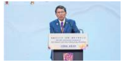
香港中文大學(深圳)理事長、香港中文大學校長段崇智教授

3月17日，在建校十周年大會前夕，教育部黨組書記、部長懷進鵬來到香港中文大學(深圳)考察並在大學舉行了“高水平教育對外交流合作座談會”，充分肯定大學十年磨一劍取得的豐碩辦學成果，肯定探索出國際化創新型人才培養的獨特路徑，形成辦學特色和辦學