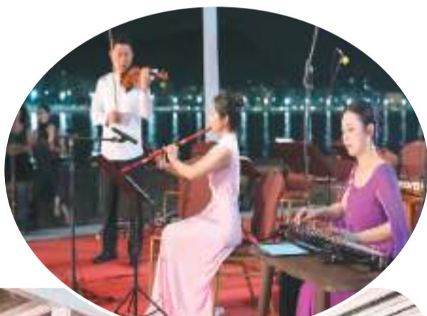
乐团成员演奏中国乐器。