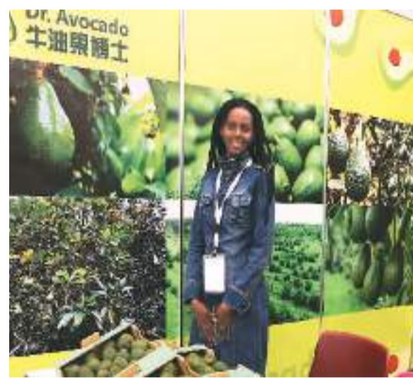
第二届国际非洲牛油果大会现场。

中国对进口鳄梨实施准入制度。只有在海关总署允许输华名录内的国家或地区才能对华出口鳄梨，相关国家或地区名录可在海关总署动植物检疫司网站查询，该名录动态更新。 鲜食鳄梨应来自经海关总署批准注册的产地、果园和包装厂。中国对进口鳄梨的境外国家或地区的产地、果园和包装厂实施注册登记管理，由境外国家或地区主管当局向海关总署推荐注册，海关总署对外公布名单。名单可在海关总署动植物检疫司网站查询，该名录动态更新。 鲜食鳄梨及境外生产企业等信息应符合海关总署网站公布的警示通报等其他要求。 此外，贵公司在与境外相关进口鳄梨厂商签订贸易合同或协议前，应向审批机构提出申请并取得《中华人民共和国进境动植物检疫许可证》。检疫许可证自签发之日起一年内有效，不得买卖或转让；有效期内可在许可数量范围内分批进口，