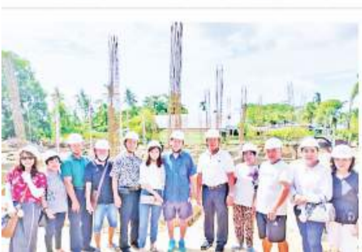
南中校友理事会组团回乡视察建校工程纪实

家人占多数。这里的华裔生活习惯都源于着的中华传统习俗,平时的交流都是用客家话,所致学习华文的年轻学生们都感觉到汉语很有亲切感和成就感。年轻的一代为了充实自己,日后跟着社会发展的脚步能够立足于社会,所致,今日在家乡学习华文的学生,凸显出日益增长的趋势,而学校的教育水平也一