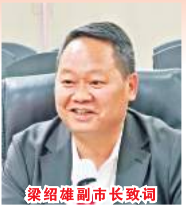
梁绍雄副市长致词