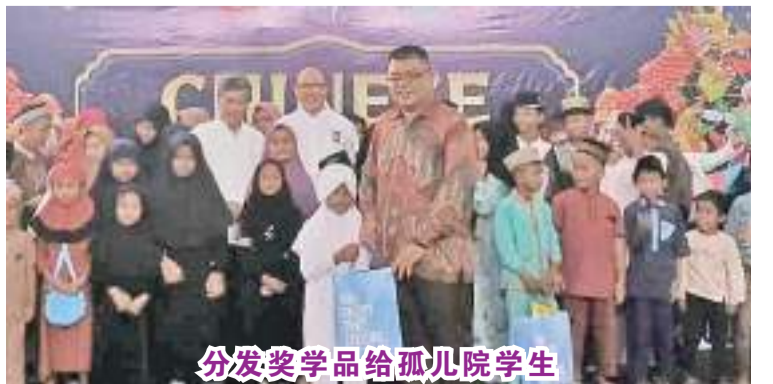
分发奖学金给孤儿院学生