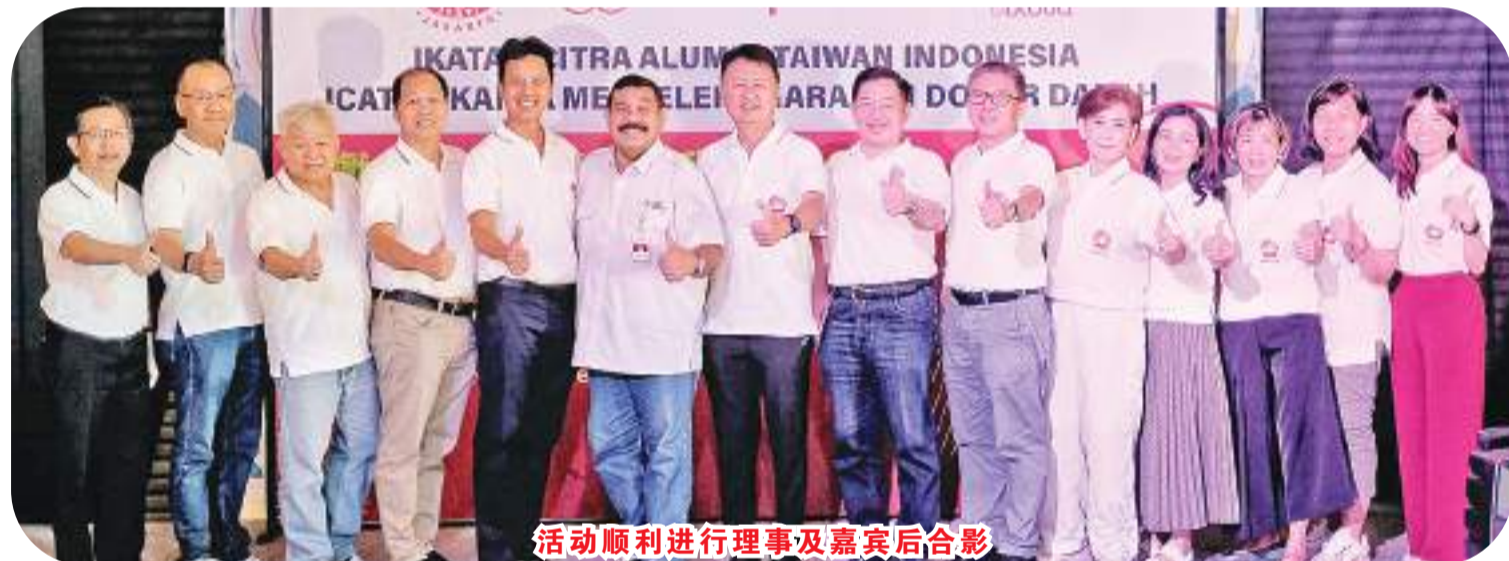
活动顺利进行理事及嘉宾后合影