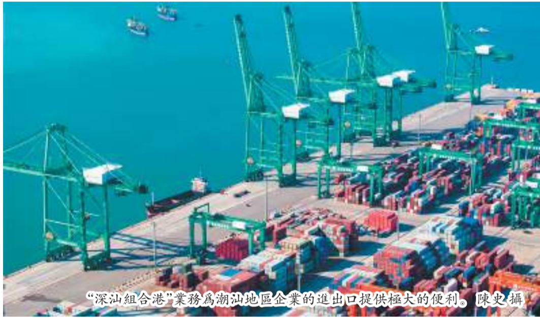
“深汕組合港”業務為潮汕地區企業的進出口提供極大的便利。

【汕頭日報訊】流通體系對商貿發展具有基礎性、戰略性、先導性作用。在上月召開的全市商貿高質量發展大會上，汕頭市發布了《汕頭市商貿賦能高質量發展十條》，其中提出支持口岸港口發展，拓展國際班輪航線。記者從汕頭招商港口了解到，今年汕頭招商港口將發揮好汕頭鐵路進港、綜保區、深水港、央企全球網絡和“僑”資源的“組合”優勢，加快東南沿海區域強港建設，為促進商貿高質量發展貢獻港口力量。