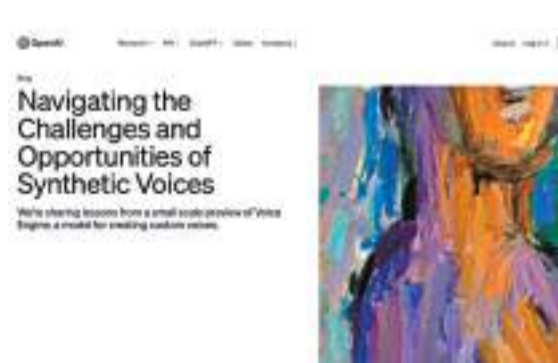
◆OpenAI在官網發布Voice Engine內容。

AI技術專家普遍擔憂在選舉關鍵時期，便捷的AI語音技術可能生成大量假信息。OpenAI表示，公司在測試階段已實施安全措施，包括利用數碼標籤追蹤新工具生成的語音來源，並主動監控現有使用者的使用方式。