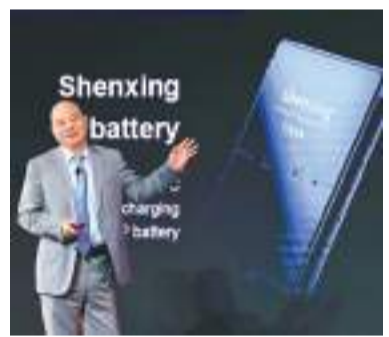
◆寧德時代創始人曾毓群稱，美指中國電池存在安全風險「像個笑話」。

香港文匯報訊 針對美國渲染使用中國企業電池會帶來所謂「安全風險」，全球最大電動車電池製造商寧德時代的創始人兼董事長曾毓群接受《金融時報》採訪時回應稱，美方這類指控好比說中餐菜單暗中監視食客，「就像一個笑話」。