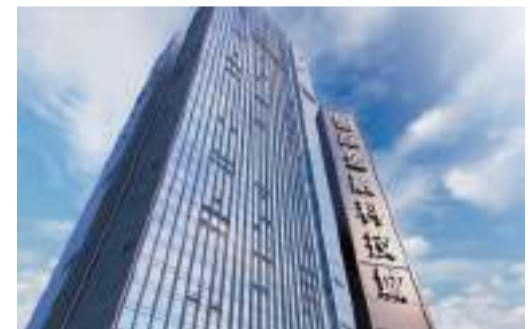
福田金科雙園。

【香港商報訊】記者姚志東報道：作為金融專業樓宇，深圳市福田金科雙園從成立第一年就納稅過億，園區企業深耕金融科技細分領域，不斷提升稅收貢獻，開園至今，園區企業累計實現營收超260億元（人民幣，下同）、累計貢獻稅收超10億元。