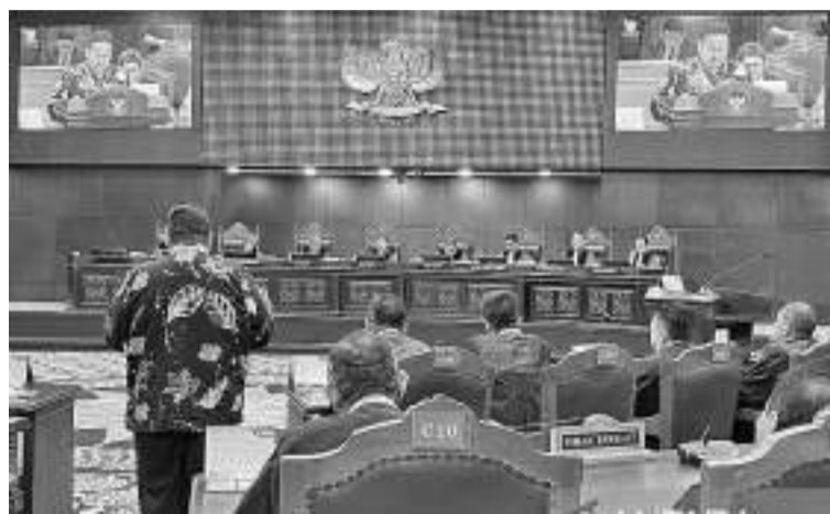
普选监督机构主席拉赫玛德说，总统没有违反中立性

此前在竞选期间，社区纷纷流传有关粮储局大米包装印有第二序号正副总统候选人图像的片段，这些原本是粮储局为稳定粮食供应和价格(SPHP)的大米。