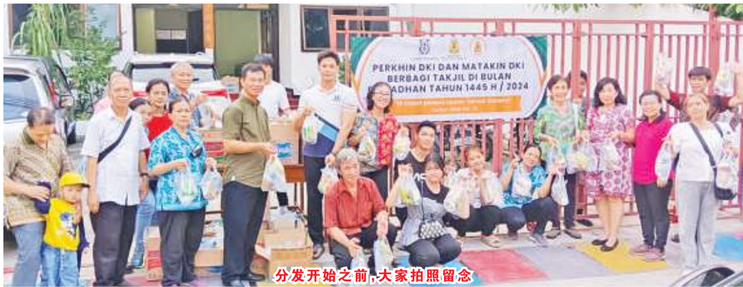
分发开始之前,大家拍照留念

2024年3月24日(星期日)下午5点,印尼孔教最高理事会雅加达西区分会妇女会邀约忠恕基金会一起分发甜食(Takjil)给邻里周围的村民,让他们开斋时享用。自忠恕基金会成立以