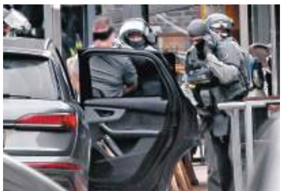
◆一名男子被特警部隊逮捕。

香港文匯報訊 荷蘭東部城鎮埃德市中心3月30日發生多名人質遭挾持事件，一名男子攜帶武器和爆炸物，在市中心一間酒吧挾持4人，並威脅引爆炸彈。挾持事件持續約數小時後結束，所有人質安全獲釋，疑犯被捕。當地警方稱，沒有跡象顯示事件出於恐怖主義動機。