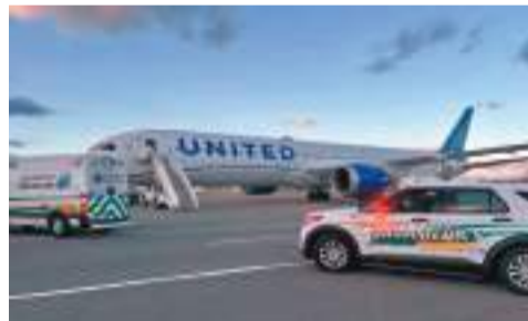
◆多名乘客因機身劇烈震盪而受傷，被送往附近醫院治療。

香港文匯報訊 據美國廣播公司(ABC)報道，美國聯合航空公司一架由以色列特拉維夫飛往新澤西州紐瓦克國際機場的航班，3月29日因降落時遇上「風切變」(wind shear)，即風向突然出現變化，客機改飛往紐約斯圖爾特國際機場，最終安全降落，多名乘客因機身劇烈震盪而受傷，被送往附近醫院治療。