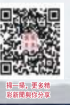
掃二維碼 看新聞 更多詳情 請新聞與你分享

鑒於閏秒給高科技領域帶來諸多不便等情況,2022年第27屆國際計量大會決定,最遲不晚於2035年廢除閏秒,改為閏分,即允許國際原子時與世界時的時刻相差在1分鐘以內。阿格紐則希望他的研究能促使國際計量大會考慮更早廢除閏秒。(王鑫方)