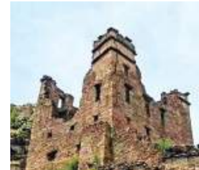
◆2023年西藏推進完成125個國家和自治區文物保護專項補助資金項目，圖為傑頓珠宗遺址。

此外，2023年西藏積極申請國家和自治區專項資金1億多元，實施14個文物安全防護項目。2023年西藏還公布了布達拉宮、羅布林卡、大昭寺、扎什倫布寺等5個全國重點文物保護單位保護規劃和79處自治區級文物保護單位兩級劃定。同時，完成了全區575處寺廟寺觀可移動文物登記建檔和59處名碑名刻文物遷移推薦和資源摸底調研。