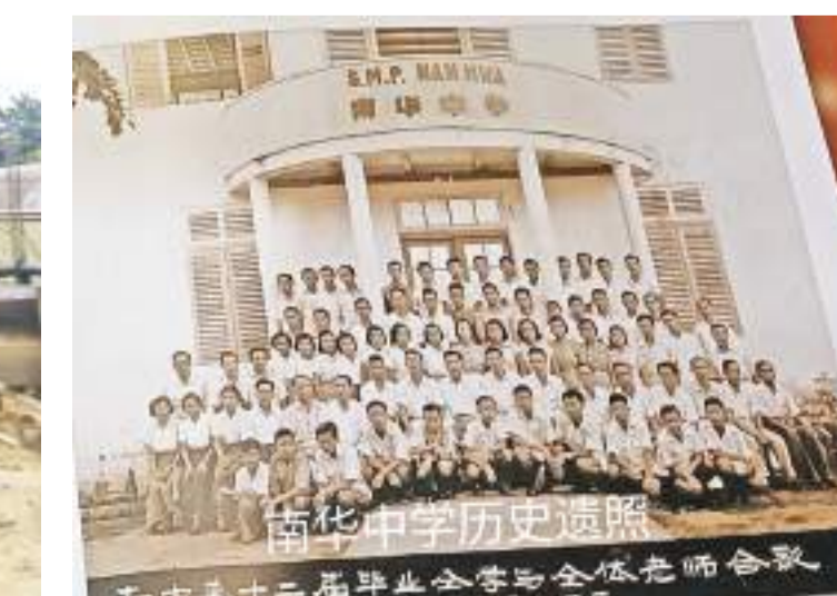
南华中学历史大照