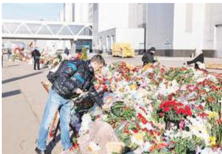
3月28日,人们在俄罗斯首都莫斯科近郊“克罗库斯城”音乐厅前摆放鲜花和玩具,悼念遇难者。