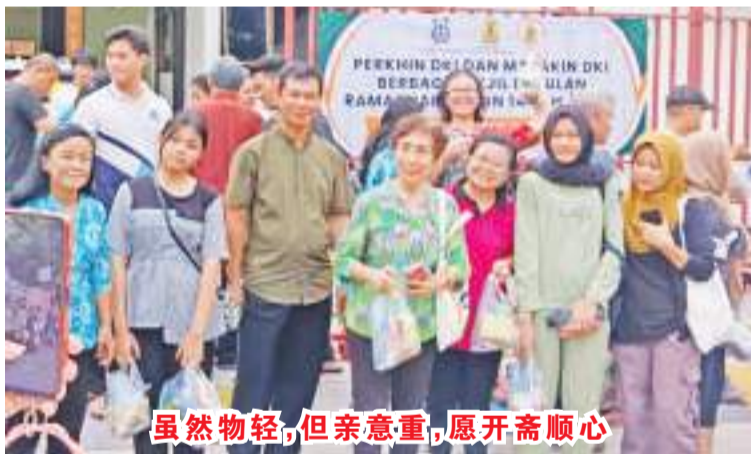
虽然物轻,但心意重,愿开斋顺心