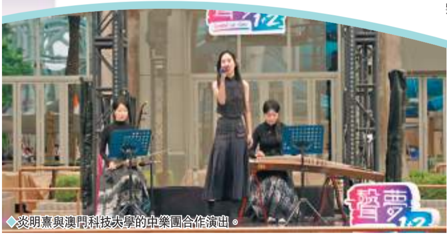
◆炎明熹與澳門科技大學的中樂團合作演出。