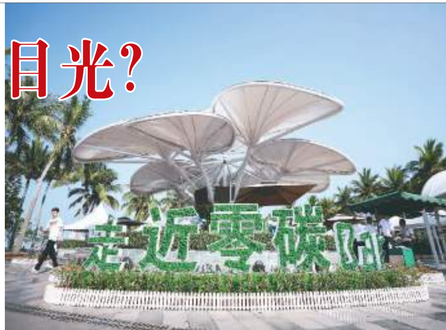
图为博鳌东屿岛零碳休息区。

仍是全球经济增长和经济全球化的重要支撑，尤其是作为亚洲最大经济体，中国经济高质量发展为全球带来暖意、注入信心。