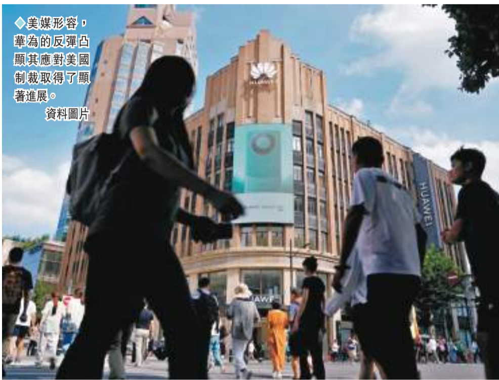
◆美媒形容，華為的反彈凸顯其應對美國制裁取得了顯著進展。 資料圖片

香港文匯報訊 美國國務院3月29日宣布向香港特區政府多名官員實施簽證限制，成為美國近年不斷打壓中國的最新例證。不過多間美媒指出，美國對華打壓政策往往適得其反，例如許多被美國極力圍堵的企業反而迅速發展，中國電訊商華為便是其中之一。華為為3月29日公布2023年業績，淨利潤達到870億元人民幣，按年增長144.4%。彭博通訊社與《華爾街日報》都形容，華為的反彈凸顯其應對美國制裁取得了顯著進展。