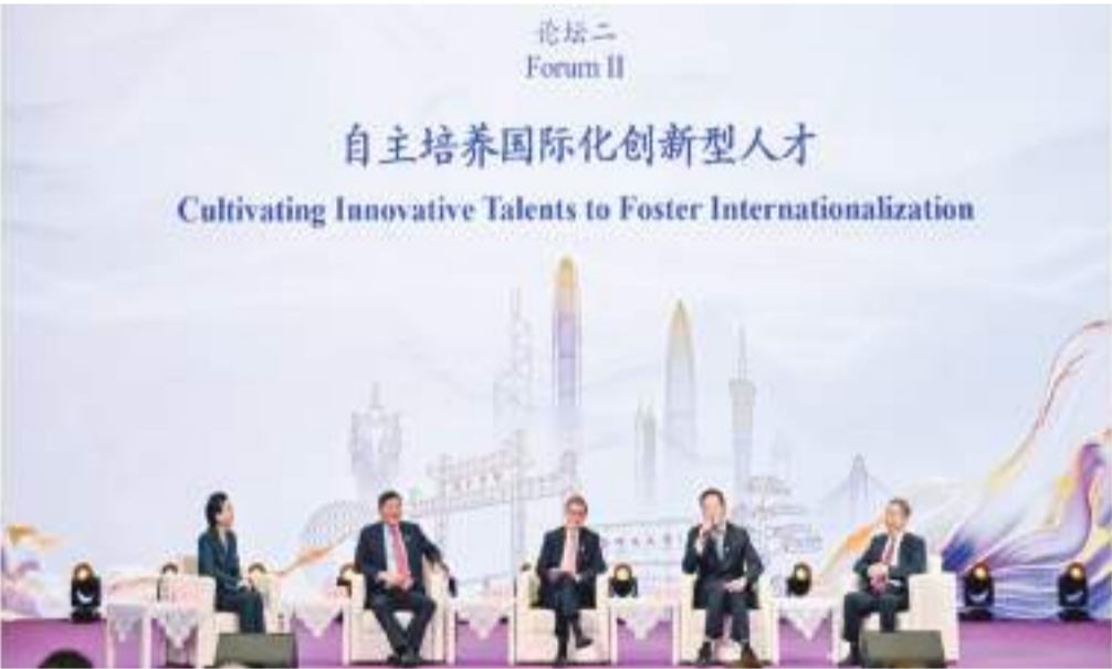
“新理念、新視野、新格局”發展論壇