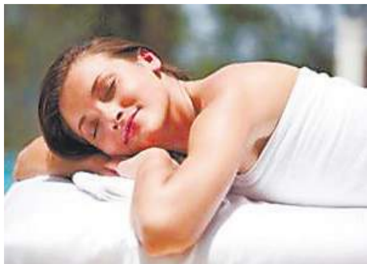
此對三伏天吹空調造成的頸部或腰腿疼痛，以及受寒引起的關節痛，可採取熱鹽敷。

熱鹽敷 主要是針對虛寒性疼痛。受寒或平時體質較弱，受風、寒、濕等刺激後，經絡不通，可表現為身體多個部位和器官的疼痛，尤其是頸肩腰腿痛。中醫認為，五味中的“咸”味入腎經，“腎主骨”。炒熱的鹽除了具有溫熱的作用，還在於它入腎經，因