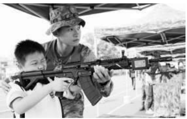
3月30日，中国人民解放军驻香港部队组织香港青少年爱国主义和国防教育军事体验营活动。图为香港青少年进行轻武器体验。