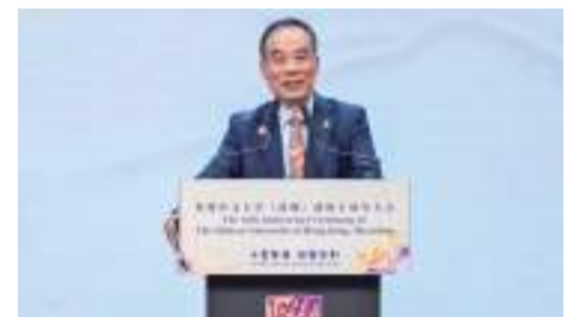
香港中文大學(深圳)校長徐揚生教授