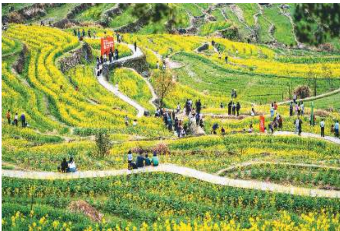
近年来，浙江省绍兴市上虞区岭南乡依托优质自然资源，打造“石上东澄”共富工坊，大力发展乡村旅游，促进乡村全面振兴。图为游客在岭南乡东澄村千年梯田观赏油菜花。