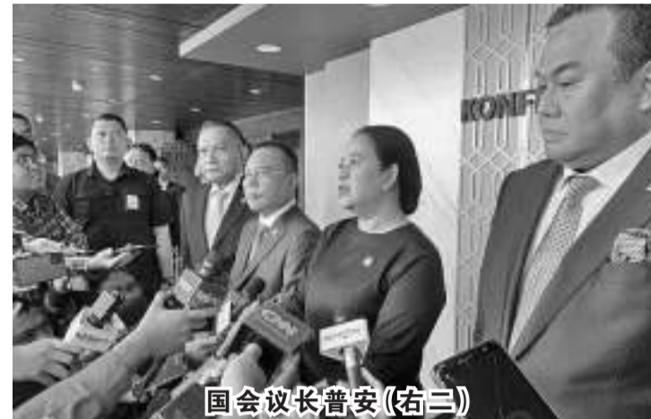
国会议长普安(右二)

【本报讯】3月28日，国会议长普安坦言，我没有向国会的印尼斗争民主党派系发出任何指示，要求他们在2024年选举中的舞弊行为提出国会调查权。