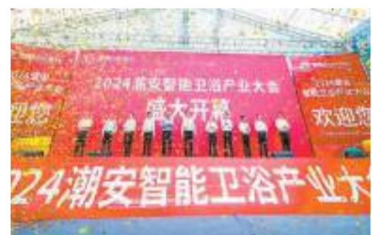
潮安智能衛浴產業大會開幕式。

【香港商報訊】記者肖輝輝 通訊員安宣報道：3月26日，主題為「智造賦能·新質生活」的2024潮安智能衛浴產業大會潮安區開幕。