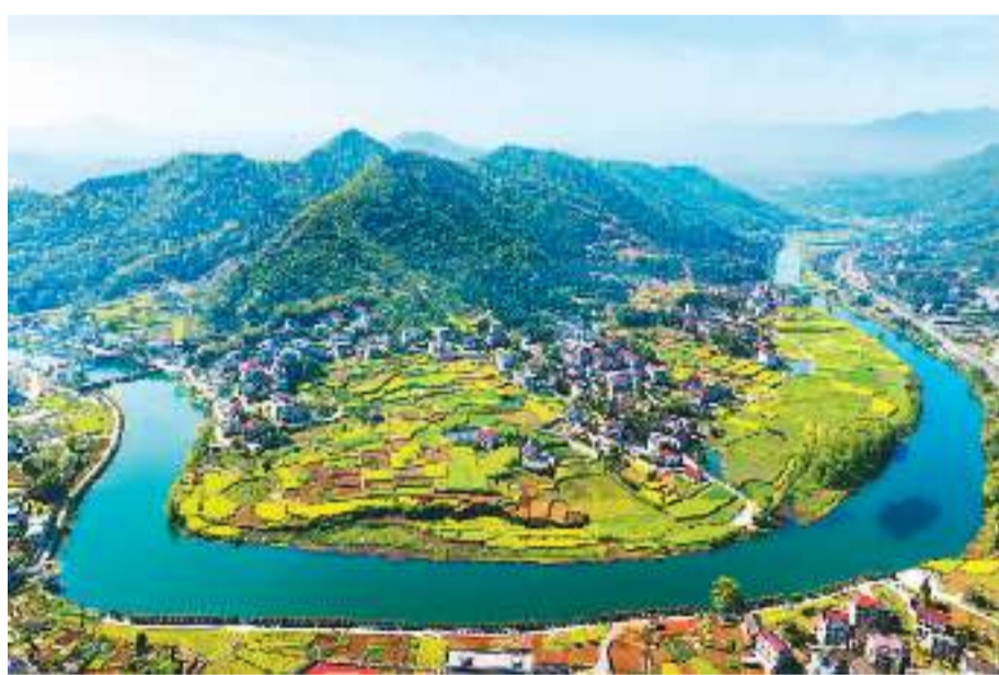
3月29日,湖南省娄底市娄星区水洞底镇,蜿蜒的河流与多彩的田园、绵延的群山相互映衬,美不胜收。

会议强调,国有企业是中国特色社会主义的重要物质基础和政治基础。要坚持和加强党的领导,深入学习贯彻习近平新时代中国特色社会主义思想,扎实履行使命,坚决做到“两个维护”。要统筹发展和安全,增强忧患意识,坚持底线思维,坚决防范化解风险,以高水平安全保障高质量发展。要纵深推进全面从严治党,把严的基调、严的措施、严的氛围长期坚持下去,加强对“一把手”和领导班子的监督,持续保持惩治腐败高压态势,深化以案促改、以案促治,坚决铲除腐败滋生的土壤和条件。要认真贯彻新时代党的组织路线,加强领导班子建设、干部人才队伍建设和基层党组织建设。要综合用好巡视成果,深入研究解决巡视发现的共性和深层次问题,进一步健全制度机制,促进标本兼治。