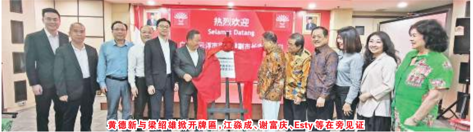
黄德新与梁绍雄副市长李冠周等在牌匾前合影

区分会将为中国企业在印尼的投资提力所能及的帮助。祝梁绍雄副市长一行在印尼访问取得圆满成功。”