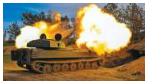
◆俄烏衝突持續，圖為烏軍向俄軍發炮。

澤連斯基接受《華盛頓郵報》訪問時則說，美國的援烏方案正因意見分歧而在國會受阻，若得不到美國承諾的軍事援助，烏軍將不得不「一步一步地」撤退。他說，「若沒有美國支持，就意味我們沒有空防、愛國者導彈、電子戰干擾器、155毫米口徑炮彈。這代表我們要走向頭路，一步一步地撤退。」