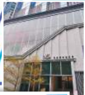
◆ 香港藝發局黃竹坑新址。

由黃竹坑至田灣大約半小時的腳程，非常適宜舉辦導賞團引領遊客觀賞。這裏的當代畫廊呈現着世界各地最新的藝術成果，可以說是其他地方難得一見的「饕餮盛宴」，而工廈外牆又布滿藝術塗鴉，無論畫廊內外，都有值得駐足欣賞的藝術元素。隨着香港藝發局新址落戶南區，現下正是一個不錯時機，以協助統籌及宣傳南區新興藝術文化。早前曾舉辦過的「南區藝術日」，或可以擴展為「南區藝術節」，通過畫廊之間的統籌合作，以一連串展覽、表演、講座、工作坊等活動充實藝術節，並提供交通接駁等配套服務與優惠，推動「小眾風景」變為新的藝術盛事。