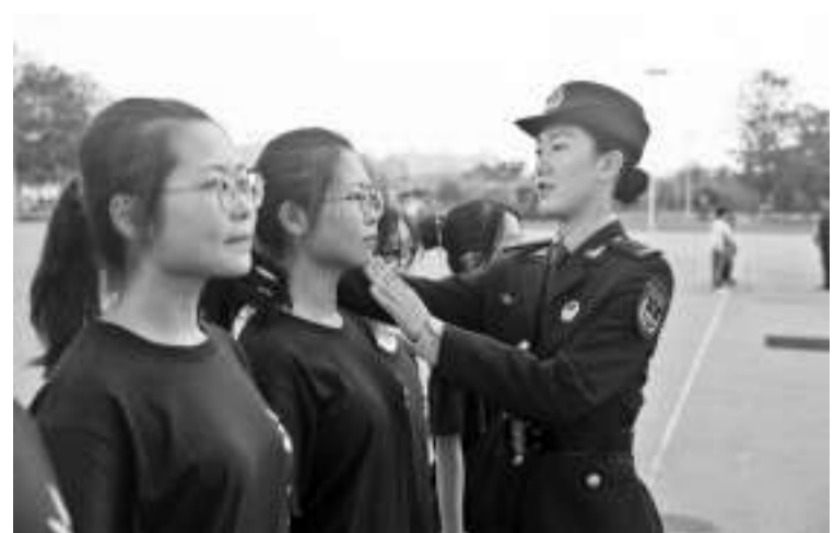
3月30日，中国人民解放军驻香港部队组织香港青少年爱国主义和国防教育军事体验营活动。图为香港青少年进行队列训练。