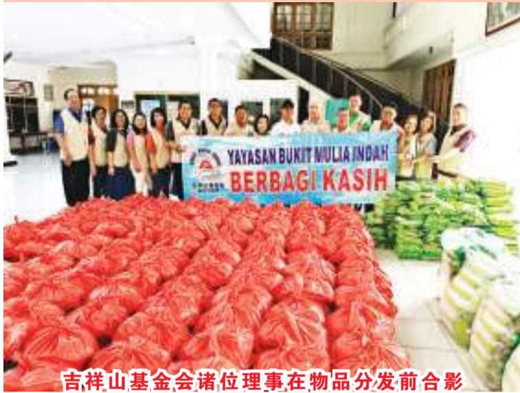
吉祥山基金会诸位理事在物品分发前合影