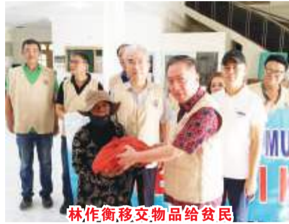
林作衡移交物品给贫民