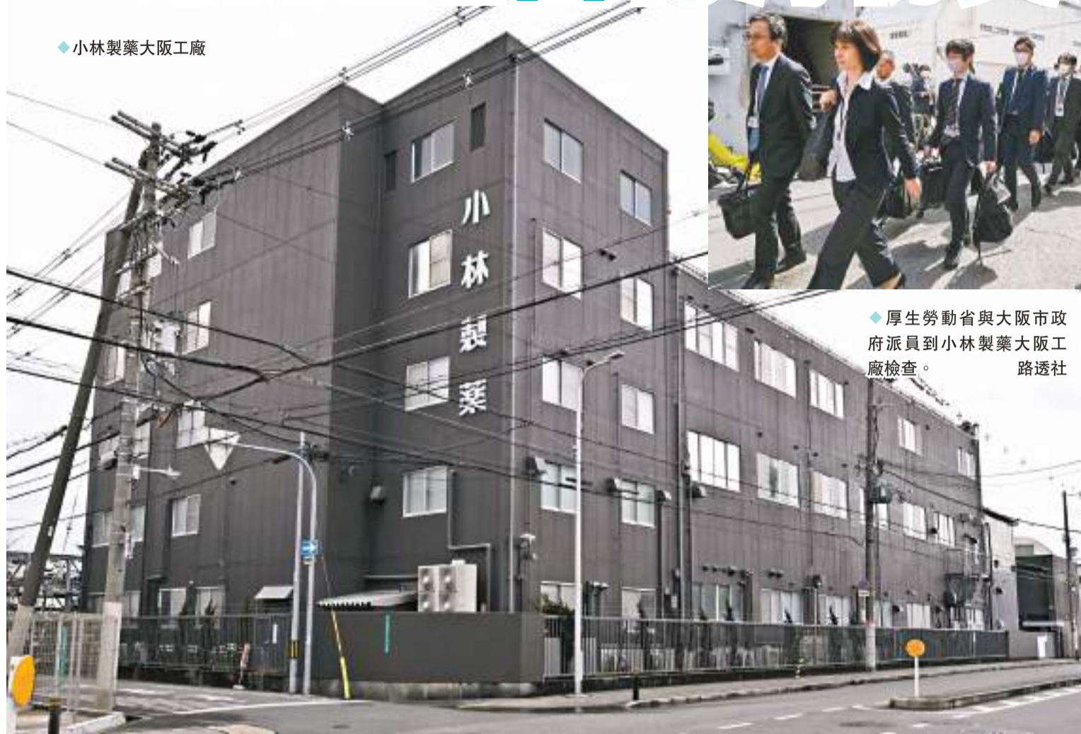
◆厚生勞動省與大阪市政府派員到小林製藥大阪工廠檢查。

香港文匯報訊 日本消費者服用小林製藥含紅麴保健食品後陸續罹患腎臟疾病，小林製藥不單在回收產品上拖延，連早於3月25日確認產品內摻雜含有毒性的「軟毛青黴酸」也未有公布，而是由厚生勞動省於3月29日公開，小林製藥再引來猛烈批評，該公司則辯稱是不想造成混亂。