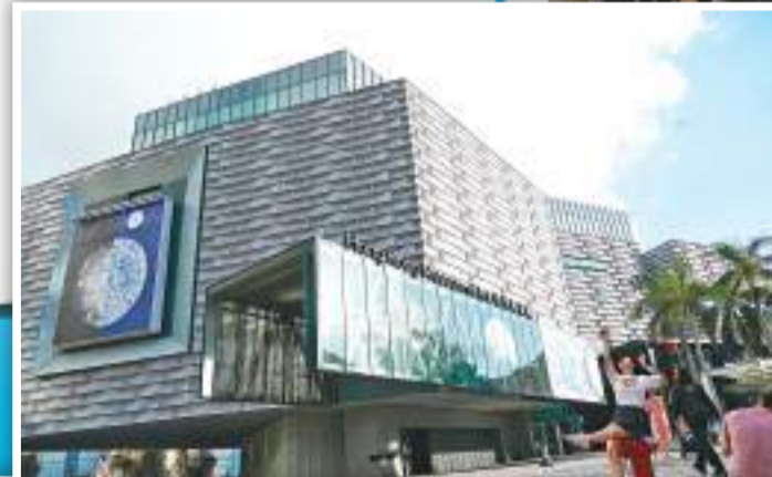
▲ 到香港藝術館可看「榮羅的詩想日常」展覽。