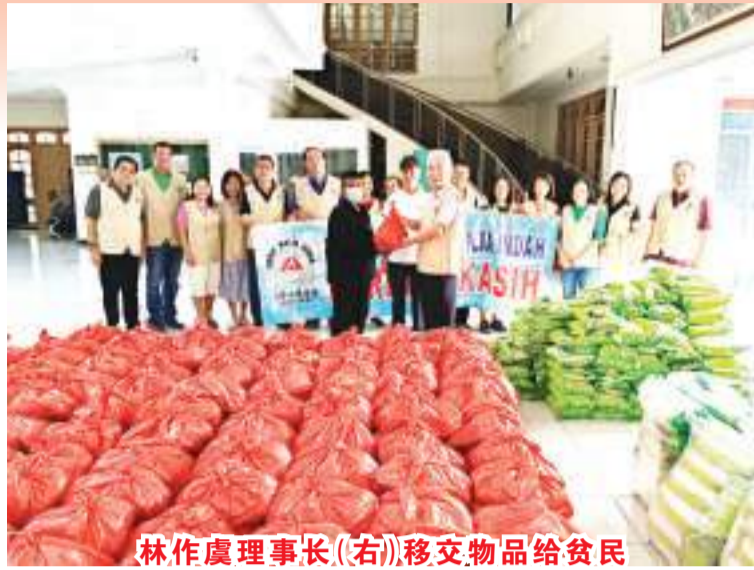
林作虞理事长(右)移交物品给贫民