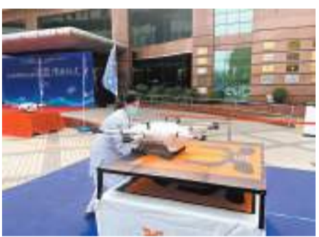
◆無人機抵達醫院，醫務人員取下血液樣本。