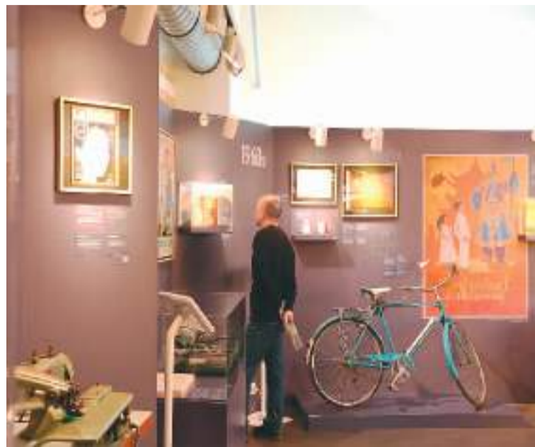
一名观众在法国巴黎举办的“甲子情深——中法百姓故事展”上参观。