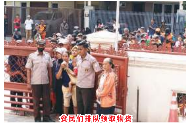
贫民们排队领取物资

协助物品分发工作。林作虞致辞表示，吉祥山基金会自成立迄今，每年在开斋前夕都例行开展了类似活动。希望通过此项慈善义举，能帮助这些低收入者的清洁工和保安员等贫困居民减轻一点生活负担，让他们在欢度节日时，切实感受到该会对他们的关怀和温暖。是日，整个物品分发过程非常顺利，直到中午圆满结束。